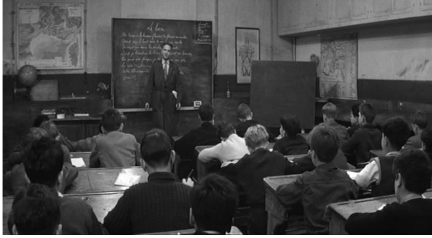
Fotoğraf 1. Filmin açılış sahnesi Antoine Doniel’in sınıfı ve edebiyat dersi (400 Darbe Görseller, https://www.google.com/search?q=400+darbe adresinden 01.06.2020 tarihinde erişilmiştir.)

görüntülerle anlatılmıştır. Bunlardan birisi de filmin başrol oyuncusu Antoine’ın sinemaya olan ilgisidir. Okuldan ve evden kaçan Antoine’ı mutlu eden tek şey en yakın arkadaşıyla okulu kırıp sinemaya gittiği anlardır. Bu anlatı; arkadaşıyla eğlendiği ve güldüğü yakın plan çekimlerle gösterilmektedir. Filmde ana konu olan Antoine’ın hayatı ve okul ile olan ilişkisinden uzaklaşmamış, izlek sürekli bu konu üzerinden işleyerek dramatik yapı güçlü tutulmuştur.