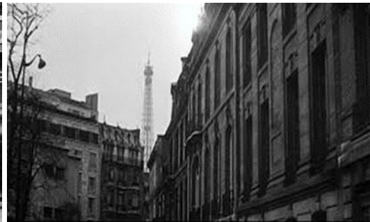
Fotoğraf 22. Eyfel Kulesi'nin görüntüsü