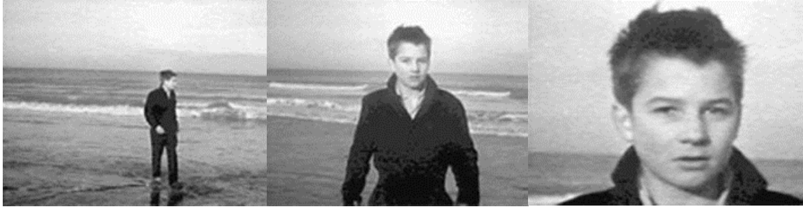
Fotoğraf 24. Antoine denize ulaşmıştır ama özgürlüğüne ulaşmış mıdır (400 Darbe Görseller, https://www.google.com/search?q=400+darbe 01.06.2020 tarihinde erişilmiştir.)