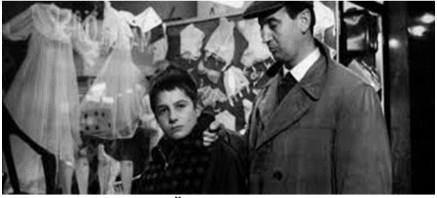
Fotoğraf 13. Üvey babası polise teslim eder

Dramatik yapıda bu kez ipler ailenin eline geçmiş, Antoine'den kurtulmanın fırsatını bulmuşlardır. Üvey babası Antoine'dan şikayetçi olur, annesi de oğlunu önemseyip yardımına gelmez. Bir çocuk olarak geceyi nezarethane suçlularla aynı hücrede geçiren Antoine çok korkmuştur. Gün ağarmadan ıslahevine gönderilir. Cezaevi arabasının içinde Paris sokaklarını geride bırakan Antoine'ın gözlerinden yaşlar süzüldüğü görülmektedir.