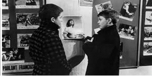
Fotoğraf 20. René ile sinema önünde