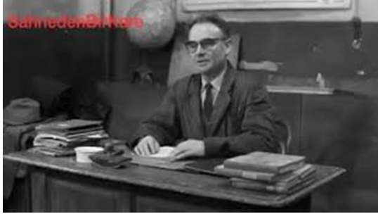
Fotoğraf 19. Edebiyat öğretmeni