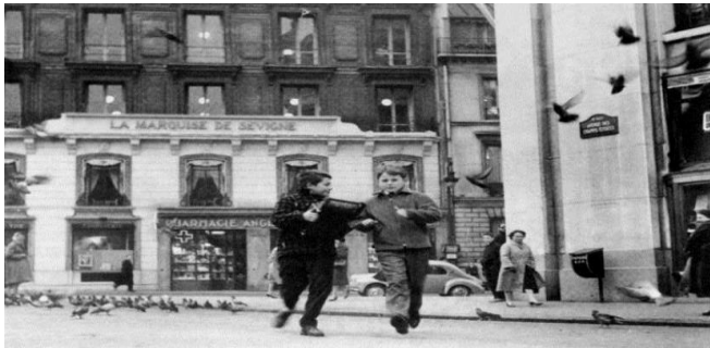
Fotoğraf 21. Filme plato olan Paris sokakları (400 Darbe Görseller, https://www.google.com/search?q=400+darbe 01.06.2020 tarihinde erişilmiştir.)