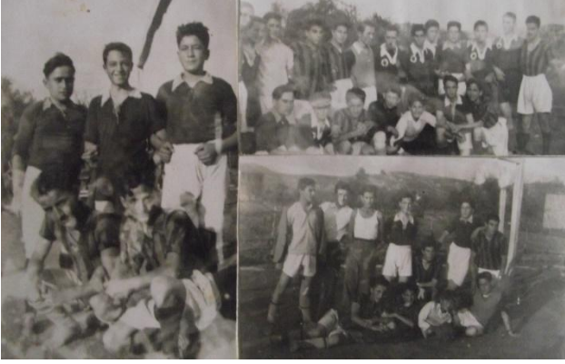
Resim 6. Bartın Spor Futbol kolu 1940'lı yıllar