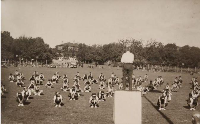
Resim 4. Bartın Halkevi Spor Kolu gençleri İdman Bayramı gösterileri (1936)