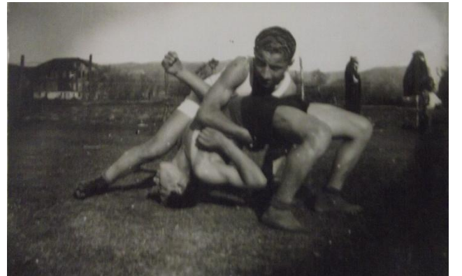
Resim 11. Kır koşusu öncesi güreş müsabakaları