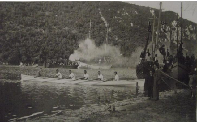
Resim 10. Kürek Çekme talimleri 1940'lı yıllar