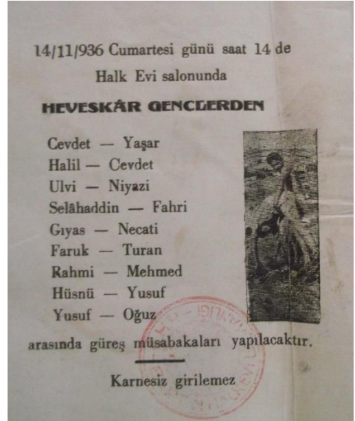
Resim 9. Güreş Müsabaka Davetiyesi