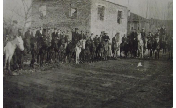
Resim 3. Binicilik kolunun Çayır köyü gezisi 1935