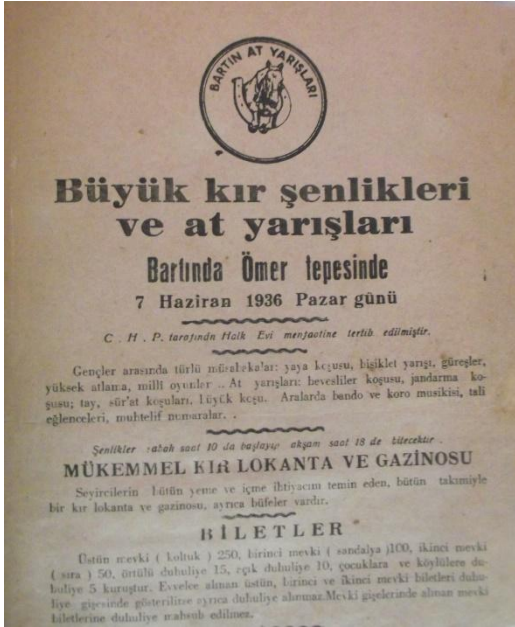
Resim 8. Kır Koşusu Afışı