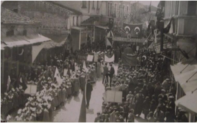
Resim 2. 23 Nisan resmigeçit töreni Halkevi önü - 23 Nisan 1935