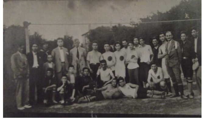
Resim 7. Spor Komitesi Voleybol Kolu Müsabaka Öncesi (1936)