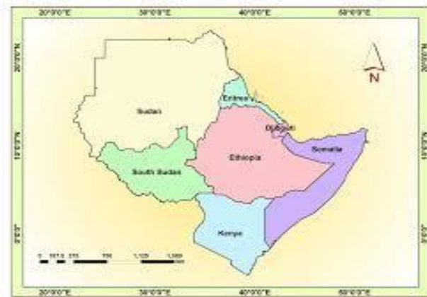
Şekil 2. Afrika Boynuzu Ülkeleri (Mekonnen, 2019, s. 6)

Politik anlamı açısından bakıldığında ise Afrika Boynuzu kavramı, uluslararası paydaşlara göre daraltılmış veya genişletilmiştir. Bu nedenle, Afrika Boynuzu kavramını ve bölgelerini tanımlamak biraz karmaşık hâle gelmiştir. Bazıları Afrika Boynuzu bölgesinin dört ülkeden oluşan bir bölge olduğunu öne sürmektedir. Bunlar; Somali, Cibuti, Etiyopya ve Eritre şeklinde sıralanabilmektedir. Başka bir görüşe göre de Afrika Boynuzu altı ülke olan Somali, Cibuti, Etiyopya, Eritre, Sudan ve Kenya'dan oluşmaktadır (Fatehu Rahman, 2012:165). Genel olarak ise Afrika Boynuzu; Somali, Cibuti, Etiyopya, Eritre, Sudan, Güney Sudan, Kenya ve Uganda ile birlikte sekiz ülkeyi kapsayan bir bölgedir (David, 2000:2). Buna dayanarak Afrika Boynuzu, geniş anlamda çeşitli müdahaleler ve etkilerle birlikte, bir bütün olarak Doğu Afrika ve Büyük Göllerin bir bölümünü kapsamaktadır. Böylece Afrika Boynuzu kuzeyden Kızıldeniz, kuzeydoğudan Aden Körfezi, doğudan Hint Okyanusu, güneyden Kenya, batı ve kuzeybatıdan Sudan Cumhuriyeti ile sınırlanmış bir bölgedir (Paul B., 1991:12). Stratejik anlamıyla son dönemde ise, Büyük Afrika Boynuzu ( The Greater Horn ) (Woodward, 2006:1) şeklinde adlandırılmaktadır.