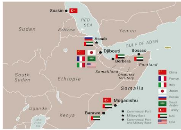
Şekil 4. Afrika Boynuzu'nda Uluslararası ve Bölgesel Rekabet (Jessica, 2019: Gulf state rivalries in the Horn of Africa: Time for a Red Sea policy?)

Afrika Boynuzu'nda varlık gösteren en aktif bölgesel aktörler ise İran, İsrail, Türkiye ve Körfezi ülkeleri şeklinde sıralanabilmektedir. Bu ülkelerin Afrika Boynuzu'nda özellikle ekonomik, siyasî ve askerî alanlarda politikaları mevcut görünmektedir.