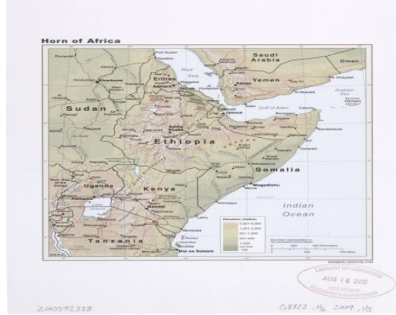
Şekil: Afrika Boynuzu'nun Coğrafi Konumu

Afrika Boynuzu'nun uzun tarihî boyunca bilinen isimlerinden Punt Ülkesi, Kuş Krallığı, Aksum Krallığı, Habeşistan, Biladussudan ve nihayetinde " Afrika Boynuzu " kavramı ortaya çıkmıştır. Afrika Boynuzu terimi, bölgenin gergedan boynuzu şeklini andıran coğrafi şeklinden kaynaklanmaktadır (Abdul-Râzzaq, t.y., s. 366). Coğrafi konum olarak Afrika Boynuzu, Hint Okyanusu tarafından güneye sınırlanan Afrika kıyılarının Babülmendep Boğazı'nda bir Doğu Afrika Arap Yarımadası ve kuzeyde Kızıldeniz kıyılarında boynuz şekline benzeyen bölgedir (Woodward, 2013:10). Arapça ansiklopedisinde Afrika Boynuzu, Afrika Kıtası'nın doğu kısmından Aden Körfezi'nin doğusuna doğru uzanan bir gergedan boynuzu şeklinde yükselen bir bölge olarak tanımlanır (Abdul Razzaq, t.y:366).