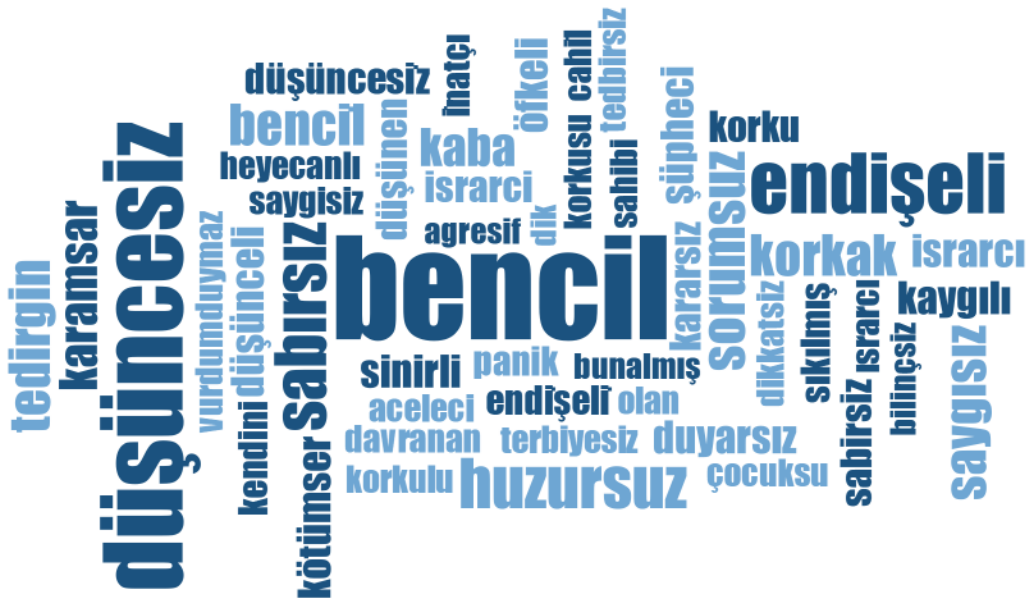
Şekil 1. Karantinadan Çıkmak İsteyen Kişiye Yönelik Zihinsel Temsiller Haritası

Katılımcıların karantinadan çıkmak isteyen kişinin özelliklerine yönelik algılarının sorulduğu birinci soru, nitel olarak incelenmiştir (şekil 1). Katılımcıların açık uçlu sorulara vermiş oldukları yanıtlarda karantinadan çıkmak isteyen kişinin cinsiyetine ilişkin algılarının birbirinden farklı olduğu görülmüştür. Karantinadaki kişinin ilk olarak cinsiyetinden bağımsız ortak özellikleri, ardından kadın ya da erkek olduğunu düşünüldüğü durumlarda ona atfettiği zihinsel temsiller incelenmiştir.