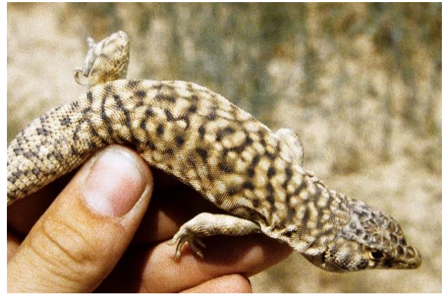
Şekil 1. Suriye'nin kuzeyinde (36.666°N 39.679°E) gözlenen Acanthodactylus harranensis örneği

açıklığının önündeki pulların pektinatlı; subocularis dördüncü ve beşinci supralabial arasına sıkışmış, ama dudak kenarına kadar ulaşmıyor; gularia 30; dorsalia 52; collaria 11; femoral porlar (sol) 25; kuyruğun proksimal pulları neredeyse düz, sonrasında karınalı; başın yan tarafında 5 koyu dikey bant mevcut; sırt tarafı ağ şeklinde desenli.