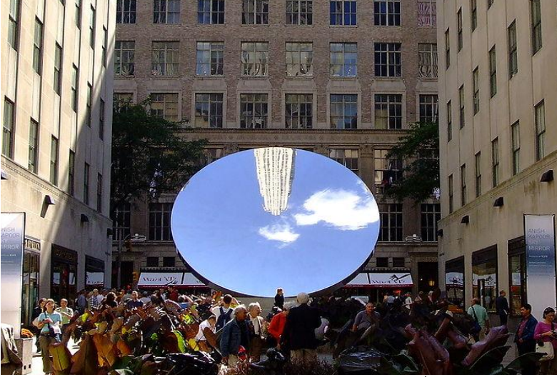
Resim 4: Anish Kapoor "Sky Mirror" 4

Yaşam işte bu farklılıkları özümleyebilme ve insanın temel özelliği olan duyumsama ve farklı dizgelerde hayal kurabilme zenginliği ile anlam kazanır. Yaşamı tekdüzelikten kurtaran, anlamlandıran, kimi zaman masalsı, kimi zaman çıplak gerçekçilikle yüzleştiren bu sanatsal yaratıcılık aynı zamanda düşünsel dinamizm kaynağı sayılır.