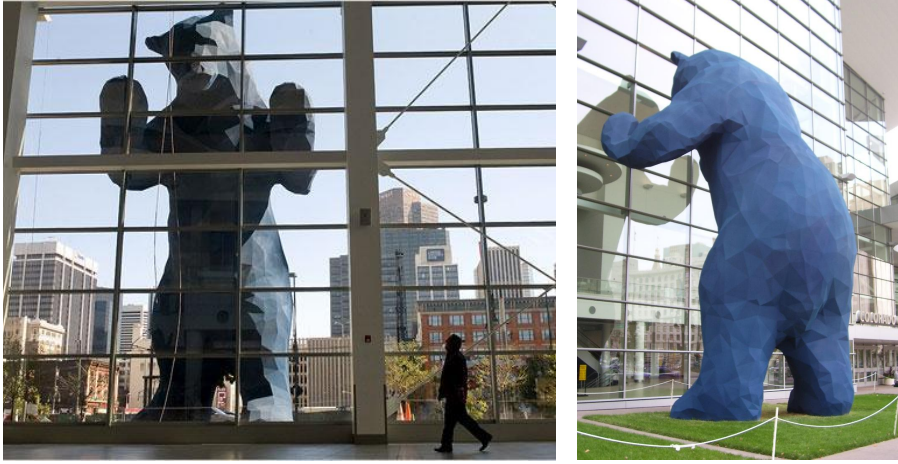
Resim 2: "I See What You Mean" Colorado Kongre Sarayı'nın içten ve dıştan görüntüsü 3

Lawrence Agent'in Colorado Kongre Merkezi için hazırladığı 2005 tarihli "I See What You Mean / Ne İma Ettiğini/Demek İstedğini Anlıyorum" adlı eseri sergilendiği çevre açısından büyük değişimlere neden olmuş. Çelik ve fiberglas çalışma özellikle ebatı ve rengi ile büyük dikkat çekmiş. Önceden beri mevcut olan bina, civarda yaşayan ve önünden geçen birçok kişinin dikkatini bile çekmezken, 12 m'lik dev mavi ayının yerleştirilmesi sonrasında herkesin fark ettiği, merak sardığı bir yapı halini almış.