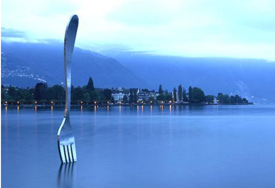
Resim 5: Sanatçı Jean Pierre Zaug'un Cenova Gölü yerleştirmesi "Dev Kaşık"1995 5

Kimi zaman da kendini evrenin merkezi olarak gören insana, evrende kendinden büyük varlıkların dokunuşlarını gösterir. Jean Pierre Zaug'un Genova'da Alimentarium Food Museum için Genova Gölü'ne sapladığı dev çatal tam da bu dokunuşun izini taşır. Sanki Gulliver çatalını göle saplamıştır. Çalışma aynı zamanda doğal kaynakların sınırsızca tüketilmesi şeklinde de yorumlanabilir.