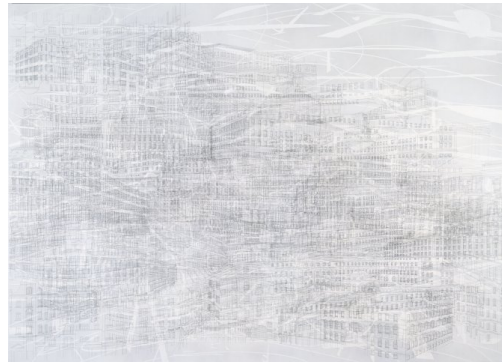
“Berliner Platze”, Julie Mehretu, 2008-09

Mehretu resimlerinde genellikle sosyal ve politik yansımaların olduğu mekanları seçer. Tarihsel olarak sembol teşkil etmiş, sosyal değişimin gerçekleştiği yerlere odaklanır genellikle.