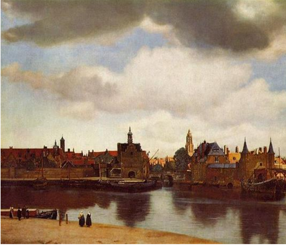
“Delft Manzarası”, Johannes Vermeer, 1660-61

19. yüzyıl’da demiryolu taşımacılığının başlamasıyla gelen sanayi devrimiyle birlikte birçok ülkede kentleşme hareketleri başlamıştır ve dünyadaki birçok büyük şehrin nüfusu, bu dönemde bir milyonun üstüne çıkmıştır. Sanatçılar, kenti hem resmettikleri konunun arkasında destekleyici bir fon hem de kentin yapısını ve mimarisini dışavurumcu bir yaklaşımla aksettirmişlerdir. Monet’nin 1877’de endüstriyel devrimin şehirdeki etkilerini gösteren “Charing Cross Köprüsü” ve “La Zare Garı”, Camille Pissarro’nun “Boulevard Montmartre” serisi, Kirchner’in “Berlin’de Sokak Manzarası”, Max Becmann “Demir Köprü” resimleri bunlardan bazılarıdır.