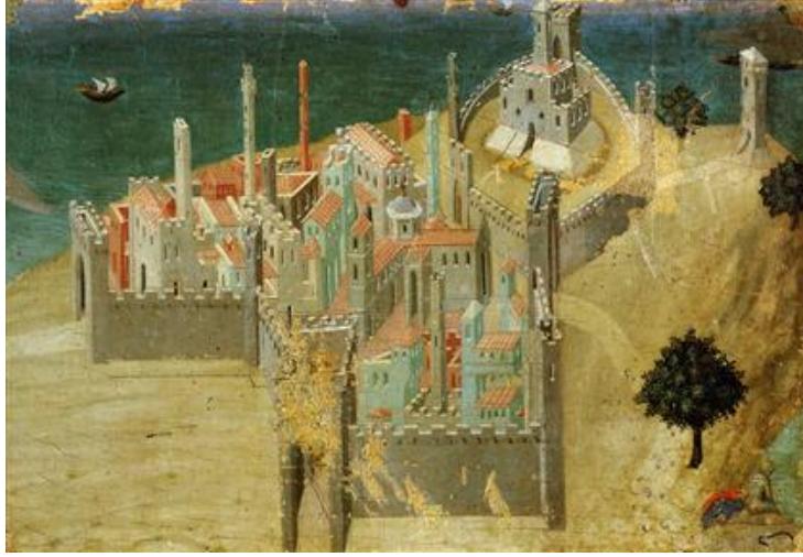
“City by the Sea”, Ambrogio Lorenzetti, 1335

(1255-1318), Cimabue (1240-1302) gibi sanatçıların rolü büyüktür. Ambrogio Lorenzetti (1290-1348) 1335 yılında yaptığı fresco (City by the Sea) ile batı sanat tarihinin ilk gerçek kent resmi örneğini vermiştir.