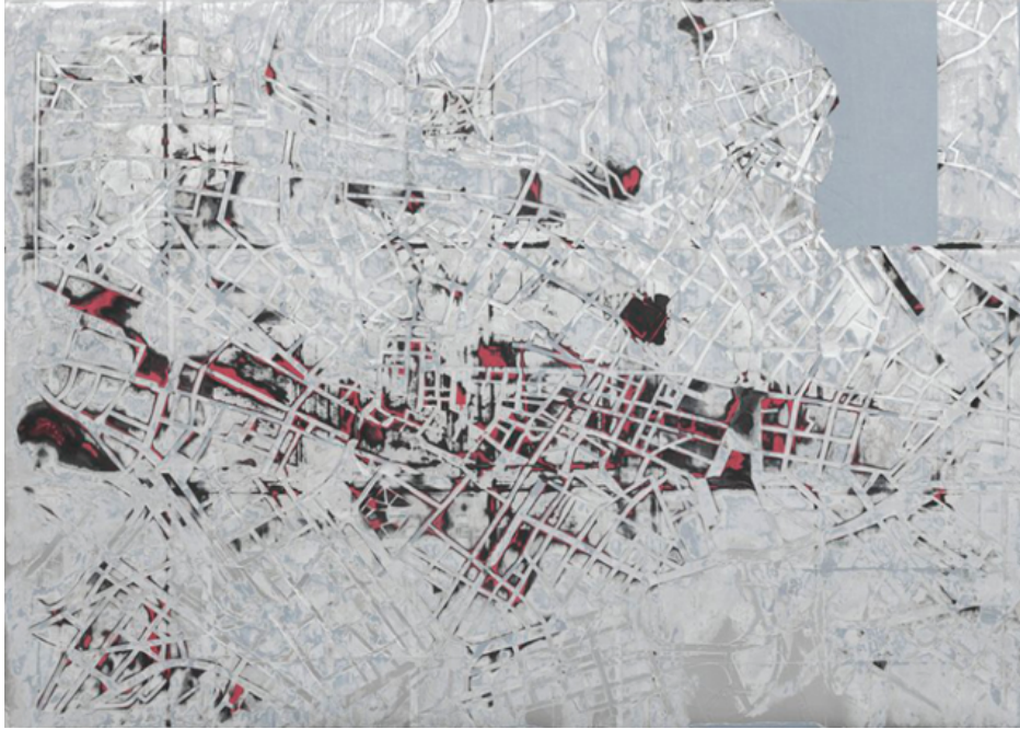
“Şişedeki Cadı”, Mark Bradford, 2012

Bradford’un kent görüntülerinin çoğu belli şehirlerin ya da bölgelerin uydudan çekilmiş resmi görünümü verir. Hatta sanatçı bunun için “Google Earth” adlı bilgisayar uygulamasından yardım alır. Bradford resimdeki bu uygulamasını video, enstelasyon ve baskı gibi pratiklere de yansıtmıştır. 2008’de enstelasyonlarından birinde, Katrina Kasırgası’nda