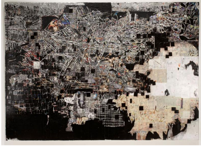
“110. Caddenin Karşısı”, Mark Bradford, 2008