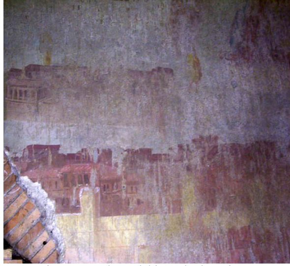
Trajan Hamamları'ndaki Freskodan Bir Detay

Ortaçağ boyunca şehrin resme yansması, el yazmalarındaki resimlemelerde, herhangi bir özel rolü olmayan arka plan resimleri olarak kendini göstermiştir. 13. yy. sonu ile 14. yy. başlarında ortaya çıkan ve topografik bir doğrulukta şehirleri ve şehre ait yerleşimleri resimleyen çalışmalar göze çarpar. Jean Fouquet'nin (1420-1481) 15.yy.'ın Paris'ini betimleyen resimlemelerinin sayısı çok fazla olmakla birlikte bu yüzyılda başta Köln, Münih Viyana, Zürih gibi kentler sanatçılar tarafından resimlenmiştir.