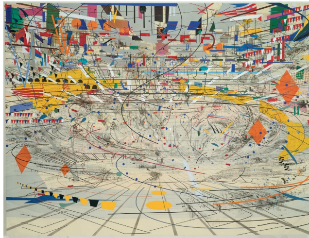
“Stadya II”, Julie Mehretu, 2004

“Bradford’un bir yapı sistemi içinde, katmanlı bir arkeolojik mekan yaratan, farkedilebilir harita formatlı denemelerine karşın, Mehretu görsel sanatta modern kent yaşamını haritalandırabilecek çok daha dinamik bir yorum sunar” (Brown, 2010). Mehretu’nun resimlerinde mimari öğelerle birlikte şehir planlaması haritalarını andıran, hatta andırmaktan da öte direk bir şekilde çağırıştıran katmanlar vardır.