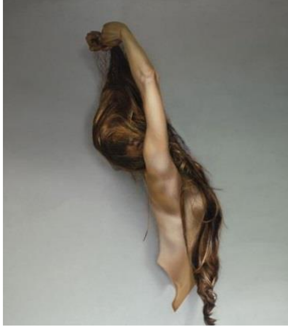
Resim 3. Taner Ceylan, "Et Kafesi", T.Ü.Y.B., 180x160 cm., 2012.