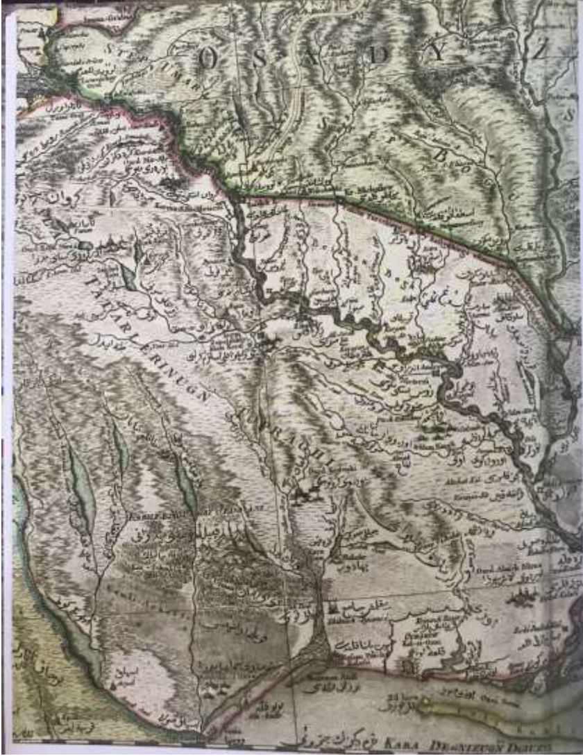
Ek 3: Polonya ile Kırım-Osmanlı Sınır Haritasının Doğu Ucu, 1772.