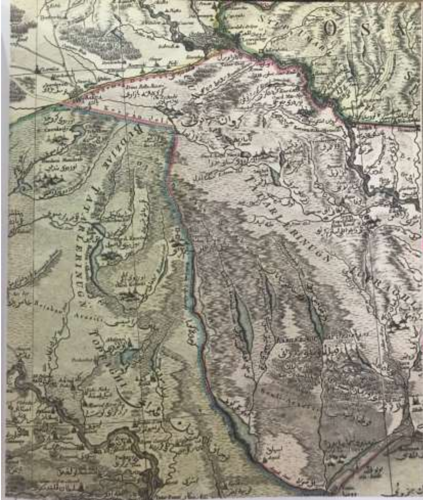
Ek 2: Polonya ile Kırım-Osmanlı Sınır Haritasının kuzey tarafı, 1772.