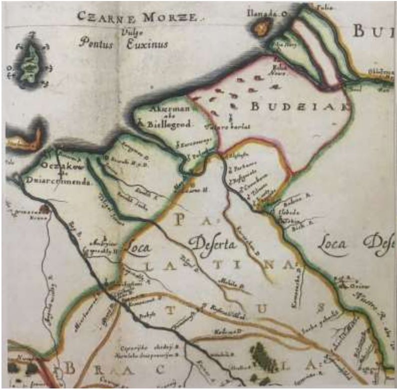
Ek 4: Akkerman, Kazsubi (Hacıbey) ve Özi (Oçakiv) gibi önemli merkezlerin bulunduğu Özi kıyı deltası haritası, 1648.