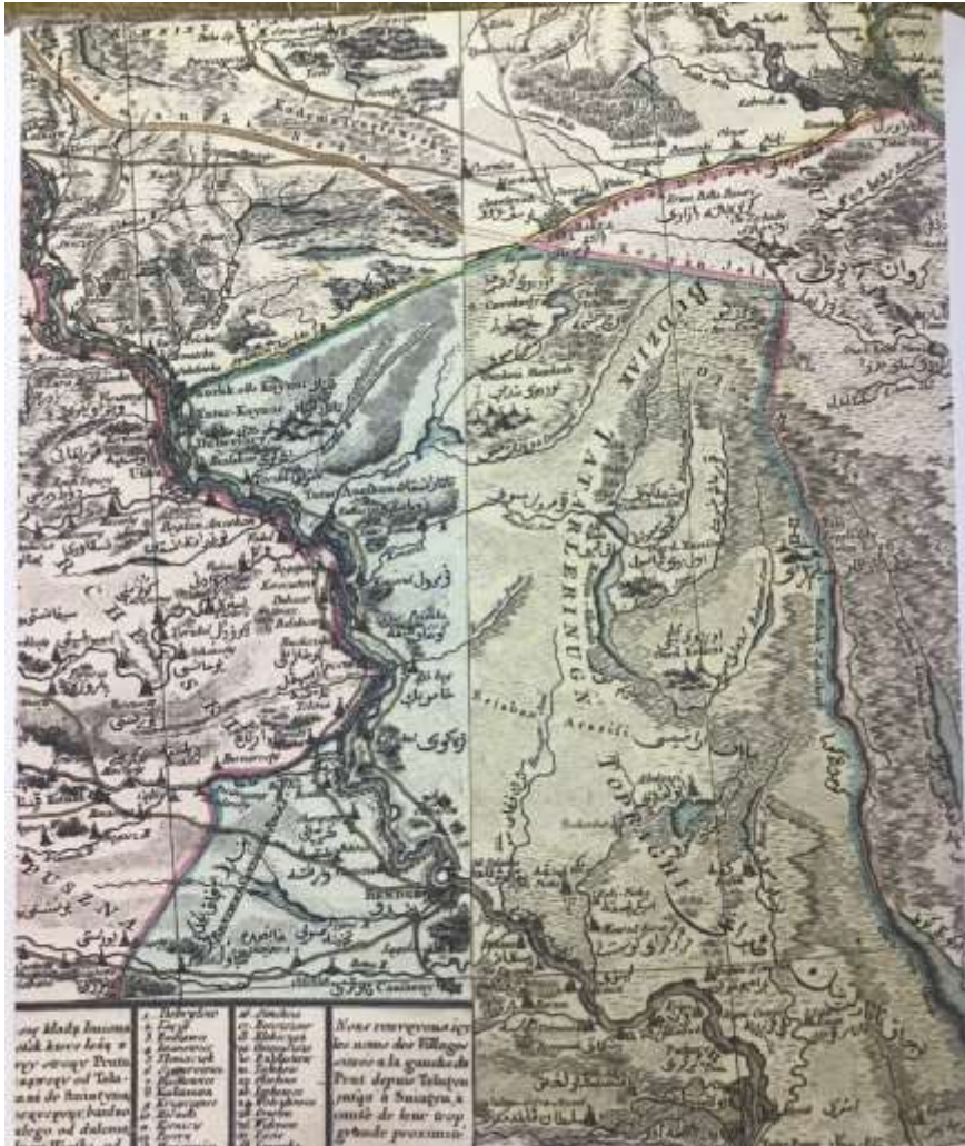
Ek 1: Polonya ile Kırım-Osmanlı Sınır Haritasının Batı Ucu, 1772.