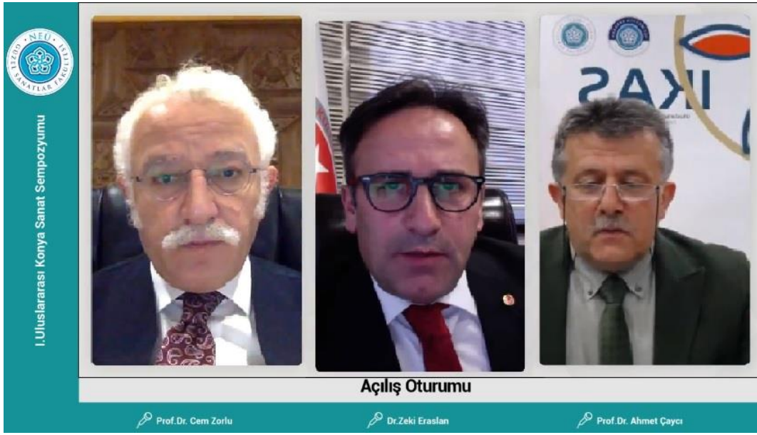
Resim 2: Açılış Oturumu