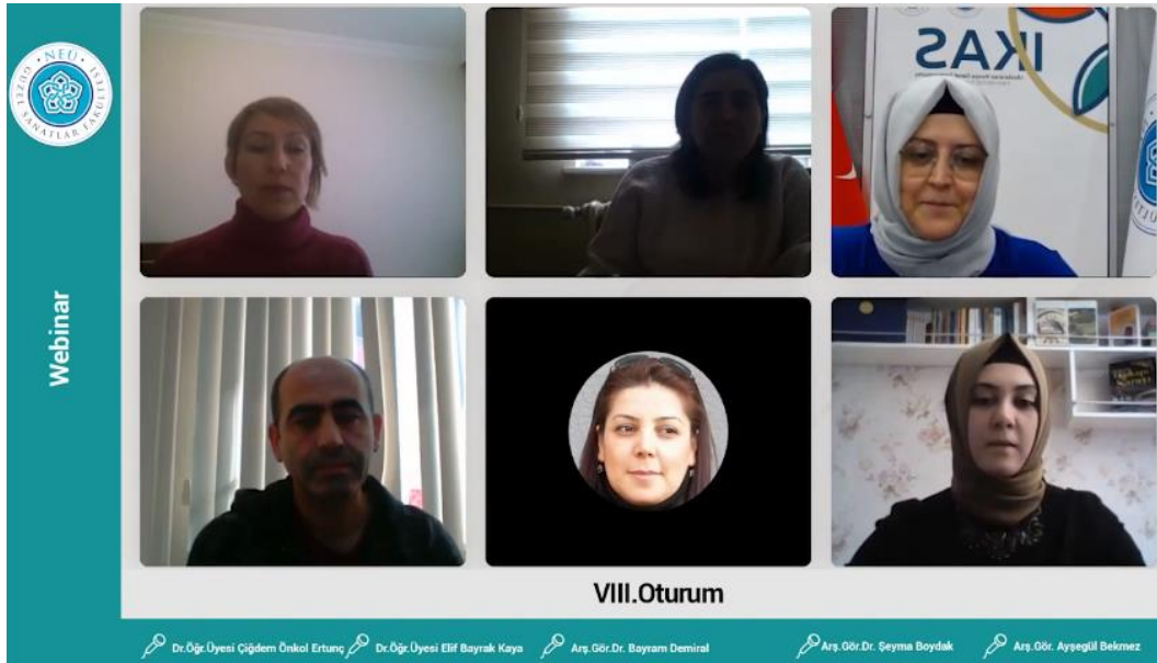
Resim 3: 06 Kasım 2020 Cuma 8. Oturum