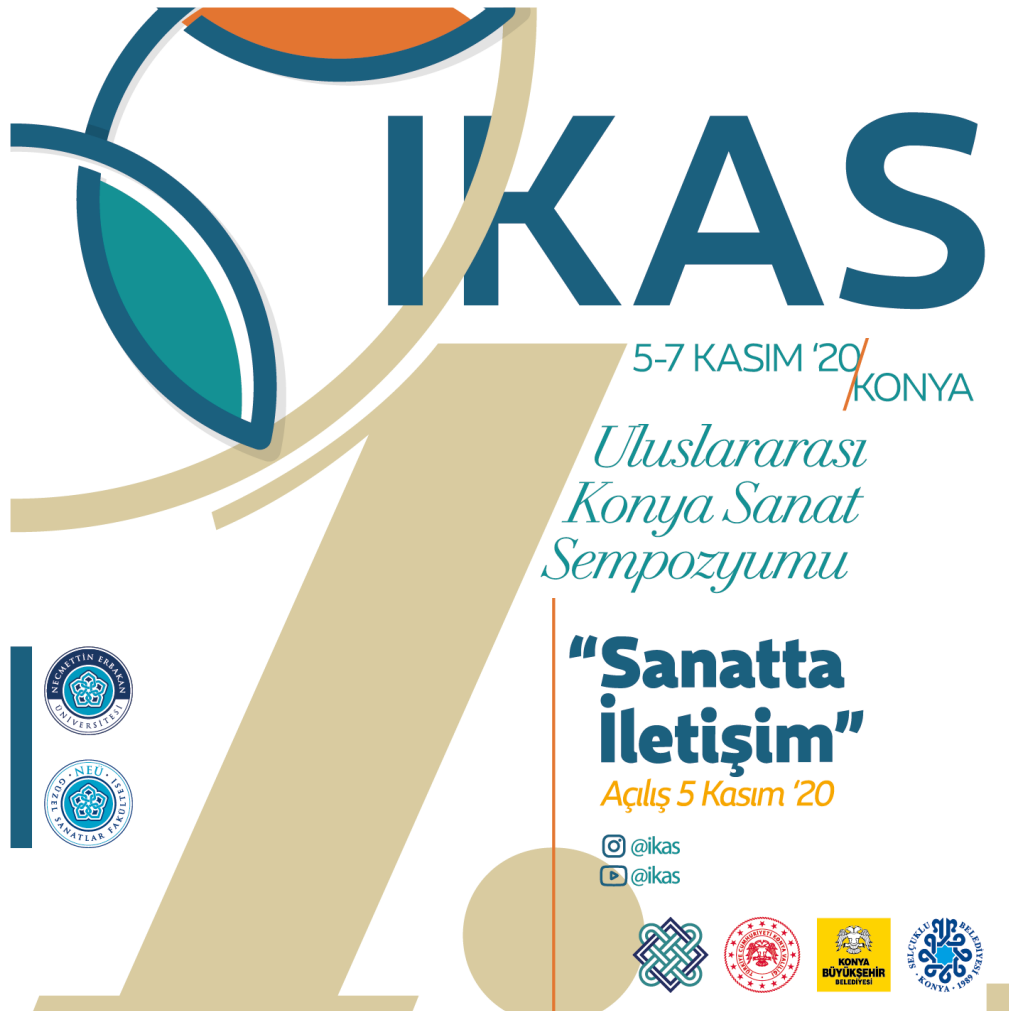
Resim 1: IKAS 1.Uluslararası Konya Sanat Sempozyumu Afişi