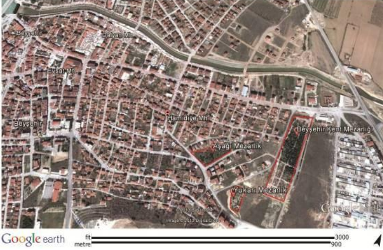
Harita 1: Beyshehir Hamidiye Mahallesi mezarlık alanlarının haritası (Google Earth'den).