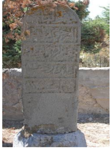
Fotoğraf 39: Ali Ağa'nın taş bir kaide üzerinde yükselen mezar taşı (37).