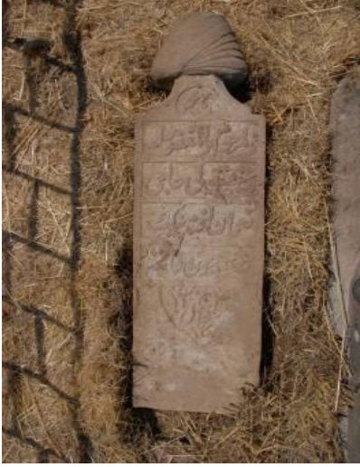
Fotoğraf 30: Hacı Numan Efendi'nin yerinden sökülmüş baş taşı (28).