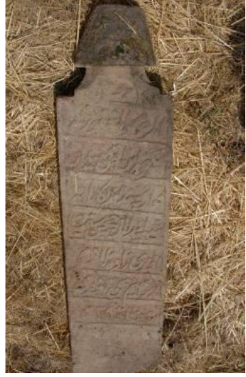
Fotoğraf 35: İbrahim Hakkı Efendi'nin yerinden sökülmüş baş taşı (33).