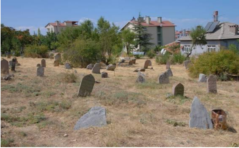
Fotoğraf 1: Beşehir Hamidiye Mahallesi Aşağı Mezarlık genel görünümü.