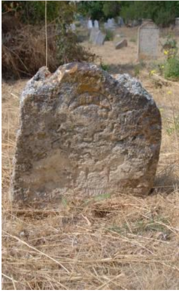
Fotoğraf 12: Orshoy sülalesinden bir kişiye ait olan mezar taşı (10).