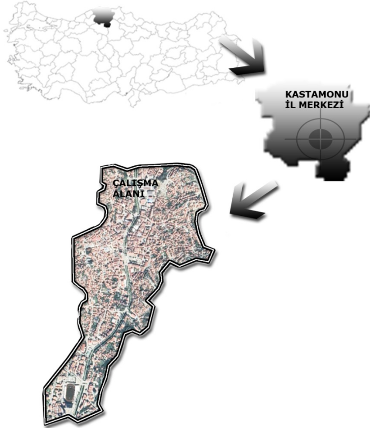
Şekil 1. Çalışma alanı konum haritası

görülmektedir. Dağlık alanların oldukça yaygın olduğu Kastamonu'nun %74,6'sı ormanlarla kaplıdır. İlde Ilgaz Dağı, İstiklal Yolu ve Küre Dağları Milli parkı olmak üzere üç önemli milli park bulunmaktadır (Öztürk 2005).