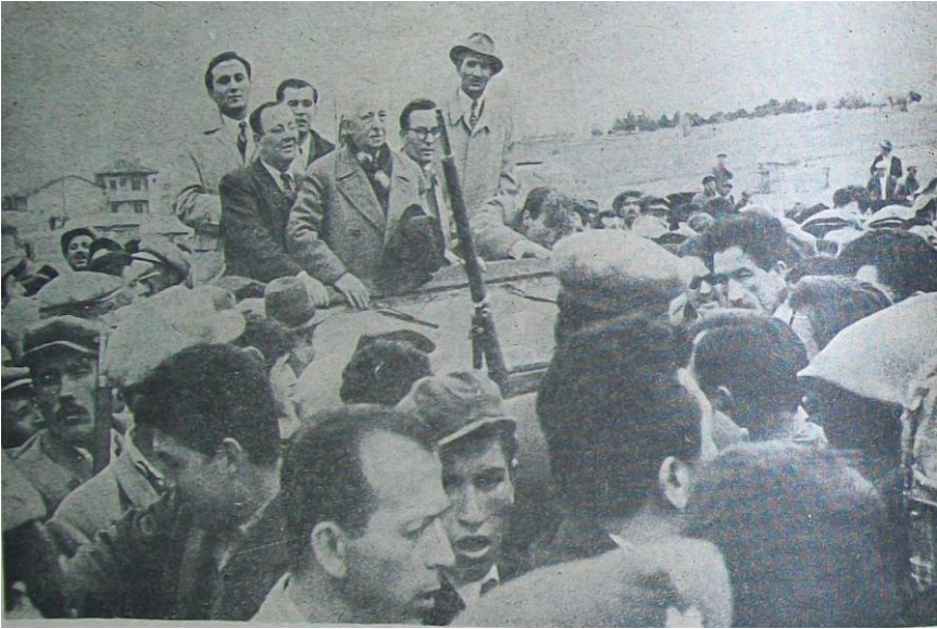
İsmet İnönü’nün Tren İstasyonundan Şehre Doğru İlerleyişı (Metin Toker, İsmet Paşayla 10 Yıl, Cilt:2 (1957-1960) , Ankara, 1966, s.174)