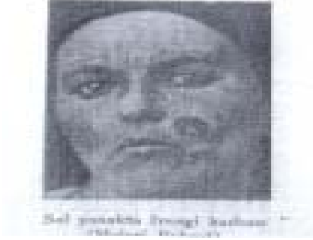
Şekil 7 Frengili bir kadın