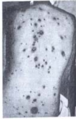
Syphilitik şekerleme (E-neg) (Trakt de Janssen) den