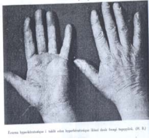
Şekil 9 Ellerde görülen Frengi belirtileri