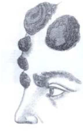
Şekil 3 Frengili bir yüz