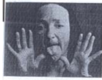
Ötölle Plaqueın ımpırcıma, ve elerde Şepkıköle şapıdı - aşırılaşma. (D, B.)