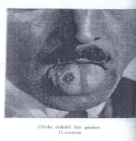
Şekil 12 Parmakta ve Dilde çıkan Frengi yaraları