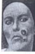
Şel yanakta frengi karbanı (Hücum Beket)