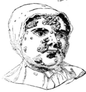
Şekil 1 Frengili bir kadın