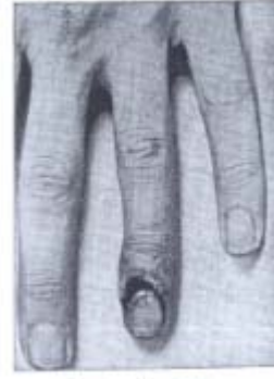
Şekil 10 Parmakta çıkan Frengi yarası