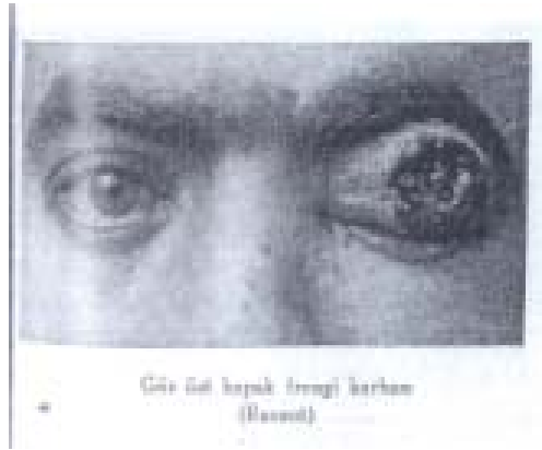
Şekil 4 Gözde çıkan Frengi yarası (Haksoy)