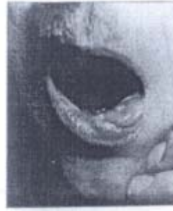
Alt dudakta şekerleme şekerleme kashıması (Gangarot)