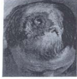
Şekil 2 Başta çıkan Frengi yarası (Haksoy)