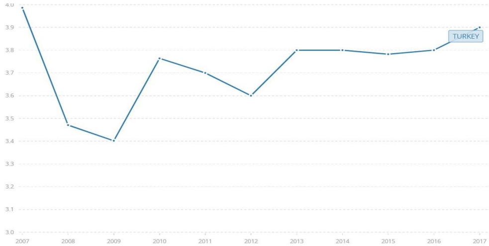
Grafik 1. Türkiye'de Yıllar İtibarıyla Gümrük Prosedürlerinin Etkinliği Puanı