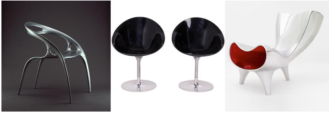
Şekil 16. Go Chair, Ross Lovegrove, 1998-2001, (URL-31); Ero/S Black Chairs, Philippe Starck 1999, (URL-32); Orgone Chair, Marc Newson, 1993, (URL-33).