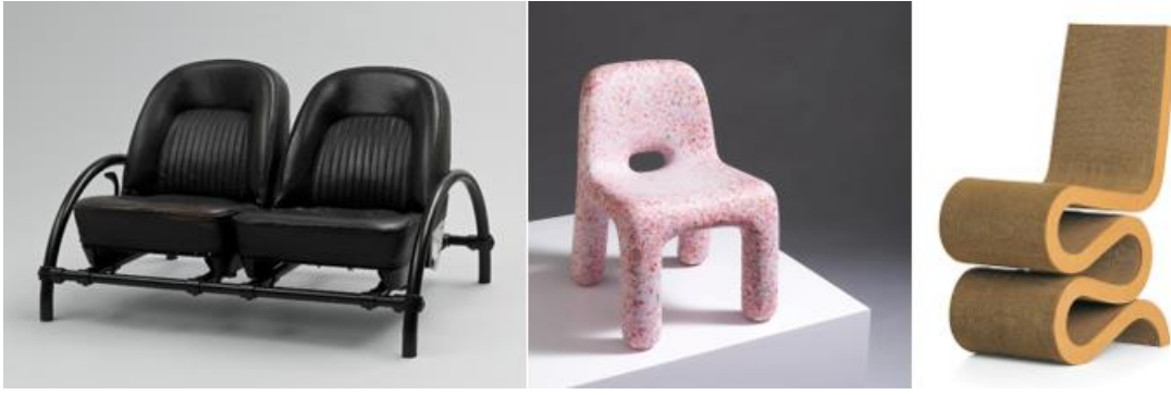
Şekil 12. Rover Chair, Ron Arad, 1981 (URL-20), Seramik Atıklarından Yapılmış Sandalye Chair Charlie, Ecobirdy (URL-21), Atık Kartondan Yapılmış Wiggly Side İskemle, Frank Gehry, 1972, (URL-22).