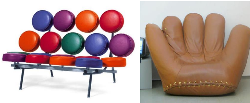
Şekil 9. Marshmallow Sofa, George Nelson, 1956 (URL-14); Paolo Lomazzi Joe Chair, 1970 (URL-15).