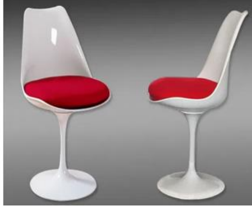
Şekil 15. Organic Chair, Charles Eames & Eero Saarinen, 1940 (URL-29); Lale Sandalye Eero Saarinen, 1940 (URL-30).

İçinde bulunduğumuz 21. Yüzyıl, Modernizmin etkilerinin devam ettiği Vintage ve Yeni Barok ya da diğer adıyla Modern Barok, Hi-tech gibi eski tasarımlara atıfta bulunan yeni üslup arayışlarının yer aldığı bir dönemdir. Çağdaş "Yeni Modernist" tasarımlar, Modernizm ilkelerine saygı göstermekte; basit ergonomik formlar ve bilinçli olarak doğaldan yenilikçi sentetiklere kadar değişen malzemelerle işleve odaklanan tasarımlar ortaya koymaktadır. Organik ve modern formlara geri dönmenin yanı sıra, Zaha Hadid, Frank Gehry gibi çağdaş mimar-tasarımcılar tarafından akışkan kalıplanmış organik formları yeniden keşfetmek için modern malzemeler kullanan bir tasarım anlayışı ön plana çıkmaktadır. Çevresel etki ile ilgili endişeler, giderek daha teknolojik hale gelen mekân ortamları için çevreci mobilyaların üretimini desteklemektedir. Ayrıca Barok üslubun çağdaş yorumları Philippe Starck gibi tasarımcılar tarafından mobilya tasarımına yön vermektedir. Tüm bu mobilyalar oldukça faydacı, minimal ve heykelsidir (Şekil-16).