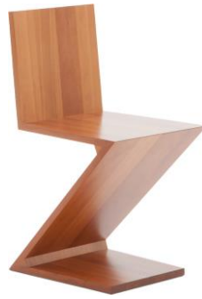
Şekil 4. Zigzag İskemle (1934), (Mori, Obuchi vd, 2016:257).