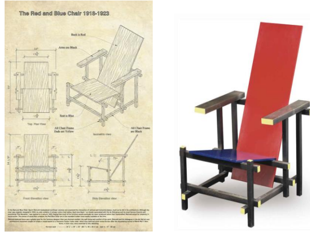
Şekil 3. Red and Blue İskemlesi Teknik Çizim ve Prototipi, Gerrit Rietveld (URL-5).