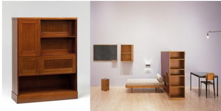
Şekil 1. Adolf Loos Tasarımı Kitaplık, 1903 Viyana (URL-2) ve Le Corbusier ve Charlotte Perriand Tasarımı Bir Odada Mobilyalar (URL-3).

20. yüzyılın başında Adolf Loos'un "Süs suçtur" manifestosu sadeliğe verilen önemi anlatmaktadır. Esasen bir mimar olan Loos, dönemin Gesamtkunstswerk -Bütüncül Tasarım anlayışı gereği tasarımın her alanında eserlerini ortaya koymaktaydı (Şekil-1). Bu anlayışa göre bir mimar sadece binaları tasarlamakla kalmıyor içindeki mobilyaları ve diğer nesnelere de tasarlayabiliyordu. Le Corbusier ise yaşamı kolaylaştıran diğer gereçler gibi evin de ekonomik ve teknik olanaklar ölçüsünde modern insanın ihtiyaçlarını karşılayan bir gereç olduğunu savunmuştur (Boyla, 2012, s.102) (Şekil-1). Bu dönem, Joseph Gocar başta olmak üzere Kübist tasarımcıların yapmış olduğu süsten arınmış mobilya tasarımları ile Modernizmin doğuşuna öncülük eden bir aşama olarak kabul edilmektedir (Şekil- 2). Esasen Kübik mobilya Kübik mimariden etkilenmiştir. Günümüzde Prag Kübizm Müzesi'nde özgün Kübik mobilya örneklerini görmek mümkündür (Şekil-2).