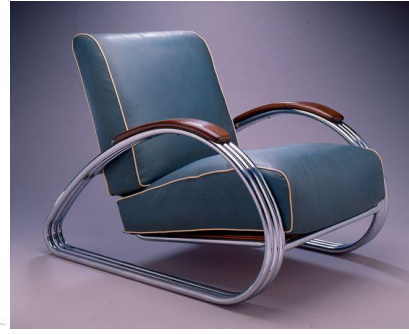
Şekil 6. Day Bed, Jacques-Emile Ruhlmann, 1920 (URL-9), Streamline Bir Koltuk (URL-10).