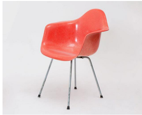
Şekil 10. Egg Chair, Arne Jacobsen , 1958; DAX Shell Armchair (URLI-16) , Charles &Ray Eames , 1953 (URL-17).