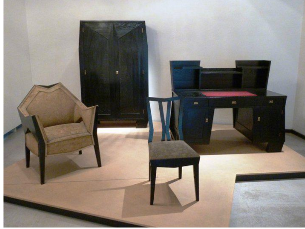
Şekil 2. Çek Asıllı Tasarımcı Joseph Gocar'ın Kübik Mobilya Tasarımları, Kübizm Müzesi Prag (URL-4).