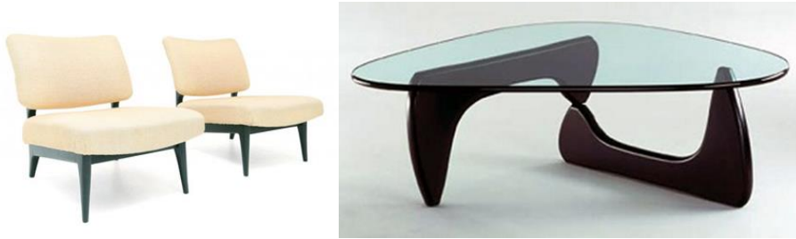
Şekil 7. Easy Chair, Jos De Mey, 1950 (URL-11); Noguchi Table, 1947, Isamu Noguchi (URL-12).

20. yüzyılın en önemli tasarım akımı olmasına rağmen bütüncül tasarım anlayışının egemen olduğu Modernizm hareketinin temeli 19. Yüzyılın ortalarında atılmaya başlamıştır. Özüde daha işlevsel ve sade olana yönelme fikri yer almaktaydı ve modernleşme sürecinin gelişmesinde, biçimlenmesinde kültürel, toplumsal ve politik alanlarda yaşanan büyük kargaşaların etkisi olmuştur (Şekercioğlu, 2017, s. 47). Isamu Noguchi, Marcel Breuer, Eileen Gray, Jos De Mey, Mies Van Der Rohe, Le Corbusier önemli mobilya tasarımları ile döneme imzalarını atmışlardır ( Şekil- 7).