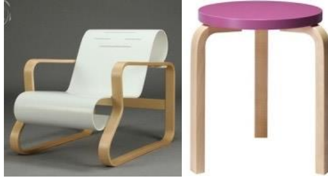
Şekil 8. Alvar Aalto Tasarımı Koltuk ve Tabure (URL-13).