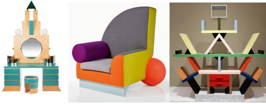
Şekil 13. Plaza, Michael Graves, 1981 (URL-23); Bel Air Chair, Peter Shire, 1982 (URL-24), Kitaplık, Ettore Sottsass, 1981 (URL-25).