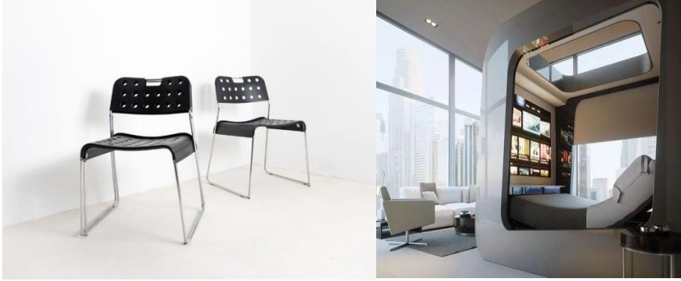
Şekil 11. Omstak Chair, Rodney Kinsman, 1972 (URL-18); ve Günümüzde Hi-Tech Mobilyada Akıllı Teknoloji Kullanımı (URL-19).

yaklaşım ile ele alınmaktadır (Şekil-11). Akıllı ev teknolojileri kapsamında uzaktan kontrol sistemleriyle teknolojik ev gereçlerinin mobilya ile entegrasyonu söz konusu olduğu gibi mobilyanın da yüksek teknolojik ilavelerle geliştirilmesi mümkün olmuştur. Örneğin dijital mobil cihazlara şarj imkanı sunan kanepeler, sensörlü dolap içi aydınlatması olan mobilyalar ya da dijital yatak, dijital giyinme odaları gibi örnekler mevcuttur (Demirarslan ve Demirarslan, 2020, s.571). Ayrıca 3D Yazıcı sistemlerinin kullanımıyla mobilyanın çok daha basit bir şekilde üretimi mümkün hale gelmiştir. Yapay zekâ teknolojisinin mobilyaya uyarlanması ile akıllı mobilya sistemlerinin 21. Yüzyılda yaygın bir şekilde kullanılacağı öngörülmektedir.