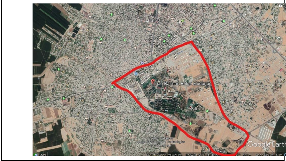
Şekil.1. Batman ve TPAO Bölgesi