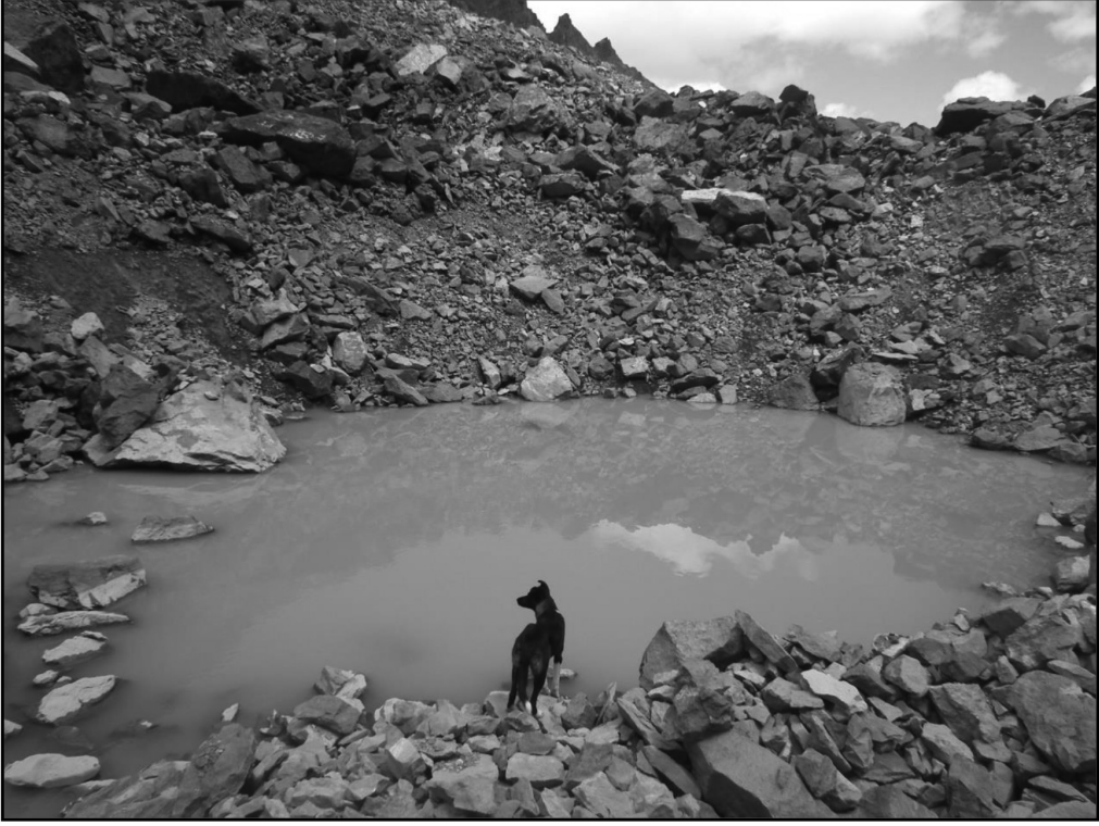
Şekil 5. Karçal kaya buzulu kenarındaki su birikintisi (Görüntü tarihi: 20.08.2013). Figure 5. A puddle which is near of the Karçal rock glacier (View date: 20.08.2013).