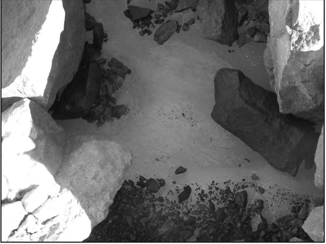
Şekil 4. Gözle görülebilen Sakız buz çekirdeği. Figure 4. Sakız ice core.

me alanları aynı alandır ve gerilemektedir. Kaya buzullarının hareketi sirk yamacına doğrudur. Bu nedenle tartışma yazarının yaptığı yorumların hiç bir geçerliliği yoktur.