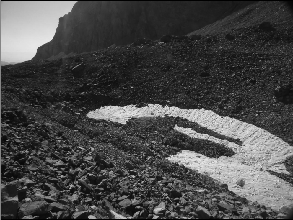
Şekil 6. Tartışma yazarı tarafından varlığı iddia edilen Karçal kaya buzulu supraglasyal gölü (Görüntü tarihi: 14.08.2014). Figure 6. The Karçal rock glacier supraglacial lake which is claimed by the author (View date: 14.08.2014).