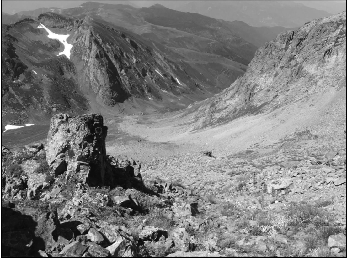
Şekil 3. Tartışma yazarı tarafından kaya buzulu sanılan moloz yığınları. Figure 3. The debris masses are supposed by the author.

ki kaya buzullarının oluştuğu dönemdeki, sıcaklık ve yağış değerlerinin günümüzdekinden daha düşük olduğunu da göz önünde bulundurmak gerekmektedir.