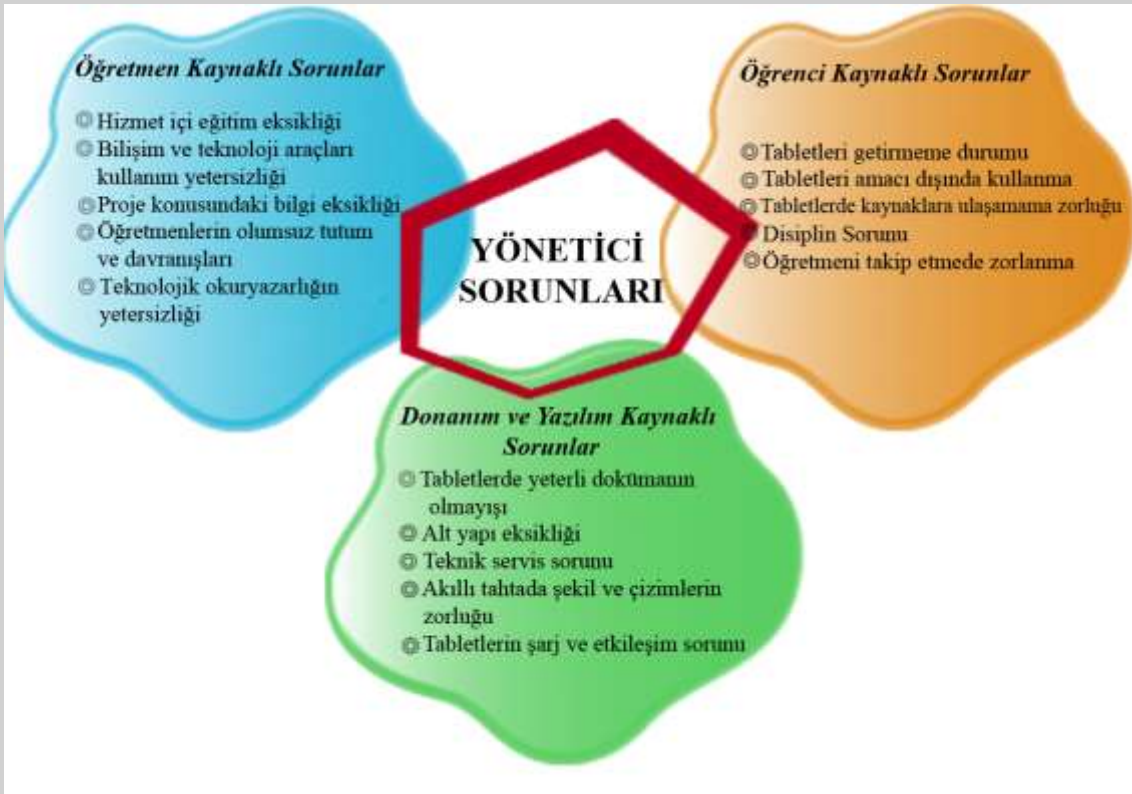
Şekil 1: Yöneticilerin FATİH Projesinin Uygulama Aşamasında Karşılaştıkları Sorunlar

Yöneticiler, FATİH Projesinin uygulama sürecinde karşılaşılan sorunları; öğretmen, öğrenci, donanım ve yazılım kaynaklı sorunlar olmak üzere üç tema şeklinde ifade etmişlerdir. Araştırmaya katılan yöneticiler Y 1 ve Y 2 şeklinde kodlanmıştır.