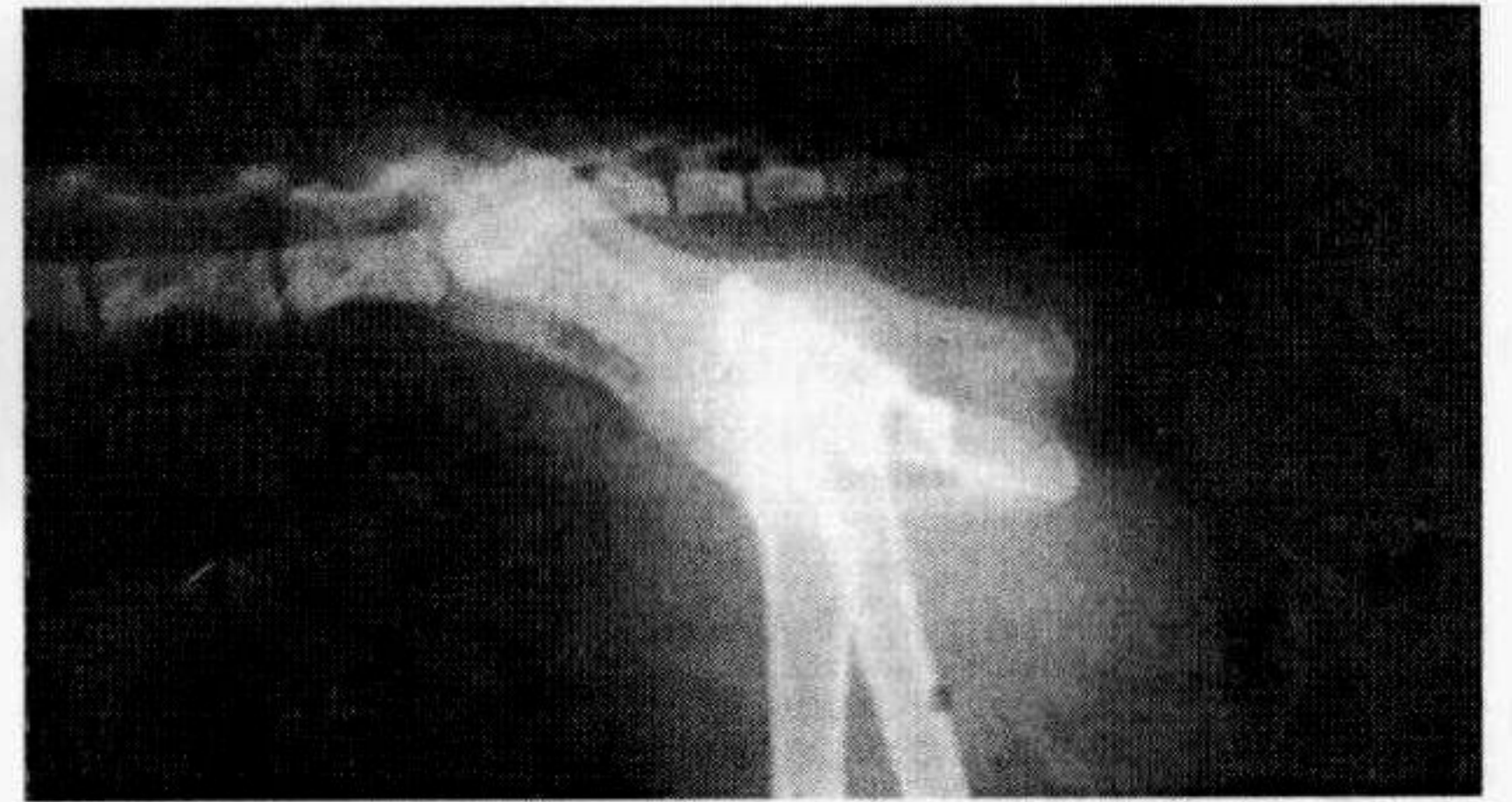
Şekil 4. Olgu no: 8'in operasyon sonrası radyografik görünümü.