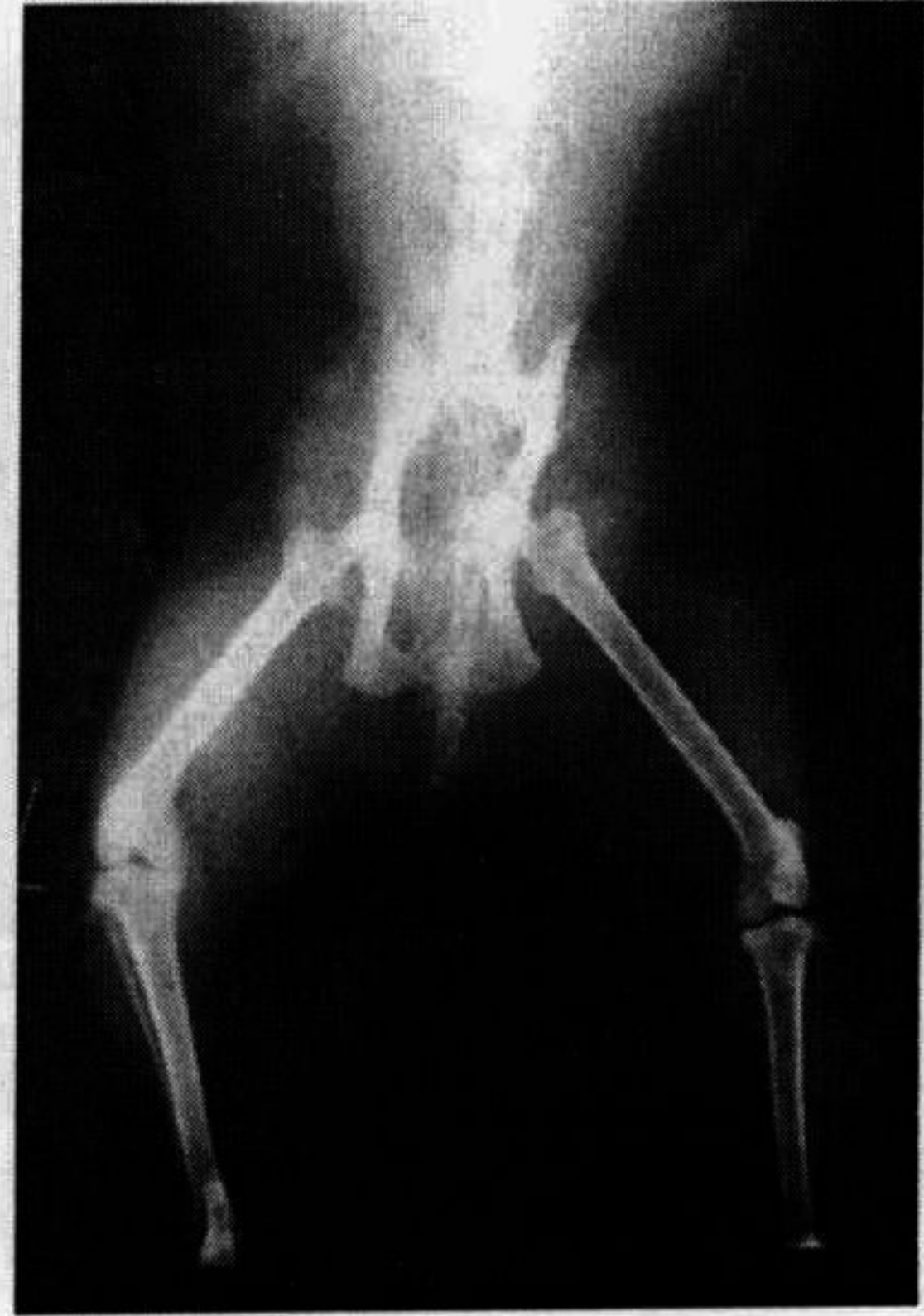
Şekil 1. Olgu no: 2'nin operasyon öncesi radyografik görünümü.

Olgulara ait bulgular Tablo 1' de ve radyolojik sonuçlar Şekil 1, 2, 3, 4' de sunulmuştur.