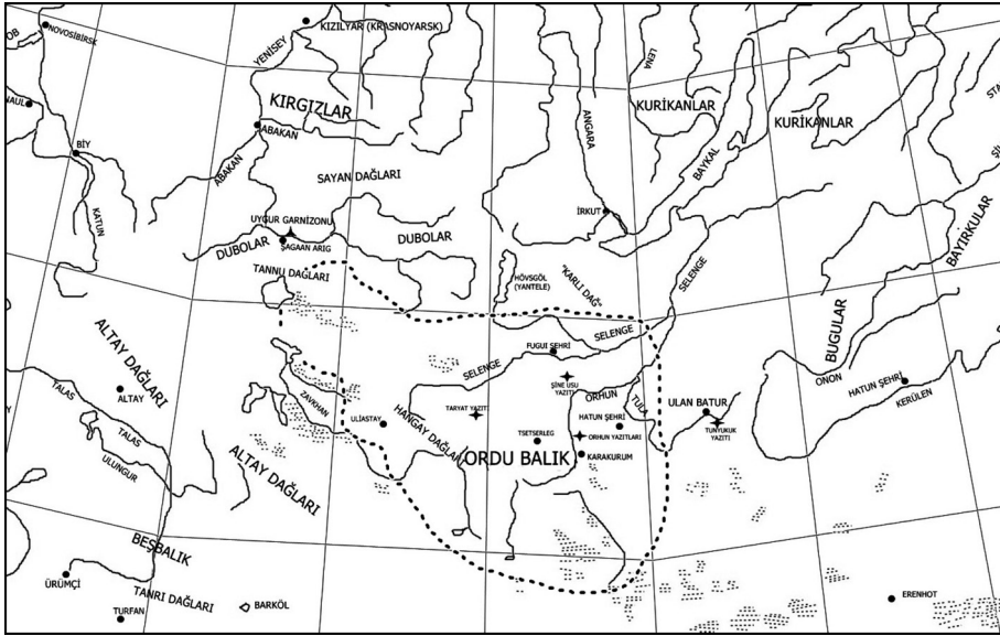
Harita-I: Taryat Yazıtı'na Göre Kağanlık Merkezi'nin Yaklaşık Sınırları

Yine Şine Us Yazıtı'nda kağanın yaylağı için şöyle denilmektedir: "... Tah-tımı Tes başı bölgesi ve Kasar'ın batısında kurdurdum. Çit(im)i, (orada) yapturdım. Yazın orada yayladım " (Doğu/8). 5 Burası Moğolistan'ın kuzeybatısında Tannu-Ola'nın güneyindeki Ubsa Gölü'ne dökülen Tes Irmağı kıyılarıdır. 6