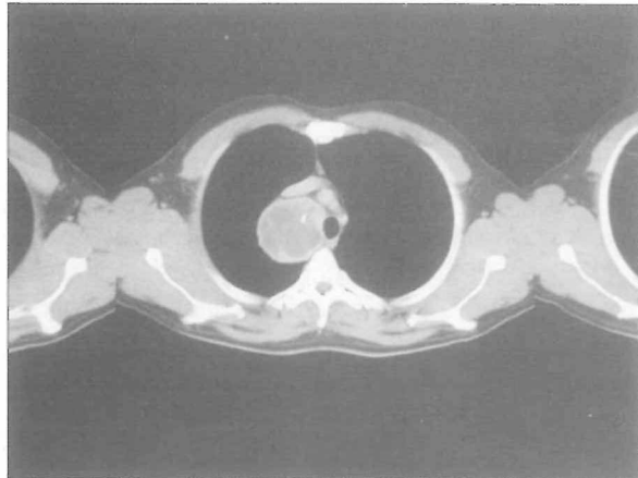
Resim 2. Retrosternal bölgeye yerleşimli guatr olgusunun bilgisayarlı tomografi görüntüsü.