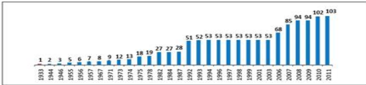
Şekil 1. Türkiye'de yıllara göre devlet üniversitelerinin sayısı (1933-2011)

Ülkemizde, özellikle son yıllarda üniversite sayısı oldukça artmıştır. Şekil 1'de görüldüğü gibi 1933 yılında Türkiye'de sadece tek bir devlet üniversitesi varken, 2011 yılında bu sayı 103'e yükselmiştir. Tablo 1'de görüldüğü üzere 2016 yılında ise 112'ye ulaşmıştır.