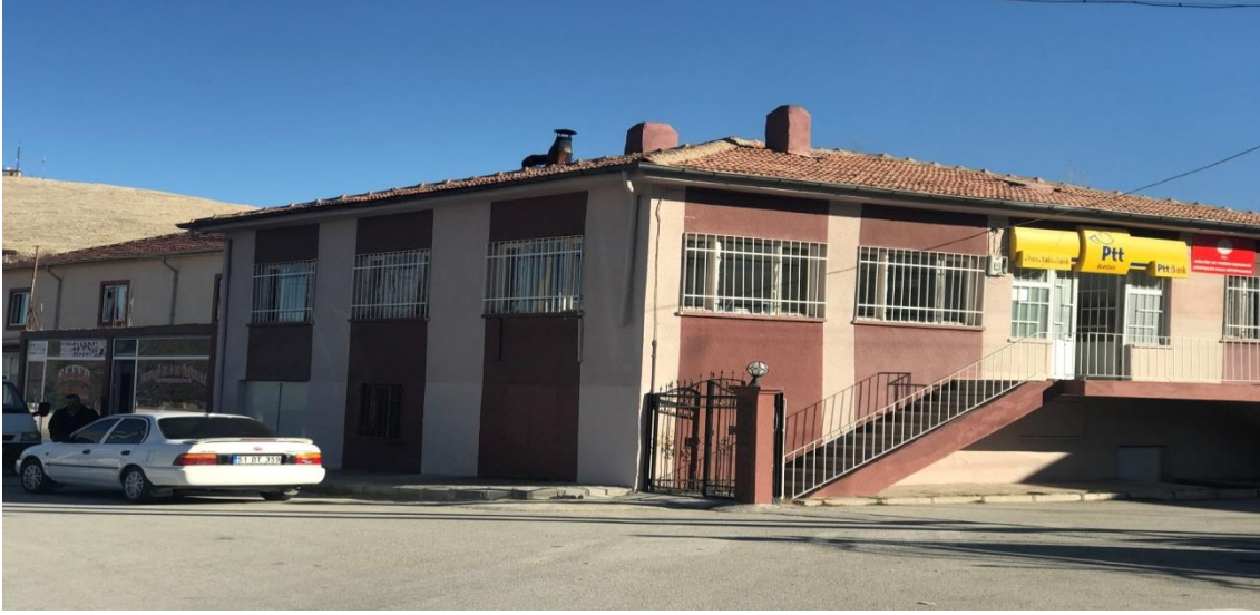
Resim 6: Haberleşmeyi sağlayan PTT binası

Eskiden bir ilan verileceği zaman, genellikle bu ilan düğün ilanı olmakla birlikte, düğün sahibinin bir yakını yüksek bir yere çıkıp “Duyduk duymadık demeyin” diyerek düğün olduğunu ilan etmişti. Günümüzde ise ilanlar cami apolyonlarından (hoparlöründen) verilmektedir.