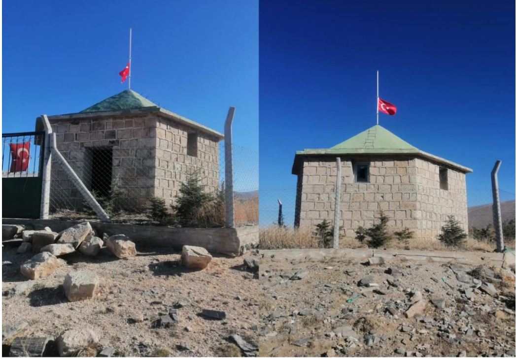
Resim 23: Önemli ziyaret yerlerinden Evliya Türbesi

Kasabada bayram günleri , kasabamızda adeta bir şölen havasında geçen bayram merasimini unutmamak lazım. Bayram günleri, yaşlısından gencine hatta en önemlisi çocukların adeta can siper hane, dört gözle beklediği önemli günlerin başında gelmektedir. Evde bayram temizlikleri, dışarda bayram alışverişleri, özellikle çocukların yeni kıyafet ve oyuncak alımında hane halkının ekonomik durumuna bakılmaksızın isteklerini azami ölçüde ihtiyaçlarının karşılandığı, adeta mutluluğun resminin çekildiği günlerdir.