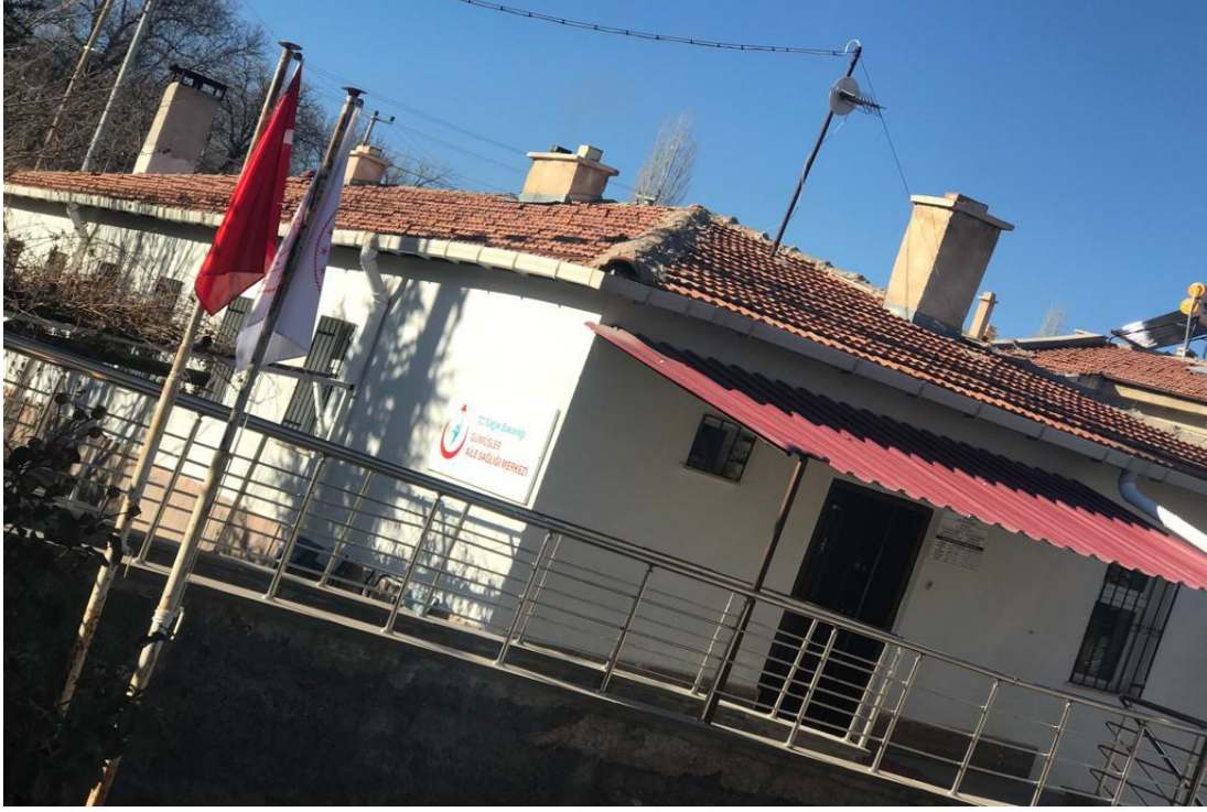
Resim 18: Önemli tedavi merkezi, Sağlık Ocağı

tedavi ederlerdi. Günümüzde bu tedavi şekilleri azalsa da kısmen kabul görmektedir. Modern dönemde ise her türlü tedavi hizmetleri köyde önceleri sağlık evi ve sağlık ocağında, burada tedaviye cevap alınmazsa il merkezi, devlet hastanesinde; ileri derecede hastalıklar içinde tıp fakültelerinde yapılmaktadır.