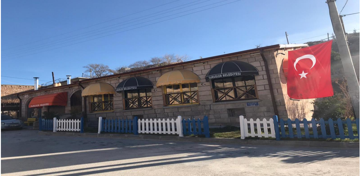
Resim 10: Son dönem sosyal donatı (Belediye Kafeteryası)

Günümüzde manastırın karşısına belediye tarafından kafe açılması, sosyal hayatı kısmen de olsa değiştirdiğini, insanların oraya gelip gittiğini orada oturduğunu ve böylece manastırda hemhal olmasını sağladığını, gelen insanların da sadece Manastırı ziyaret edip giden değil, orada oturup kasabanın ticaret hayatına katkı sunacağını bir takım şeyler olduğunu, bu noktada özellikle kasabanın çehresinin değiştiği, ticaret hayatının yanında sosyal ve kültürel hayatının da zenginleştiği görülmektedir.