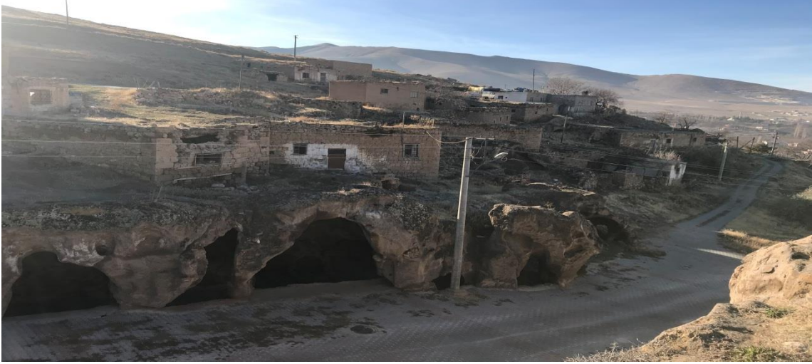
Resim 2: Köyün en eski yerleşim yeri, Takka'dan görünüm.

Daha sonra Gümüşler de zaman içerisinde yavaş yavaş aşağı doğru köyün şimdiki meydanı dediğimiz Köprübaşı, Kızıldam'a ve Değirmenardı ve dahi ardından da Çayın Önü dediğimiz Avlanlı sokağa yerleşimler olmuştur. Avlanlı Sokağa, Akdoğanlar Niğde'den gelip yerleşmişlerdir. Böylelikle gümüşler genişlemeye ve çoğalmaya başlamıştır. İnsanlar ekmeye, dikmeye, yaylaya çıkıp hayvancılık yapmaya başlamıştır. Ve burası belli bir süre sonra köy vaziyetini almıştır.