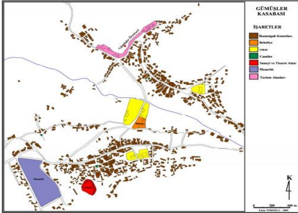
Resim 14: Gümüşler Kasabası ve fonksiyon alanları

hayvancılık faaliyetlerinin yerleşmenin strüktürü üzerindeki etkisi açık olarak izlenebilmektedir. Vadi içi ve yamaçlarında yer aldığından meskenlerin büyük kısmı bir ve iki katlıdır. Sahip olduğu 873 binanın %42'si tek katlı, %56'sı 2 katlı, %2'si 3 ve 4 katlı binalardan oluşur. Geleneksel meskenlerde nerdeyse bütünüyle taş malzeme kullanılmış olup, bütünüyle toprak düz damlıdır. Bina sayımı verilerine göre binaların %67'si doğal taş malzeme ile inşa edilmiştir. Geri kalanlarda ise briket ve tuğla kullanılmıştır. Kasaba kolay işlenebilir tüflerin oluşturduğu büyük taş ocaklarına sahiptir. Meskenlerde ihtiyaca göre zamanla inşa edilmiş eklentilere rastlanır. Hayvancı ailelerin meskenleri ahır, samanlık ve avlu gibi eklentilere sahip iken, meyveci ailelerin ambarları evlerde eklenti olarak görülür. 368 Mevcut durumuna göre yerleşme iki parçalı bir görünüm arz etmekte olup, meskenler genellikle toplu haldedir. Yerleşmedeki yeni gelişim alanları daha ziyade yerleşmenin eski nüveleri arasındaki boşluk alanları ile Niğde-Kayseri yolu arasındaki uygun sahalardır. (Toroğlu, 2006, s.367)