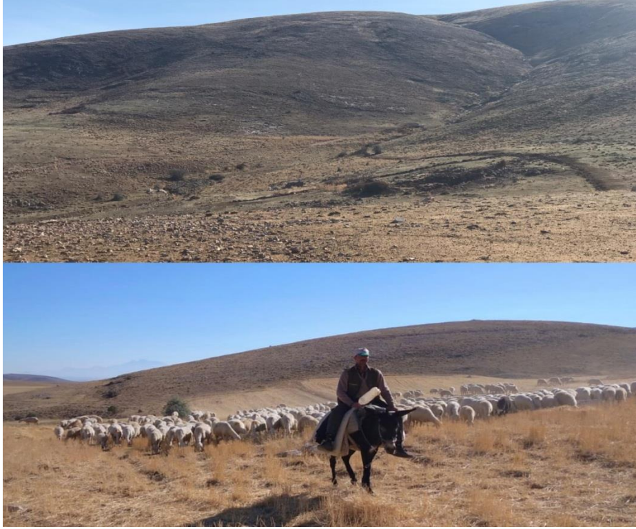
Resim 8: Yaylalar ve yaylacılık

Bağ, bahçe işlerinin hayvancılığın yanında gelişmesiyle birlikte ilk elma fidesinin Niğde'den getirilerek dikildiği rivayet edilmektedir ve bu fidenin gelmesiyle beraber süreç içerisinde elma fidanları dikilip çoğaltılmış, bu çoğaltılmanın sonucunda ortaya çıkan ürünün köyde yaşayanlar tarafından kabulünün yüksek olması, köylünün elmacılığa dönmesi yönünde bir dönüşümü sağlamıştır. Bazıları bunun üzerinden hem Niğde'de hem de başka şehirlerde yatırımlar yapmıştır. Yatırım yapan aileler güçlenmiş zengin olmuşlardır. Bu ailelerden bazıları, Akdoğanlar, Çaymazlar'dır. Bunlar daha fazla meyve satan daha fazla güçlü olan, o dönemde Niğde'ye yatırım yapan zenginlerdir.