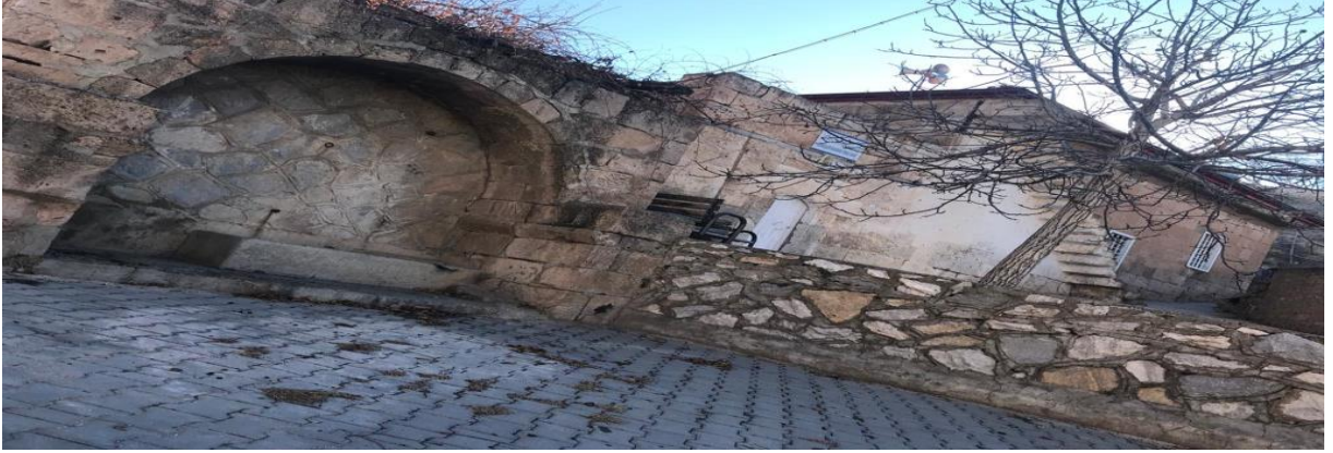
Resim 3: Takka Camii' den Görünüm

Dedelerimizin bir bölümü Gıldırabalı dediğimiz Takka bölgesinden, diğer bölümü de maden macerasından başlayarak bu zamanlara gelmişlerdir.