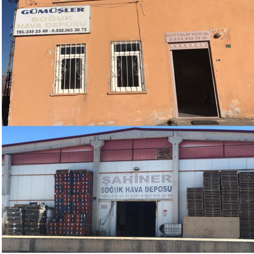
Resim 9: Soğuk Hava Depoları

Eskiden başta elma olmak üzere, meyveler evlerin bodrum katlarında ya da özel yapılmış ambarlar ya da kilerlerde saklanırken, günümüzde soğuk hava depoları şeklinde muhafaza edilme ve kullanma yoluna gidilmektedir.