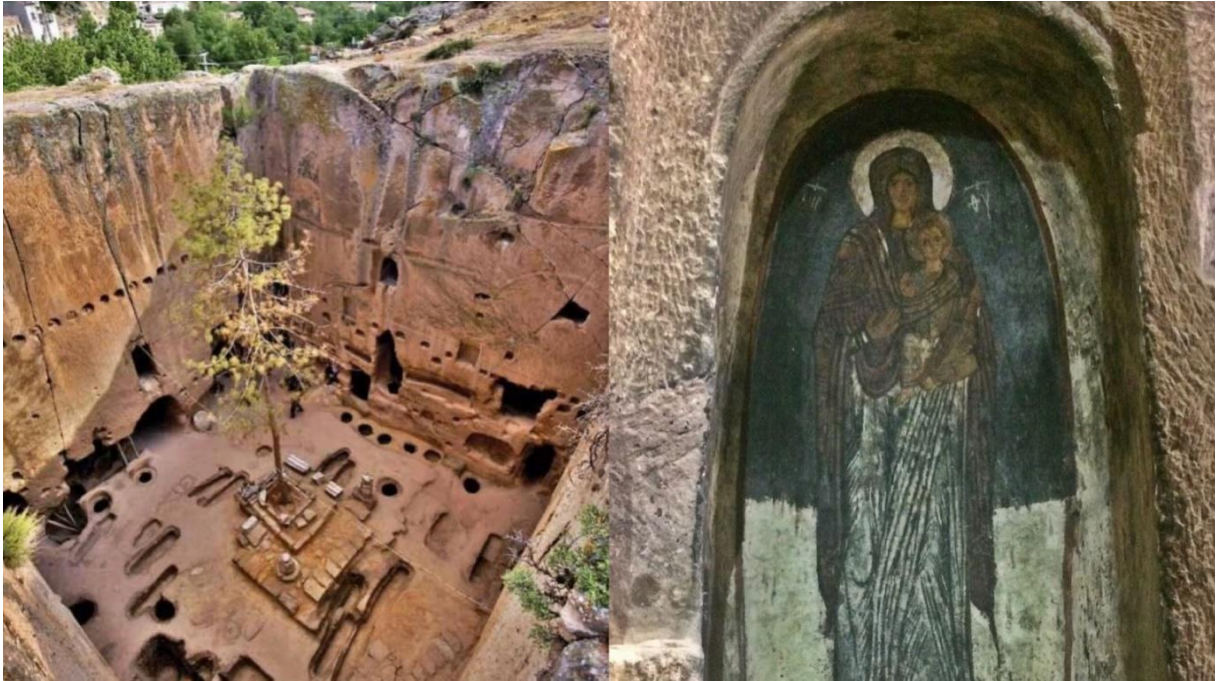
Resim 16: Manastır'dan iç kesitler

Kuzey haç kolundaki Meryem'e Müjde, İsa'nın doğumu ve Tapınağa Takdimi sahneleri ile Vaftizci Yahya ve Aziz Stephanos figürleri ikinci bir sanatçının elinden çıkmış olmalıdır. İç narteksten naosa giriş kapısının güneyindeki Meryem ve çocuk İsa ile iki yanlarındaki baş melekler Gabriel ve Mikael figürleri üçüncü sanatçıya aittir. Narteksin üstündeki bir odanın duvarlarında Kapadokya'da örneği görülmeyen, av sahneleri, çeşitli hayvanlardan oluşan bir kompozisyon dikkat çekmektedir. Kapadokya'daki pek çok kilisede olduğu gibi, Gümüşler Manastırında da duvar resimlerinin ikonografik ve üslup özelliklerine göre yapılabilmektedir. Kilisedeki resimlerin bu özellikleri ve karşılaştırmalı değerlendirmeler yöntemi ile 11./12. yy.'lara tarihlendirmek mümkündür.