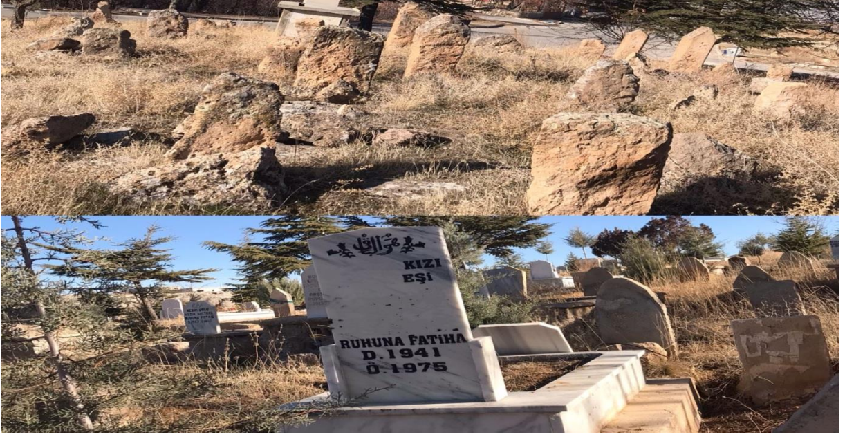
Resim 21: Eski ve yeni mezarlıklardan görünüm

Kasabada yağmur duası; uzun süre kuraklık yaşanır ve bu kuraklık ürünlerin yetişmesine, hayvanların beslenmesine ve insanların ihtiyaçlarını karşılamada çok ciddi sorunlar yaratacağı emaresi üzerinden dua hazırlıkları yapılır ve duaya çıkılırdı. Hocayla birlikte duaya çıkılırken köy ahali toplanırdı. Kuraklık tersine dönsün, yağmur yağsın diye hoca cübbesini ters giyerdi. 2 rekât şükür namazı kılınır, gelen kişiler helalleşir, küsler barışırdı. Hoca yağmur duası, ayeti okurdu. Bir ayet geçerken bulunan durum tersine dönsün diye dua için açılan eller ters çevrilirdi. Hocayla birlikte gelen halk dua edip âmin derlerdi. Eğer Allah kabul ederse yağmur yağardı.