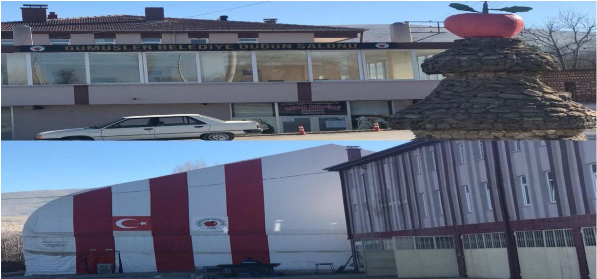
Resim 12: Sosyal Donatılar (Düğün ve Spor Salonu)