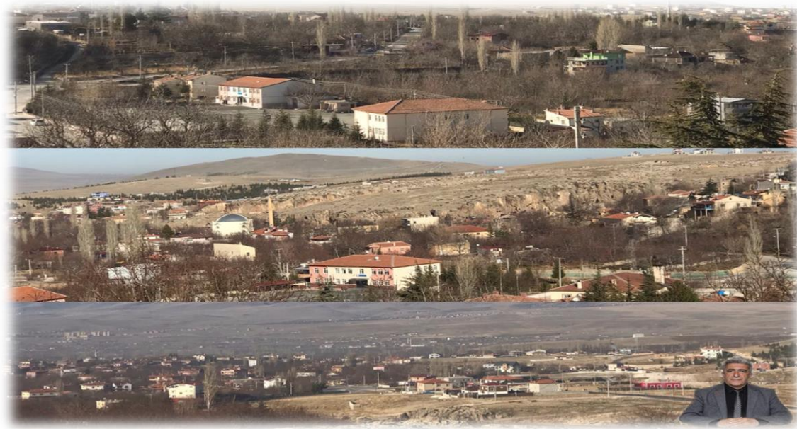
Resim 1: Gümüşler Beldesinin Genel Görünümü

(Yattığı ahır sekisi, çağırdığı İstanbul türküsü)