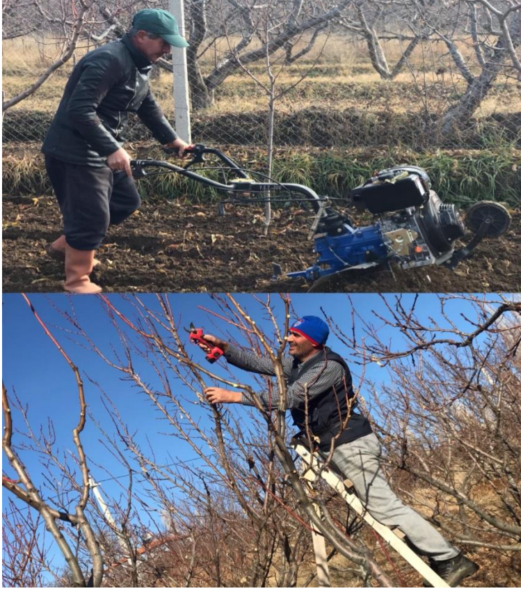
Resim 25: Mevsimlik bağ ve bahçe işleri

Yayla da kadınlar günlük çamaşır, bulaşık yıkar, sökülen kıyafetleri diker, yemek yapardı.