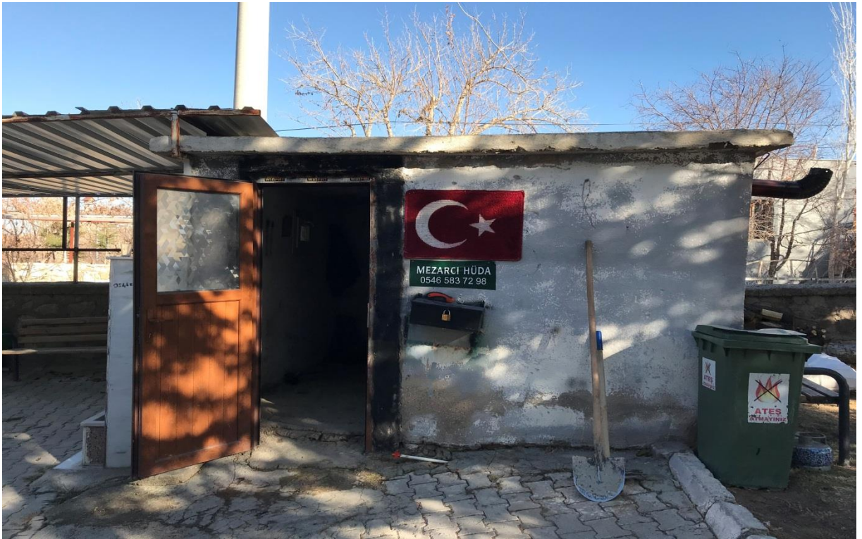
Resim 20: Gümüşler 'de mezar işleri yapımı

Günümüzde ise cenaze arabayla götürülüyor. Eskiden ölen kişi gece ölmüşse ya da gömülmeye müsait hava koşulları vs. olumsuzluk varsa bir odada bekletilirdi ve ölen kişinin üzerine demir parçası (bıçak vs.) konulurdu. Şimdi ise ölüler morgda bekletiliyor, morgdan camiye getiriliyor, camiden kaldırılıyor. Sadece helallik almak için son ziyaret olarak evin önüne getirilir, ev halkından ve yakın komşularından helallik alınır. Mezarlar ise hazır tuğlayla yapılıyor, üstüne de betondan kapak dökülüp üstüne diziliyor. Ölünün başucuna ve ayakucuna da mermer taşları dikiliyor. Hazır mezar kalıpları Mermerlerde ölünün ismi, doğum ve ölüm tarihi yer alıyor. Kadınlar ise cenaze evine yemek götürmüyor, sadece baş sağlığı dileyip oradan ayrılıyorlar. Bir hafta ya da on beş gün içerisinde ölünün yakınları tarafından mevlit okutuluyor. Mevlitte de gelen misafirlere genellikle lahmacun(hazır yaptırılıyor), ayrılan dağıtılıyor.