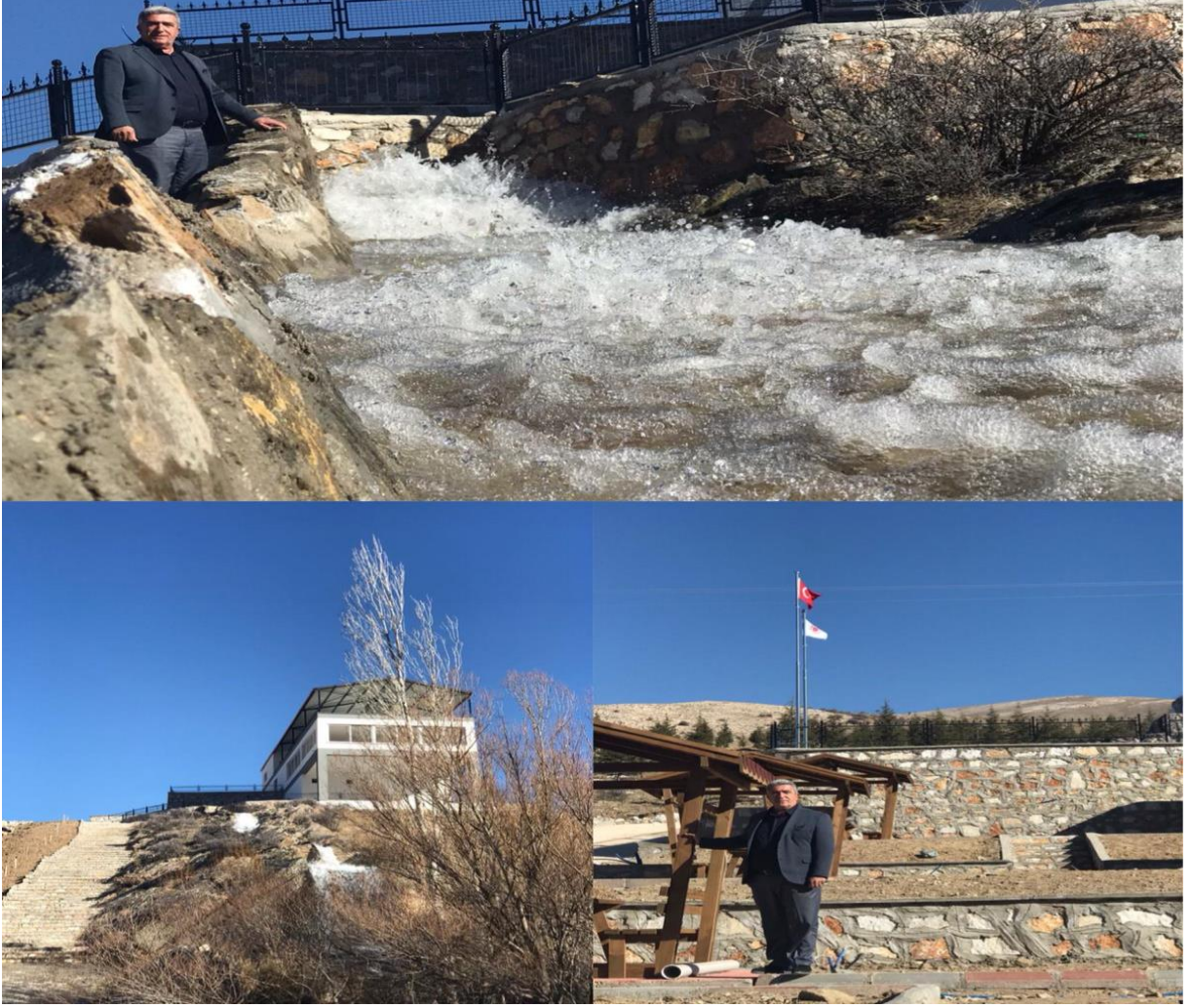
Resim 13: Başkan ve Balık Tesisleri

Gümüşleri bir destinasyon olarak ele aldığımızda gelen insanların bu lokasyonda, bir gününü geçireceği, sosyal donatıları, gezinti mekanları oluşturamazsak insanların ekonomik olarak kasabaya katkısını sağlayamayız. Dolayısıyla Gümüşlerde yapılabilecek en önemli şey, Gümüşleri ziyaret eden, Manastır başta olmak üzere kasabaya gelenlerin bir gününü burada geçirebileceği donatılarda kafe, balık tesisi başta olmak üzere diğer sosyal donatılar ekonomik hayatta önemli olacaktır. Gümüşler bağlık, bahçelik, yaylalık olan, otantik endemik yerleri olan bir destinasyon olarak niteliklerini ön plana çıkarmalı ve ticari faaliyetin odak noktası olmalıdır. Örneğin, endemik olan ve kevencilik dediğimiz şeyin çok önemli bir destinasyon uğraşı olarak kevenciliğin nerelerde yapıldığı, günümüzde bu kevenlerin nasıl ürüne dönüştüğü ile ilgili bir gezi tur düzenlenebilmelidir.