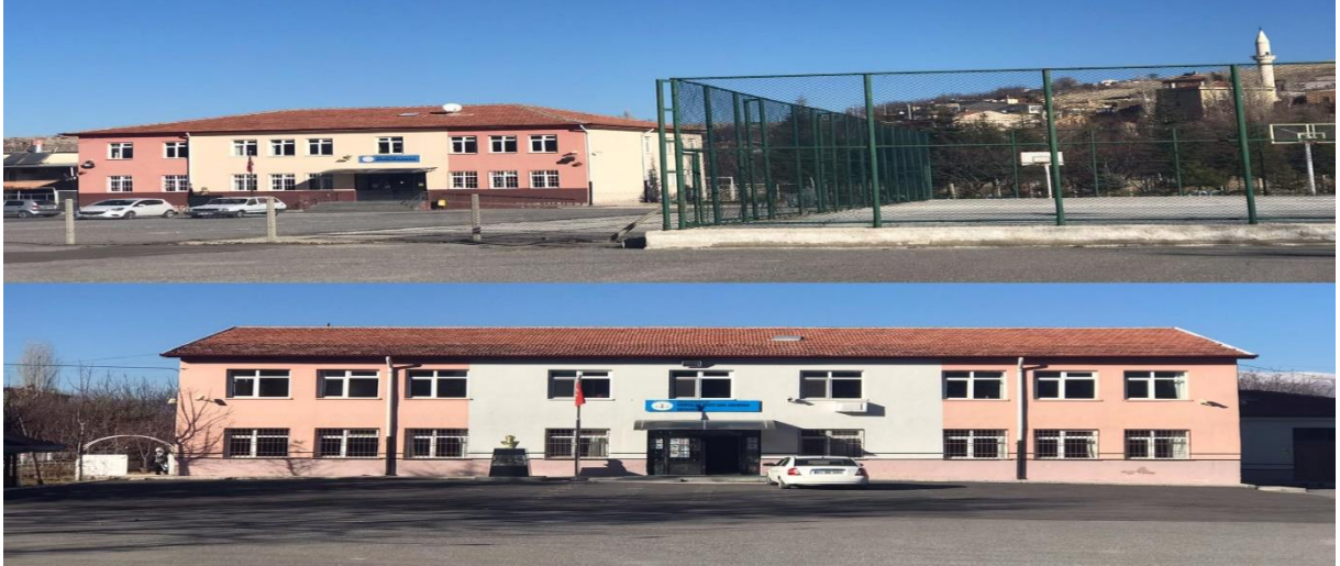
Resim 17: Gümüşler 'de Eğitim Hayatı

Okul, sadece eğitim faaliyeti değil, insanların şehirleşmesinin ve sosyalleşmesinin vazgeçilmez belirleyicisidir. Eğitim hayatı ortaokuldan sonra lise ve daha üst aşamaları Niğde il merkezi ve diğer kentlerde devam etmektedir.