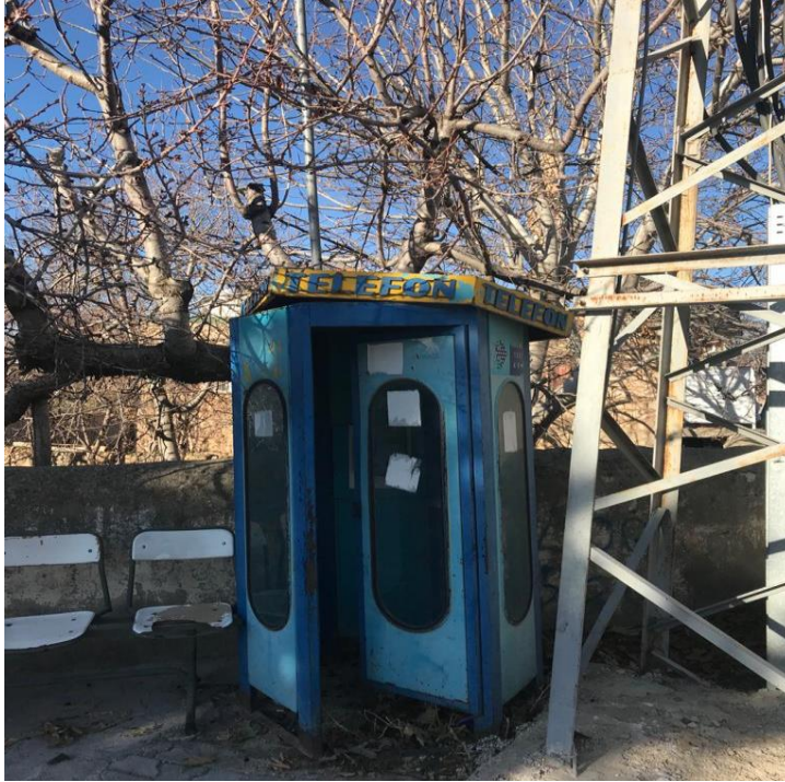
Resim 7: Haberleşmede geçmişin izi

Günümüzde çok kullanılmamasına rağmen kasabamızda hala varlığını sürdüren ankesörlü telefon ve kulübeleri mevcuttur. Makalede zamanının önemli haberleşme fonksiyonunu icra eden bu kulübelerden bir örnek teşkil etmesi hasebiyle resimleyerek burada yer vermenin yararlı olacağını düşündüm.