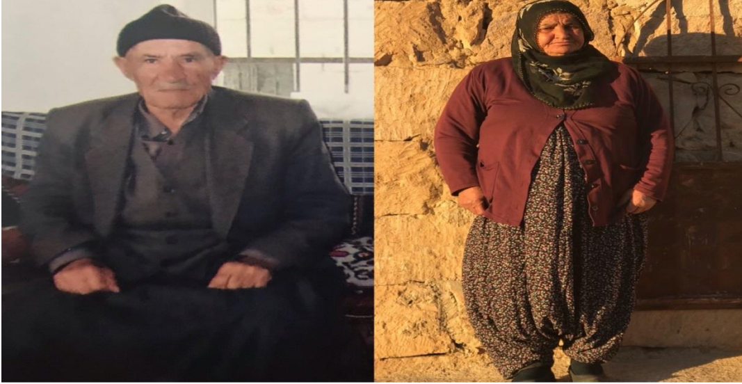
Resim 24: Kasabada geleneksel kıyafet

Giyim-kuşam; Kasabada insanların giyim, kuşamlarını yaptıkları işler belirlemektedir. Hayvancılıkla, bağ bahçeyle uğraşırken buna göre de günlük giyimleri vardı. Ya da eskiden şehirle bağ sınırlı olduğu ve sürekli çalışıldığı için giyim kuşam önemli değildi. Genelde rahat çalışılabilen elbiseler tercih edilirdi. Günümüzde ise artık okumaya, memur olmaya, işçi olmaya, çalışmaya, esnaf olmaya önem verilmekte, giyim kuşamda bu noktada değişmektedir. Buna bağlı olarak, takım elbise giyilmekte, kravat takılmakta, iskarpin giyilmektedir.