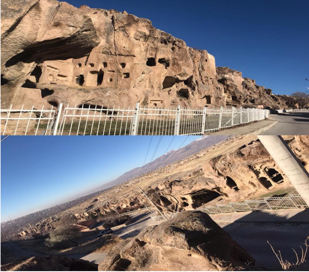
Resim 15: Gümüşlerin gözbebeği Manastır'dan genel görünüm

Gümüşler manastırı, ticarete en önemli gelir getiren tarihi bir unsurdur. Gümüşler kasabası Niğde merkezin 8 km uzağında bir yerdir. 1200 yılı aşmış yer altı şehri ile 1200 yılı aşmış geçmiş, yer altı şehri ile Gümüşler manastırı kendine has özellikleriyle ön plana çıkmaktadır. Gümüşler manastırı içerisinde birçok yaşanmışlığı ve gizemi taşıyan tarihi bir yerdir. MÖ. 7. ve 11. yy' ların da başlayan yerleşimler burayı bir kültür hazinesine dönüştürmüştür. Belki de Kapadokya bölgesinin yegâne eserlerinden bir tanesi Gümüşler Manastırı. 7. ve 8.yy'larda duvar resimleri yasak olduğundan duvar kabartmaları ile süslenmiş manastırın içindeki bazı duvarlar. Zamanın insanlarındaki ruh halini en iyi yansıtan kabartmalar oldukça ilgi çekicidir. Duvar süslemeleri yasak olduğundan bu süslemeler 10 ve 11. yy da başlamıştır. En meşhur ve dünyada bir ilk olduğu söylenen gülümseyen Meryem Ana freski burada bulunmaktadır. En üstte Hz. İsa sağında iki melek İncil yazarlarının sembolleriyle İsa ve Havarilerinin ve klise babalarının resmi yer almaktadır. En önemli resim ise gülen Meryem Ana resmi.