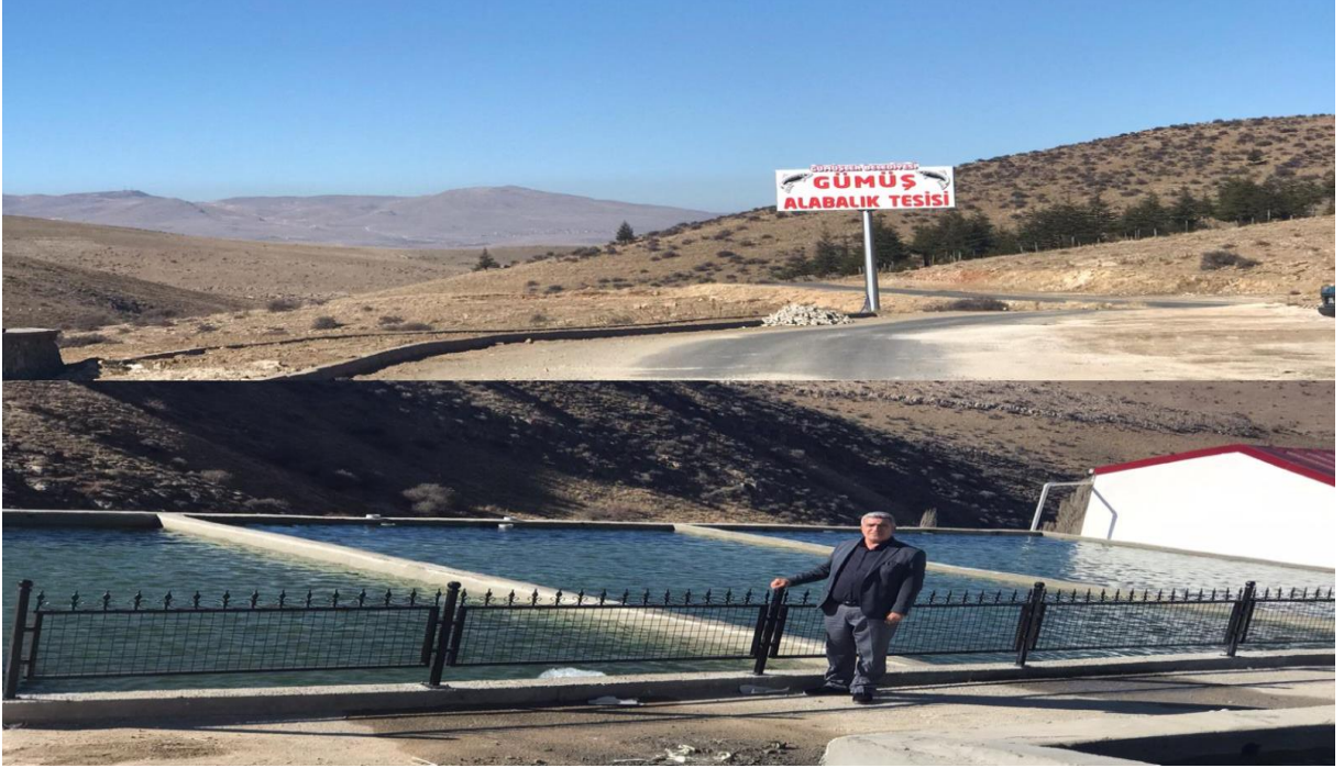
Resim 11: Başkan ve Balık Tesisleri

özellikle katkı sunacaktır. Bu tesisler tam kapasiteyle üretime geçtiğinde sadece Gümüşlere değil, Niğde kent merkezinde yaşayanlarında uğrak yeri olacaktır. Kasaba da yaşayan işsizlik sorununa da ciddi katkılar sunacaktır.