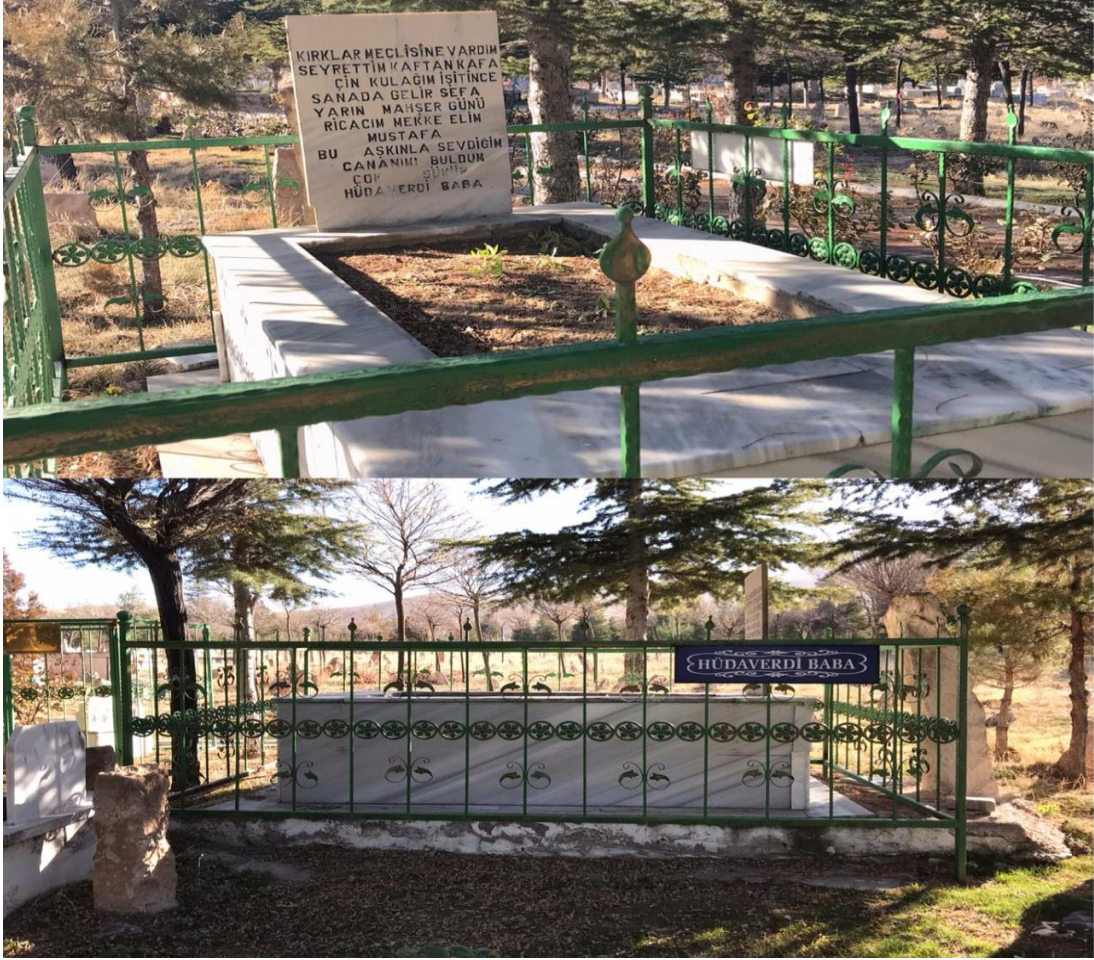
Resim 22: Hüdaverdi Baba'nın ebedi istirahatgahı