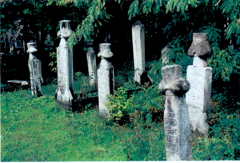
Resim 5 - Ortada Hacı Ali Paşa, yanlarında oğulları Selamet Beğ ve İslam Beğ'in kabir grubu.