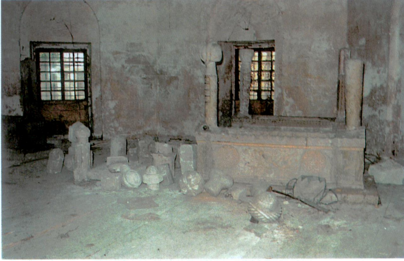
Resim 13 - Türbede Devlet Geray Sultan'ın mezarı. Hançer tasvirli, yıldızlı ve kırmızı boya izleri mevcut.