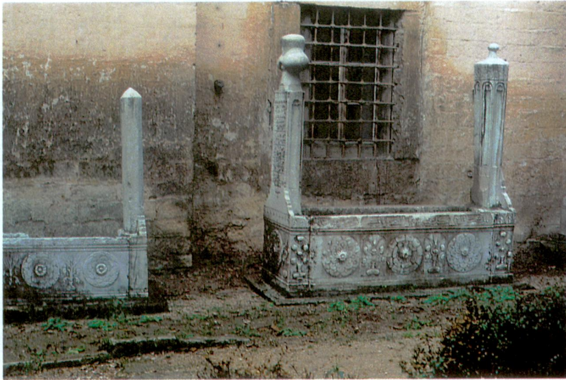
Resim 14 - II. Selim Geray Han'ın mezarı.