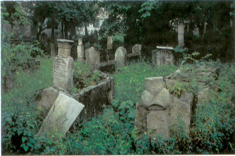
Resim 2 - Hazirenin ön kısmı. Sonradan getirilen taşlar düzeni değiştirmiştir.