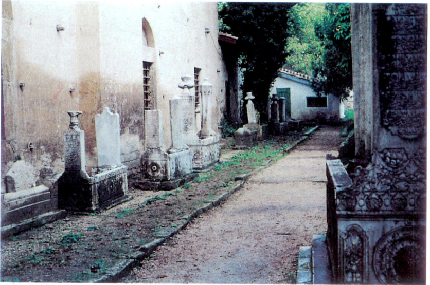
Resim 4 - Caminin kuble duvarının önünde sıralanan, II. Selim Geray Han'ın ailesine ait kabirler.