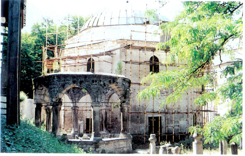
Resim 3 - Kubbe ile örtülü türbelerden birisi. Bu türbenin önünde II. Mengli Geray Han'a ait açık türbe bulunmaktadır.