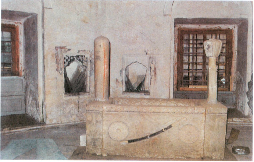
Resim 11 - Türbede Mengli Geray Sultan'a ait lahit -Kılıç siyaha boyanmış-.