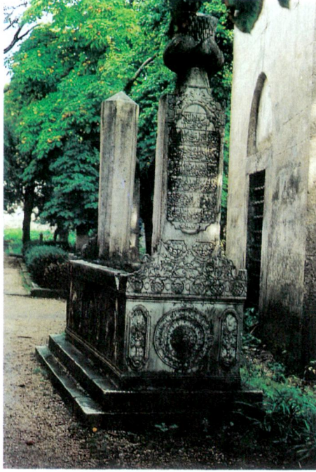
Resim 15 - Kırım Geray Han'ın kabri.