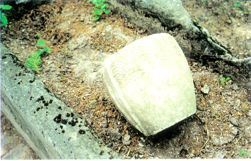
Resim 9 - Üç tane farklı sorgucu bulunan Selimi tipinde kırık bir başlık.