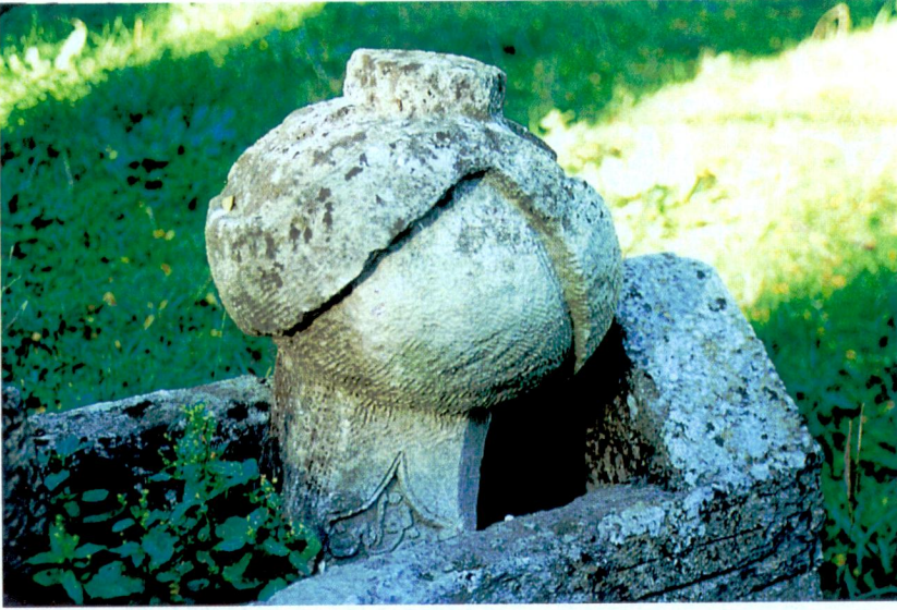
Resim 6 - Figüratif karakteri kuvvetli, tek şahideli büyük başlıklı bir taş.