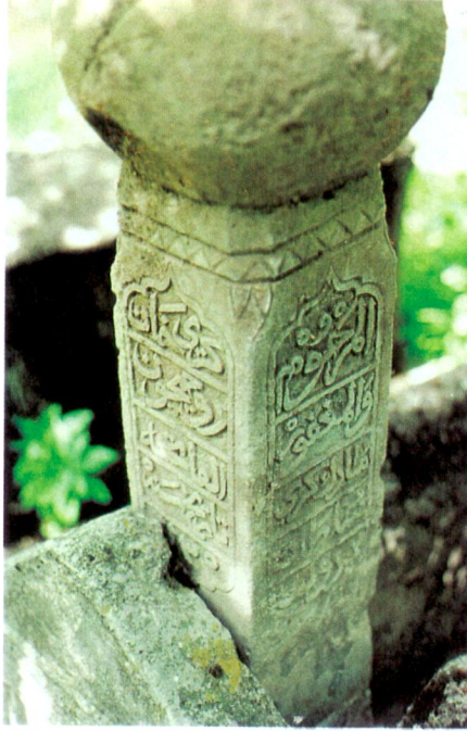
Resim 7 - Mübarek Geray Sultan'ın tek şahideli büyük başlıklı taşı.