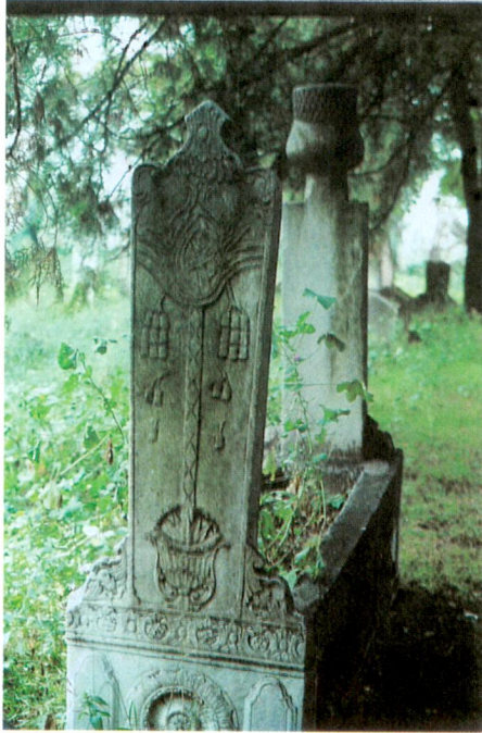
Resim 12 - Hurma ağacı tasviri gösteren muhteşem bir ayak şahide.