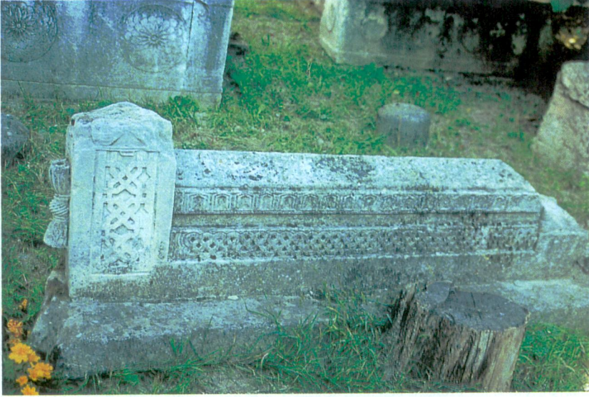
Resim 1 - Başka bir yerden getirilen ve Kırım Hanlığı öncesinden kalma bir kabir.