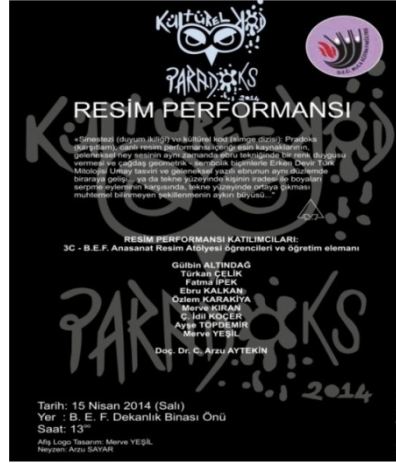
Şekil 6. Proje Afişi, Logosu ve Proje Tanıtım Yazısı.

“Sinestezi (duyum ikiliği) ve kültürel kod (simge dizisi): Paradoks (karşıtlam) canlı resim performansı içeriği esin kaynaklarının, geleneksel ney sesinin aynı zamanda ebru tekniğinde bir renk duygusu vermesi ve çağdaş geometrik- sembolik biçimlerle Erken Devir Türk Mitolojisi Umay tasviri ve geleneksel yazılı ebrunun aynı düzlemde bir araya gelişi...ya da tekne yüzeyinde kişinin iradesi ile boyaları serpmeye eyleminin karşısında, tekne yüzeyinde ortaya çıkması muhtemel bilinmeyen şekillenmenin aykırı büyüü...” (C.Arzu Aytekin, 2014)