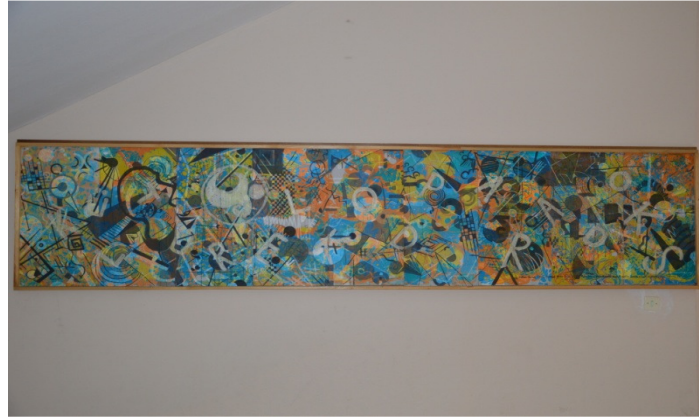
Şekil 15. Kültürel Kod:Paradoks Sanat Projesi Sonuç Ürünü- Buca Eğitim Fakültesi Cahit Arf Binası'nda Sürekli Sergilenen, 3 metre 60 cm Uzunluğundaki Proje Sonuç Eseri Görseli.

Proje sürecinde yapılan grup çalışmalarının, öğrencilerin görüşlerinden de anlaşılacağı gibi, onların hem disiplinli, hem de birbirlerine saygılı, yeni sanatsal deneyimlere açık vizyon sahibi bir sanatçı ya da sanat eğitimcisi adayı olmalarını sağlamada etkili olduğunu söyleyebiliriz.