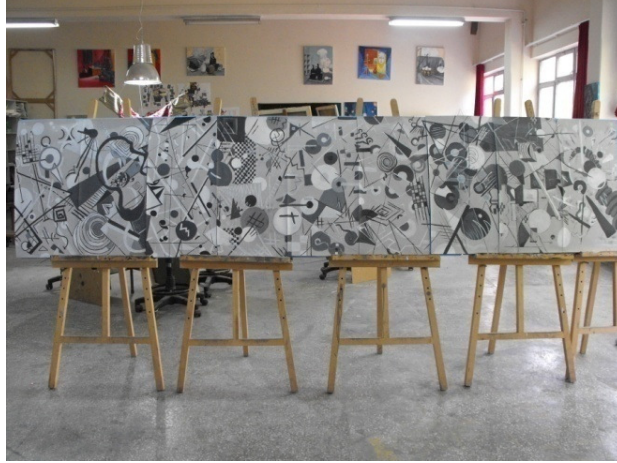
Şekil 3. Tuval Bezi Üzerine Akrilik Tekniğinde Birleştirilmiş Resim Tasarımları