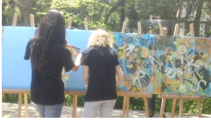
Şekil 13. Kültürel Kod:Paradoks Sanat Projesi Sonuç Ürünü Sunum Aşaması.