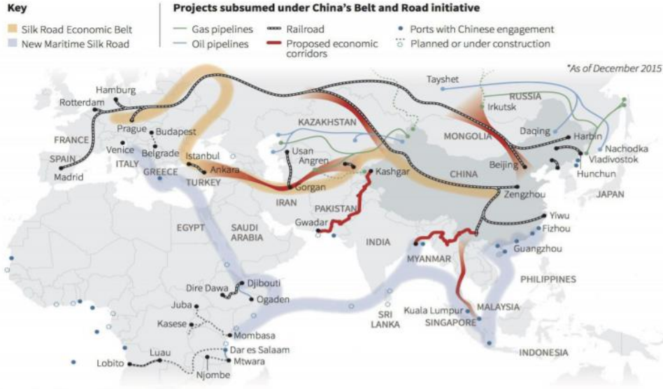
Resim 4. Kuşak ve yol girişimi