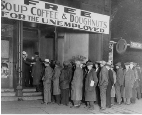
Resim 3. Great Depression ve New Deal perspektifi

olduğu söylenebilir. Belki de güçlü şekilde tanık olduğumuz “Digital new world order/Dijital yeni dünya düzeni”dir. Dönemin ABD Başkanı Franklin Roosevelt tarafından 1932’de büyük kriz içindeki ekonomiye yardımcı olmayı amaçlayan bir dizi eylem (dictionary.cambridge.org/) olarak tanımlanan New Deal/Yeni Anlaşma-Düzen ekonomik ve yönetsel etkilerinin kıtaları aşması bakımından 20. yüzyılın ilk büyük (Marshall yardımı, New Public Management vb. düşünüldüğünde tek değil) küreselleşme hamlesidir (Resim 3).