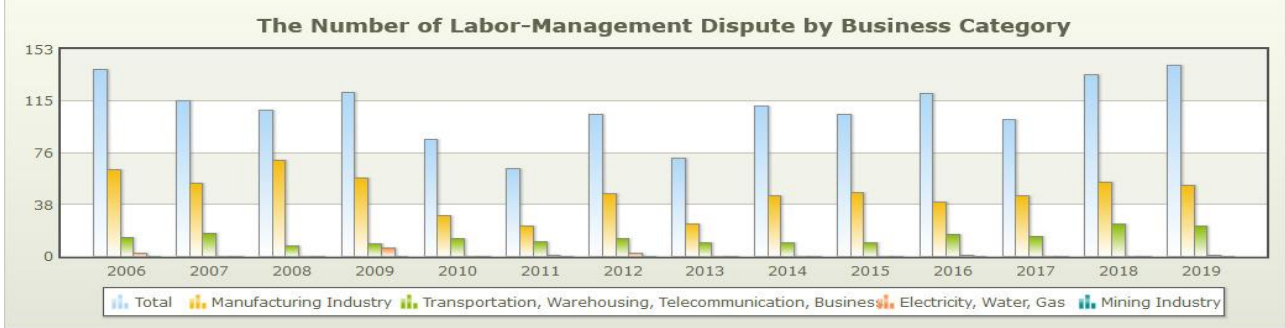
Şekil 2: Gruplaştırılmış İşkolları Düzeyinde İş Uyuşmazlıkları Bağlamında Grev Sayıları