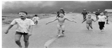
Şekil 52 “Napalm Girl” (Preston, 2007).

Vietnam Savaşı sırasında ABD, 12 Ocak 1962'de, Viet Kong'luların kullandıkları yol ve alanlarda ilerlemesini engellemek için modern teknolojik yöntemlerle “Ranch Hand” adı verilen bir operasyon başlattı. Bu operasyon kapsamında bölge halkı ve Viet Kong'luların gıdaya erişimini engellemek, yerini tespit etmek için bitki örtüsünü yok etmek amacıyla yaklaşık 19 milyon galon “agent orange” olarak bilinen herbisid (bitki öldürücü), 1962-1971 yılları arasında Vietnam'da kullanıldı. Muhafaza edildikleri galonların turuncu renkte olmasından dolayı bu ismi alan madde, ekolojik bölgeye geniş biçimde zarar verdiği gibi, kanser ve anomalili bebeklerin doğmasına da neden oldu (Vietnam War 1962 Operation Ranch Hand initiated, t.y.). Benzer biçimde ABD, sivil halkı doğrudan etkileyen bir başka silah olan napalm bombasını da Vietnam'da kullandı.