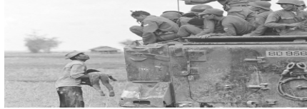
Şekil 48 Vietnamlı köylünün ölü çocuğuyla yardım isteği (Storm, 2014).

Horst Faas, 19 Mart 1964'de Kamboçya yakınlarında Vietnamlı bir köylünün, Güney Vietnam birliklerinden ölü çocuğunun bedenini yardım etmeleri için gösterirken çektiği fotoğrafla, 1965'de Pulitzer Ödülü aldı (Şekil 24).