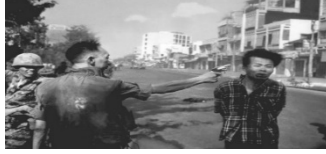
Şekil 51 Nguyen Van Lem'in vurulma anı.

Adams, Vietnam Savaşı'nda bir Viet Kong'lunun infazını gösteren fotoğrafı ile kamuoyunda büyük bir etki yarattı (Şekil 26-27). 31 Ocak 1968 Tet Bayramı'nda (Vietnam yeni yılı), Saygon'daki ABD elçiliğine Viet Kong tarafından saldırı düzenlendi. Amerikan ordusu bayram nedeniyle Vietnamlıların saldırıda olamayacakları yanılsaması içindeydi. 1 Şubat 1968'de Eddie Adams, Saygon sokaklarında Güney Vietnamlı General Nguyen Ngoc Loan'ın bir Viet Kong'luyu infazını fotoğrafladı 18 (Saigon Execution, t.y.). General Loan'ın infazı gerçekleştirdikten hemen sonra yürüyerek yoluna devam ettiğini anlatan Adams, generalin kendisine "onlar bizim çok sayıda insanımızı öldürdüler" ifadesini de olayın tanığı olarak anlattı. Amerika'da savaş karşıtı hareketin sembolü haline gelen bu fotoğraf, Vietnam'daki zalimliğin simgesi oldu (Bkz. Şekil 27) ve Adams'a mesleki şöhretini, 1969'da Pulitzer Ödülünü kazandı. Dünyada birçok basın kuruluşu tarafından birinci sayfadan verilen bu fotoğraf, Vietnam'da neler olduğuna dair ABD kamuoyunda da tartışmaların yapılmasına yol açtı.