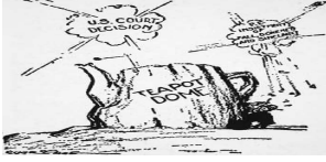
Şekil 26 Teapot Dome Skandalı. Mahkeme kararıyla ilgili karikatür (Granger Historical Picture Archive Teapot Dome, t.y.). (Photo, Print, Drawing Juggernaut, t.y.)