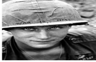
Şekil 49 "Savaş Cehennemdir" yazılı kaskıyla Amerikan askeri (The Vietnam War in pictures: the 35th anniversary of the fall of Saigon, t.y.)

Horst Faas, 19 Mart 1964'de Kamboçya yakınlarında Vietnamlı bir köylünün, Güney Vietnam birliklerinden ölü çocuğunun bedenini yardım etmeleri için gösterirken çektiği fotoğrafla, 1965'de Pulitzer Ödülü aldı (Şekil 24).