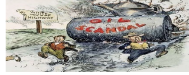
Şekil 27 Teapot Dome Skandalı'nda senatörleri hicveden karikatür (Granger Historical Picture Archive Teapot Dome, t.y.). (Photo, Print, Drawing Juggernaut, t.y.)

Çaydanlık şeklindeki Teapot Dome üzerinde mahkeme kararı ve karşısında Fall, Doheny ve Sinclair'in isimlerinin yer aldığı bir başka karikatür (Şekil 2), mahkemenin verdiği karar ve bundan etkilenenleri eleştirmektedir. Clifford K. Berryman tarafından çizilen ve Washington Star gazetesinde yayınlanan karikatür de ise (Şekil 3), 1924'deki başkanlık seçimleri sırasında Teapot Dome Skandalı ile ilgili politikacıların durumunu hicveder (Photo, Print, Drawing, t.y.).