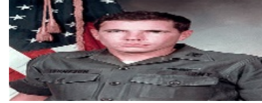
Şekil 33 Hugh Thompson My Lai'de bulunan pilot (Llewellyn, Southey , & Thompson, 2016)