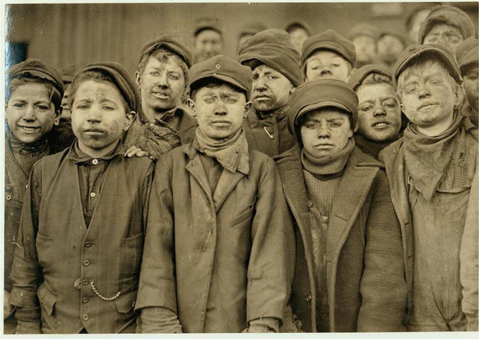
Görsel 3. Lewis Hine, The “breaker boys” at a Pennsylvania coal mine. Pittston, Pennsylvania, 1911.

Endüstri Devrimi'nin toplumsal açıdan olumsuz yansımalarına yönelik eleştiriler, sosyolojik araştırmalar kadar devrin edebî eserlerinin de yeni gündemini oluşturmuştur. 19. yüzyılda kendisi de çocukluk yıllarında işçi olarak çalışan İngiliz yazar Charles Dickens (1812-1870), eserlerinde endüstri kentlerinin karmaşasında ayakta kalmaya çalışan insanların mücadelesini işlemiştir. Bu metinlerde, küçük yaştaki çocukların emek sömürsünden, kırsal bölgelerden göç eden kitlelerin endüstrileşen kentlerin zorlu koşullarında verdikleri yaşam savaşına dek çeşitlenen temalar, Dickens öncülüğünde başlayan yeni bir tematik dünyanın yaratımına kapı aralamıştır.