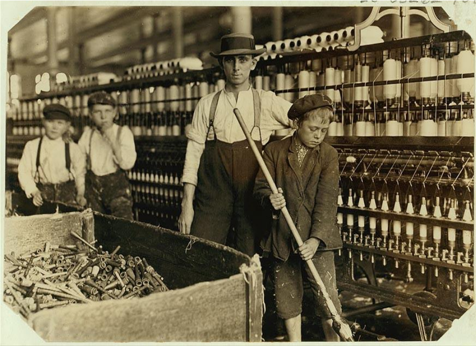
Görsel 2. Lewis Hine, Sweeper and doffer boys in Lancaster Cotton Mills. Lancaster, South Carolina, 1908.