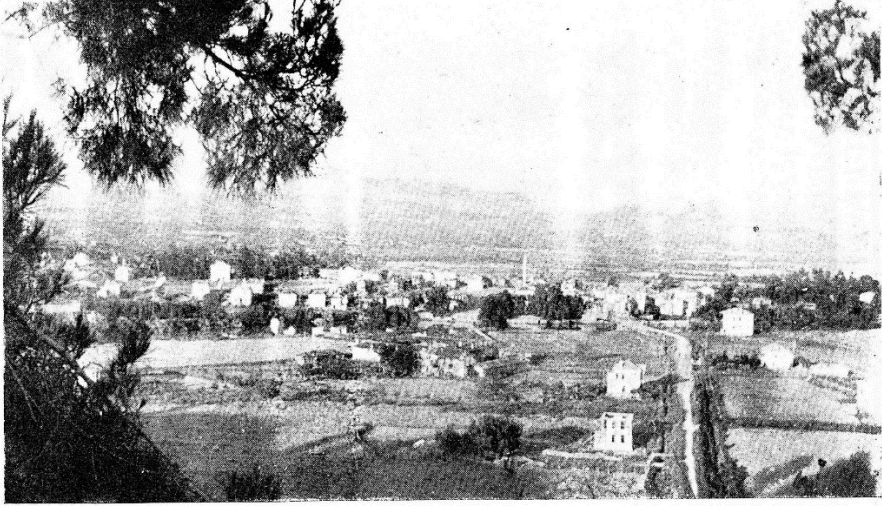
Resim 3: Cumhuriyet'in XV. Yılında Manavgat Kaza Merkezinin Görünüşü ( Türk Akdeniz , C. 2, S. 10, Ağustos 1938, s. 36)