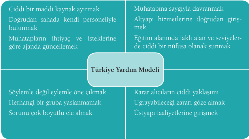
Şekil 2: Türkiye Yardım Modeli 53

Türkiye, acil insani yardımlarla kıtlığın ölümcül boyutunun etkisini azalttıktan sonra kalkınma yardımlarıyla ekonominin canlanmasına katkı sunmuş ve süreçte ulusal bir mutabakat tesis edip devleti kurumsallaştırarak istikrarlı bir Somali'ye ulaşmak amacıyla hareket etmiştir. Maksada ulaşabilmek için sadece kendi imkânlarının yeterli olmadığını bilen Türkiye