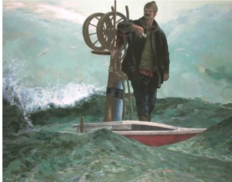
Resim 1. Koyununda mı Dalgaların II / Tuval üzerine yağlıboya / 160x205 cm / 2003