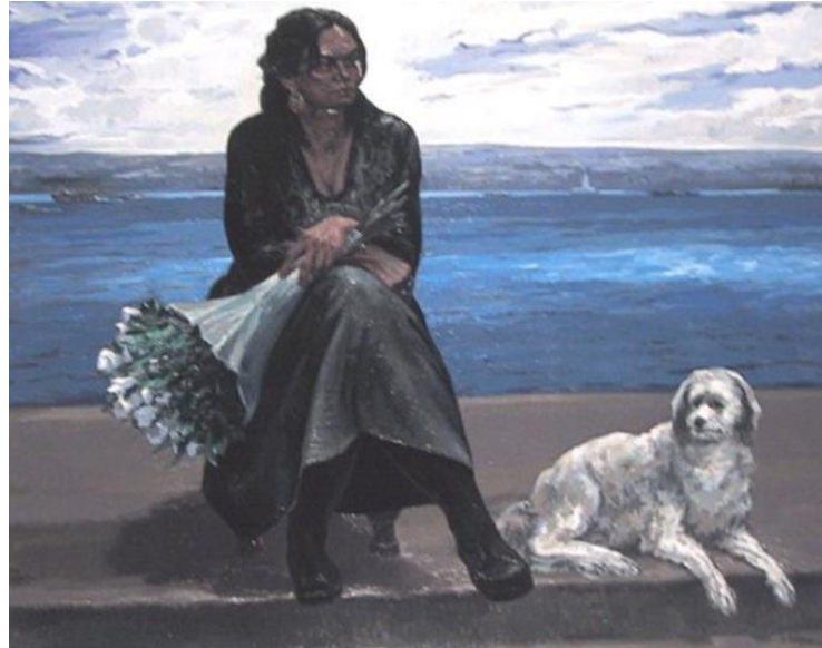
Resim-2 Beyaz Uğur / Tuval üzerine yağlıboya / 130x162 cm / 2002

Denizin dalgalı, havanın kapalı ve ortamında kasvetli olması ile insan hayatındaki karşılaşılan zorluklara bir gönderme söz konusudur. Genel anlamıyla insanların yaşamları boyunca pek çok zorluklarla karşılaşacağını bu zorluklar okyanus kadar büyük olsa da insanın kendi azmiyle üstesinden geleceğini dalgalara karşı dik ve çok rahat bir şekilde ayakta durabileceğini göstermektedir. Elinde sigarasıyla adeta poz veriyormuşçasına duran bu adam ile bu mesaj bize verilmek istenmiştir. Resimde yer alan kuşlar, bu zorlukların sonunda özgürlüğe kavuşacak olan insan temsil edilmiştir ( Resim 1 ).