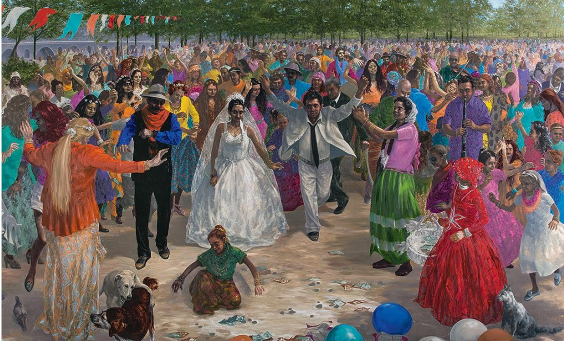
Resim-5 Roman Düğünü / Tuval üzerine yağlıboya / 220x370 cm / 2016

Eserin Yorumu: Resim 1 de yer alan eser ile yukarıdaki eser konu bakımından hemen hemen aynı olup ortak nesne kullanımı dikkat çekmektedir. İki resimde de kıyafetlerinden anlaşılacağı üzere yaşlı bir balıkçı, hayatının belli bir dönemini geçirmiş olduğu dalgalı bir denizde, sallantılarla (aslında hayatımızdaki mücadeleler) uğraşmaktadır. Sırtını karanlık bir yöne doğru çeviren bu insanın belki de hayata küsmüş olduğunu arkasındaki beyaz bulutlar ile kuşların yer aldığı uzak yerlerden (gelecek) ve aydınlıklar dan uzaklaşmasından anlayabiliriz. Resimde yer alan koyu renklerde bu düşünceyi pekiştirmektedir. Ressam kara bulutları, yaşlı adamın bulunduğu yerin üzerinde resmetmiştir. Kara bulutlar bir deyim olup, sıkıntı ve felaketlerle geçen, uğursuz kabul edilen kötü günler yaşamak anlamına gelir. Resimdeki yaşlı adamında kendi içinde manevi sıkıntıları olduğu söylenmişti buna nazaran üzerindeki kara bulutlarda bu varsayımı nitelemektedir. Bulutlarda ki siyah ve gri renk için şunlar söylenebilir, siyah özellikle ölümün ve matem rengidir, tarih boyunca ölüm korkusunu simgelemiştir ( Resim 4 ).