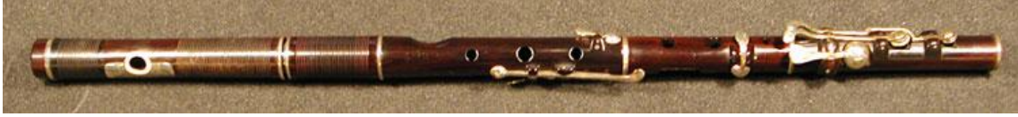
Görsel 2- Nickolson Flute (http-2)

Tıpkı Paul Taffanel'in Fransız flüt ekolünün mihenk taşı olarak kabul edilmesine eş olarak İngiliz ekolünün babası da flütçü ve besteci Charles Nickolson (1795-1837) sayılmaktadır. (Raposo, 2007, s. 11) Aynı zamanda ünlü bir flütçü ve flüt yapımcısının oğlu olan Nickolson, 20. Yüzyılın başlarında İngiltere'nin en meşhur flütçüsü olarak kabul edilmiştir. C. Nickolson Londra Flarmoni orkestrasında, İtalyan Operasında ve Drury Lane orkestrasında baş flütçü olarak görev yapmıştır. (Fitzgibbon, 1914, s. 208). Hatta güçlü tonu ve babasıyla geliştirdikleri flüt mekanizmasındaki yenilikler sayesinde modern flütün yapımcısı mucit Thebold Boehm'e ilham kaynağı olmuştur. (Raposo, 2007, s. 12)