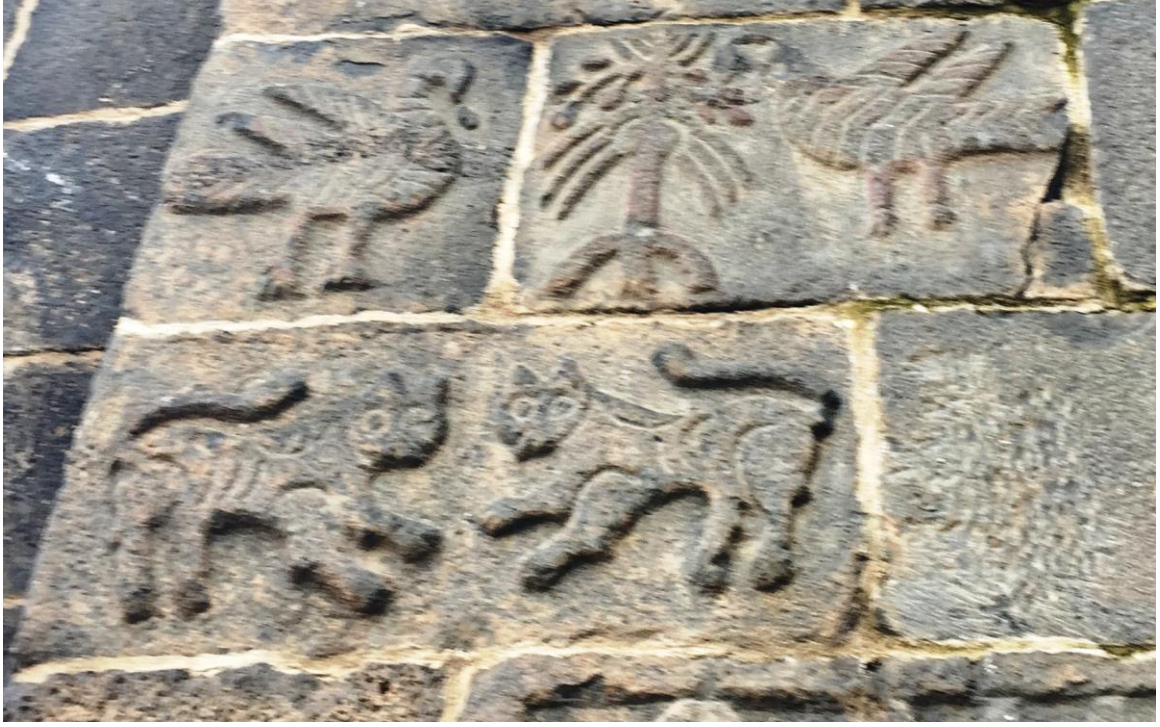
Fotoğraf 5: Diyarbakır Dağ Kapı Surları Doğu Burcunda Yer alan Hayat Ağacı Tasviri (Ebru ELPE)