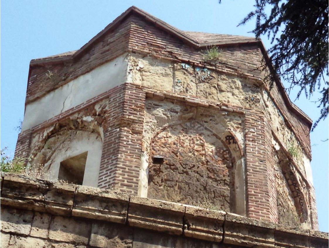
Fotoğraf 13 Amasya , Gök Medrese Camii, Sekiz Köşeli Yıldız Biçimli Kûlah. Ebru ELPE)