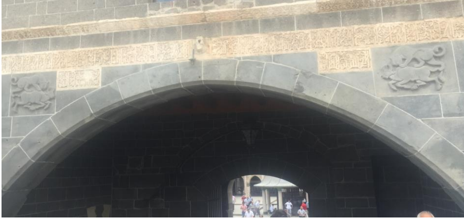
Fotoğraf 1: Diyarbakır Ulu Camii, Doğu Taç Kapısında Aslan- Boğa Mücadele Sahnesi ( Ebru ELPE)