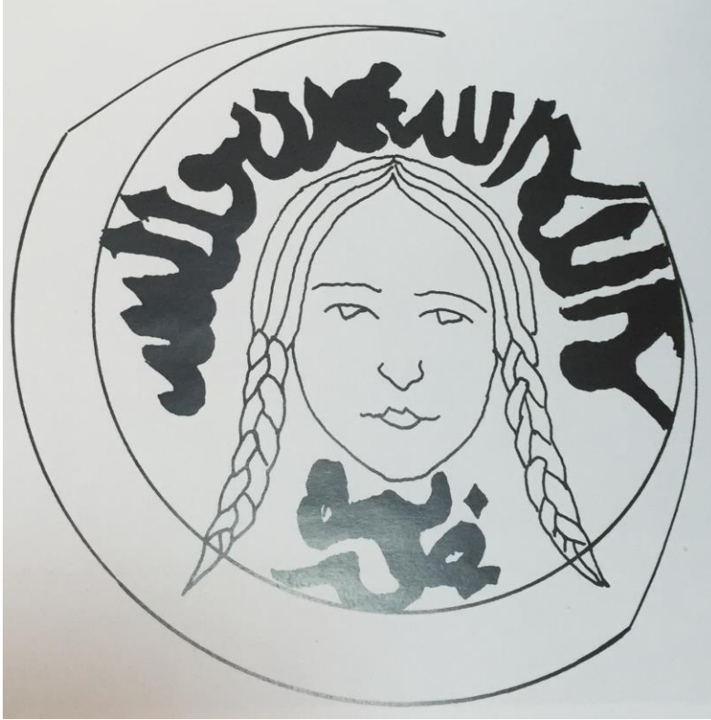
Çizim 1: Sivas Keykavus Şifahanesi, Ana Eyvan Batı Kemer Köşeliğinde Yer alan Hilal ve İçindeki Kadın Figürü ( Foto, Çaycı, 2002; 168 . Resim 11 b den alınmıştır.)