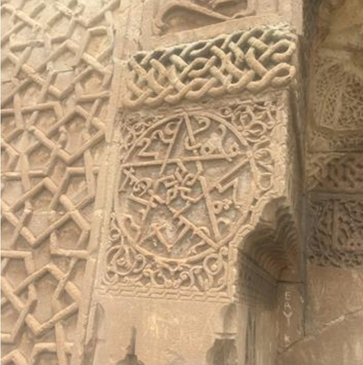
Fotoğraf 4: Erzincan, Tercan, Mama Hatun Türbesi, Kuşatma Duvarı Taç Kapısında Yıldız Motifi. Ebru ELPE)