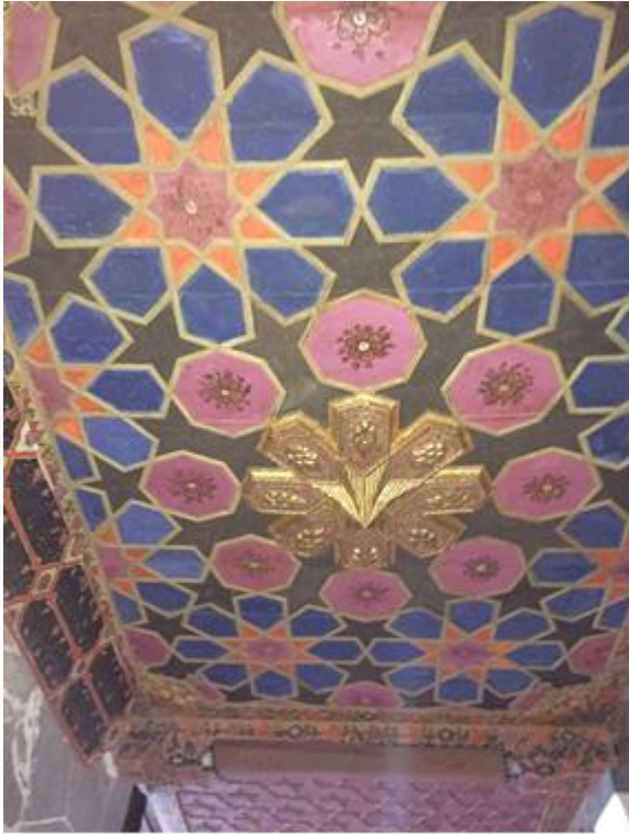
Fotoğraf .2: Diyarbakır Ulu Cami Üst Mahfil Altında Ahşap Üstü Kalem İşi Süslemelerde Yıldız Motifleri : Ebru ELPE)