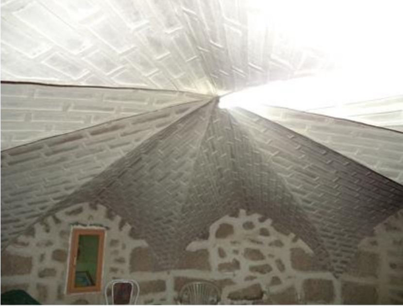
Fotoğraf12: Elazığ Harput Mansur Baba Türbesi, Kripta Kısmı Üst Örtüsü Yıldız Tonoz. (Ebru ELPE)