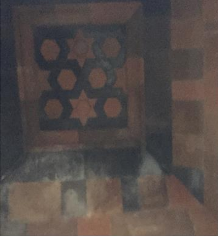
Resim 3: Kars, Ani, Menuşehri Camisi, Üst Kat Tonzunda Yıldızlı Süsleme. ( Ebru: ELPE)