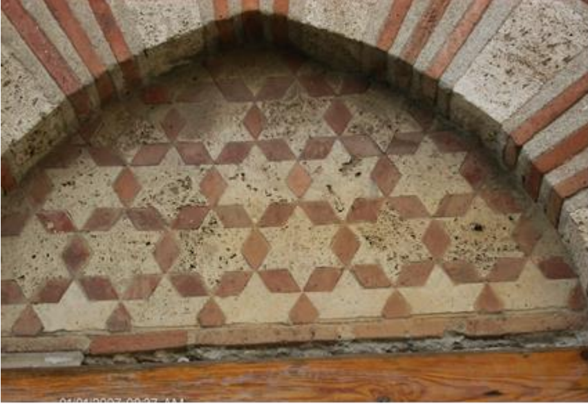
Fotoğraf10: Bursa Demirtaş Camisi, Yan Duvarda Pencere Kemer Alınlığında Taş ve Tuğlayla Yapılmış Süsleme Kompozisyonu