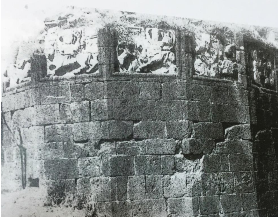
Fotoğraf 7: Cizre Köprüsünde Gezegen- Burç Figürleri