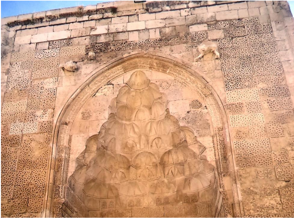
Fotoğraf 6: Sivas, İzzeddin Keykavus Şifahanesi, Taç Kapısında Figürlü Süsleme ( Ebru ELPE)