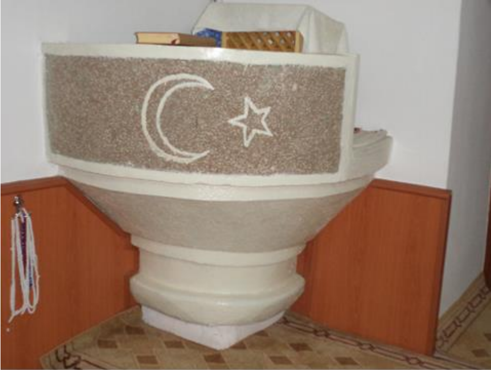
Fotoğraf 11 . Bursa , Karacabey, Kümbetli Camii, Va'z Kürsüsü Üzerindeki Ay-Yıldız motifi. ( Ebru ELPE)