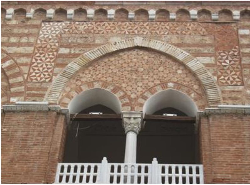
Fotoğraf 9: Bursa, I. Murad Hüdevendigâr Camii, Üst Kat Revak İkiz Kemerindeki Yıldız Biçimli Süsleme Ebru ELPE)