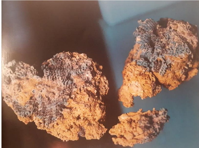
Resim 4. Asur ticaret dönemine ait kutanum/keten parçası, Ankara Anadolu Medeniyetler Müzesi (İnalçık, 2008)

Asur ticareti kanalıyla Anadolu'ya 40 kadar çeşidi bulunan kumaş (şubātum) ve elbise (lubušum), büyük miktarlarda, ihraç edilmiştir (Tuncer, 2020). Genellikle erkek giysisi için kullanılan “abarnīum”, kemer ve kuşak için kullanılan “iřrum”, eski bir Babil kumaşı olup hem giysilik hem ev tekstilinden kullanılan ve Anadolu'da en rağbet gören “kitātum”, krallar tarafından satın alınan pahalı kumaşlardan “kusītum”, eski bir Babil kumaşı ya da giysisi olan “kuř(ř)utum” ve “lubušum”, Asurlu kadınlar tarafından dokunan yüksek kaliteli “kutānum”, bir tür manto olan “nahlaptum”, Babil'in meşhur ince kumaşı “raqqutum”, tam çevirisiyle Akad kumaşı anlamına gelen “şubātum řa akkidī” Anadolu'ya gelen tekstillerdir (Kahveci, 2017). Deniz salyangozu, defne, adaçayı, ceviz, ısırgan, kekik, papatya, sumak, kermes, kına gibi boyarmaddelerle boyandığı bilinen kumaşlar tabletlere, “arqu” (sarı), “sāmum” (kırmızı) gibi renkleri kaydedilmiştir (Kahveci, 2017).