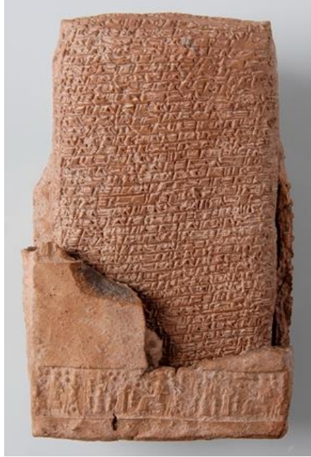
Resim 3. Kültepe Tabletlerinden bir örnek

i-li-wi-tim” “7 sarılmış kumaş” anlamına gelmektedir. TÚG ölçü birimine göre ayrılmış kumaşlar, uzun kervan yolunda muhafaza için genellikle deri çantaların içerisinde taşınmıştır. Bununla birlikte tüccarlar Asur ve Babil’den getirdikleri kumaşların yanında Anadolu’da dokunan kumaşların da ticaretini yapmışlardır (Kahveci, 2017).