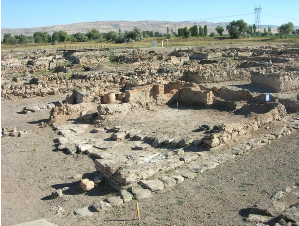
Resim 1. Kaniş Karumu Kalıntıları, Kültepe, Kayseri

Asurlular ticaret yolları boyunca karum ve wabartumlardan meydana gelen koloniler kurmuştur. “Koloni Çağı” olarak da anılan bu dönemde Asurluların yoğunlaştıkları ana pazar Orta Anadolu olmuştur (Koroğlu, 2006). Anadolu’da kurmuş oldukları koloniler 40’ın üzerindedir. Bunlardan bazıları, Kültepe’deki Kaniş Karum’u, Boğazköy’deki Hattuşa Karum’u, Acemhöyük’teki Puruşanda Karum’udur. Bunlar içerisinde Kaniş Karum’u ana merkez olma özelliğindedir (Kaya, 2017). İdari özerkliği olan ticaret merkezleri olan Karumlar, Anadolu’daki iktidar eksikliği sebebiyle Asurlulara ticaret şebekeleri kurmayı ve onu sürdürmeyi mümkün kılmıştır.