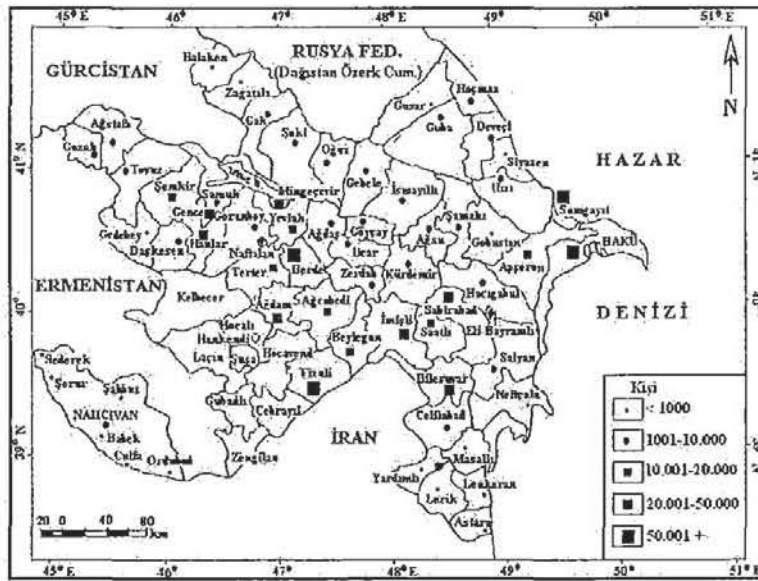
Şekil 2. Zorunlu iç ve dış göçe tabi olan toplam Azerbaycan Türklerinin ülke içindeki coğrafi dağılışı (ADGHK* haritalarından ve ADİK verilerinden yararlanılarak. Haritada boş kalan idari merkezler**).

Ülkede, Ermenistan'dan göç eden Azerbaycan Türklerinin en fazla yerleştikleri bölgeler; Apşeron ve Gence-Gazah'dır. Bu bölgelerde de Bakü, Hanlar, Sumgayıt, Gence ve Şemkir en çok göç alan idari yerleşmeler olmuştur. Diğer taraftan, hemen hemen diğer tüm idari yerleşim birimleri de Ermenistan'dan zorunlu göç eden nüfusu barındırmakta olup, almış oldukları göç miktarı 5 bin kişiden azdır. Böylece Şamahı, Nahçıvan, Saatlı, Goranboy, Mingeçevir, Apşeron, Yevlah, Gazah, Zagatala, Eli-Bayramlı, Gah, Balaken gibi yerleşmeler; Bakü, Hanlar, Sumgayıt ve Gence gibi yerleşmelerle kıyaslandığında çok düşük yoğunlukta göç almıştır (Şekil 2).