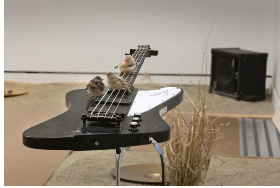
Resim 7: Céleste Boursier-Mougenot, From Here to Ear (detail), 1999

Sanatçı 1999'da gerçekleştirdiği 'From Here to Ear' (Buradan Kulağa) adlı işinde, ispinoz kuşları bas gitarlardan oluşan bir mekan yaratmıştır. Yere paralel olarak yerleştirilmiş gitarların tellerine konan kuşların hareketleri sonucu oluşan 'müzik', güçlü hoparlör vasıtasıyla izleyicilere ulaşmaktadır. Çalışma, Ohio'daki Çağdaş Sanat Merkezi'nden Milano'daki Çağdaş Sanat Merkezi'nden Long'a kadar pek çok uluslararası mekanda, yaklaşık 15 yıldır bir tür "konserler" vermeye devam etmektedir 9 . Sanatçı, Cage'in tavrına benzer bir tavırla, doğal olanı ve rastlantısallığı yorumlamaktadır. Çalışma, ses unsurunun yanısıra, galeri mekanının kullanımı ve içerdiği anlamlar açısından da çarpıcıdır.