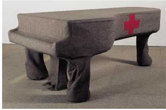
Resim 4: Joseph Beuys, “Kuyruklu Piyano için Homojen Filtre”, 1966

1950 sonrası sanatına baktığımızda, özellikle, Dada ruhuna sahip olan bir başka hareket olan Fluxus ile birlikte müziğin ve müzik aletlerinin sanat eserlerinde, bizatihi çalışmanın ana unsuru olarak yer aldığına tanık oluyoruz. Fluxus, sanat, sanatçı ve sanat yapıtı gibi değerlerin allanıp pullanarak alınıp satılan bir mala dönüştürülmesine karşı çıkmış, bunların ayrıcalıklı olmasını anlamlı bulmamıştır (Yılmaz, 2006: 268-270). Sosyal heykel kavramını ortaya koyan, sanatın iyileştirici bir rol oynayarak toplumu değiştirebileceğini savunan Alman sanatçı Joseph Beuys, eserlerinde kavramsal ve metaforik bir öge olarak müziği kullanmıştır.