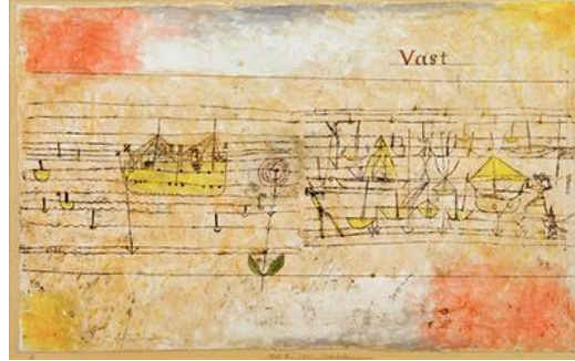
Resim 2: Paul Klee, Gül Limanı, 1927

Müzik ile resim arasındaki ilişkiyi en fazla sorgulayan ressamlardan bir diğeri, hem ressam hem besteci olan Paul Klee'dir.