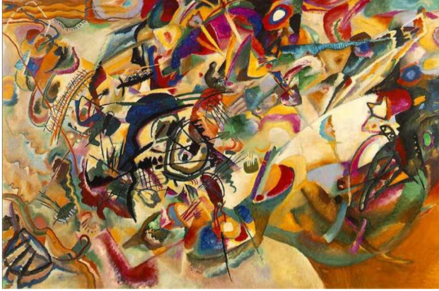
Resim 1: Kandinsky, Kompozisyon VII, 1913

dönümünde, müziğe ait dışavurum ve kompozisyon kuramları, mimari ve resmin gelişmesini sağlayan araçlar olarak benimsenmişti 1 .