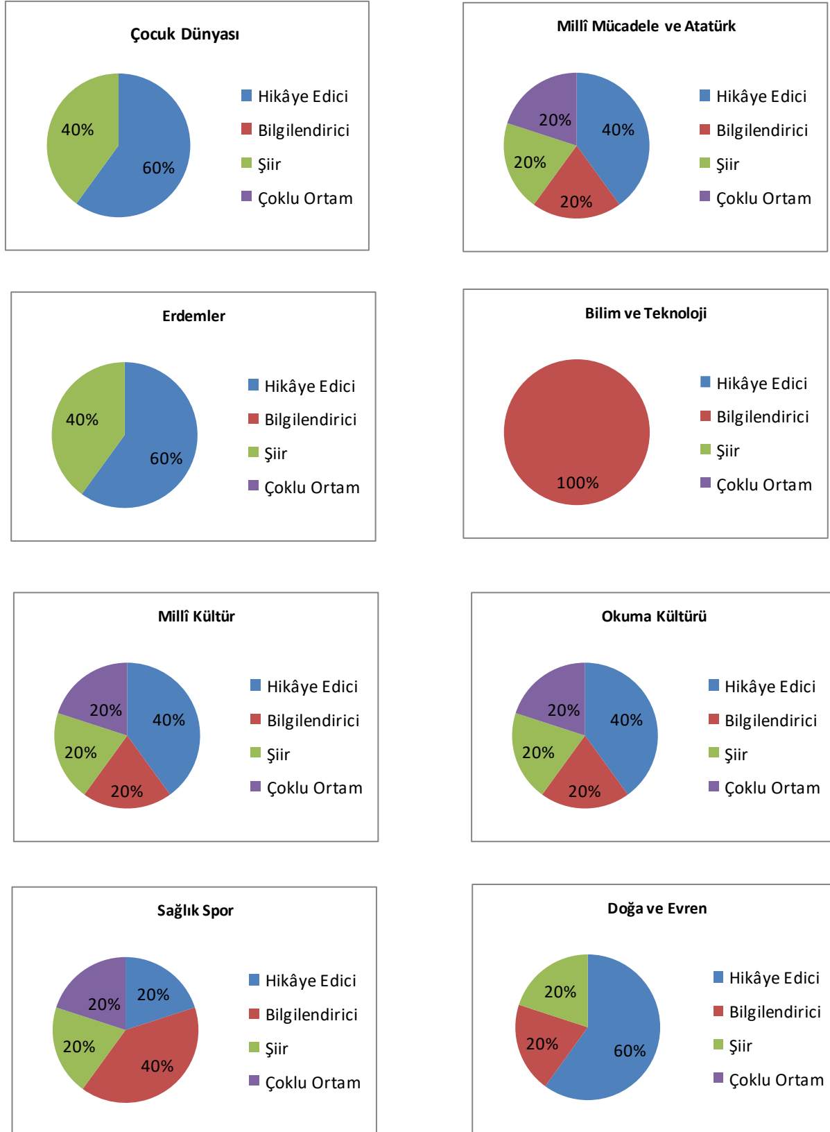
Tablo 6: Temalara göre türlerin yüzdeler dağılımı