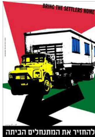
Resim 11, “Bring the Settlers Home” - “Yerleşenleri Eve Getirin”, 1980, yaklaşık 20inchx30inch ölçülerinde

beyaz üçgenler siyah ok ile bir araya geldiğinde Filistin ulusal bayrağını meydana getirir. 1862’de Amerika’nın önderliğindeki planlı yahudi göçünü afiş diline çevirmeye çalışan sanatçı, keskin üçgenleri orada yerleşik düzende bulunan Filistin halkının kırılması olarak posterin değişik bölümlerine konular. Bu poster İsrail’in başında başbakan olarak Menachem Begin 14 (1977-1983) bulunurken tasarlanmıştır. İsrail’in çeşitli partiler, koalisyonlardan çok sonraları kabul edeceği insani açıdan fazlasıyla plansız göç programı henüz o zamanlardan tasarımcı tarafından afişinde bir eleştiriye maruz bırakılmıştır. Başlık “Yerleşenleri Eve Getirin” birçok İsrailinin o yıllarda Batı Şeria 15 ’yı İsrail’in anavatanı olarak göz önünde bulundurmasını fikrini yeniden vurgulamak amacıyla atılmış olmasına rağmen halen güncelliğini de yitirmiş bulunmamaktadır. Tartakover bu işinde Begin’in yerleşme politikasını aynen olduğu gibi aktarmaya özen göstermiştir, Bu da; bir tekerlek, bir karavan ve eve İsrail’e dönüştür 16 .