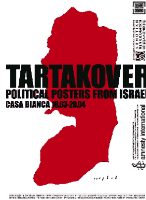
Resim 12, “Tartakover-Political Posters from Israel” – “İsrail’den Politik Posterler” sergi afişi

David Tartakover’ın “Stain” (Leke) adını verdiği politik poster serisi diğer bir ses getiren çalışma olarak mutlaka sayılmalıdır. İsrail ve Siyonizm ile ilgili çeşitli liderleri yüzlerine kırmızı bir Batı Şeria-Filistin haritası ekleyerek seyircilere sunmuştur. Bu portre afişlerden biri olan Siyonizmin babası Theodor Herzl de sanatçının bu çalışmasında kendisine yer adınmıştır. Bu poster serisi Casa Bianca, Thessaloniki Design Museum, Thessaloniki, Yunanistan’da “İsrail’den Politik Posterler” adı altında 18 Mart-20 Nisan 2005 Tarihleri arasından büyük bir katılım ile sergilenmiş ve oldukça ses getirmiştir.