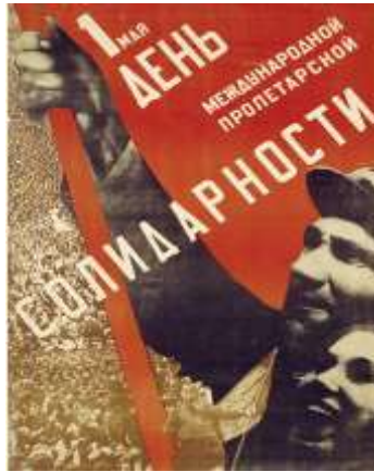
Resim 2, John Heartfield, 1936 yılına ait "No Pasaran" adlı Fotomontaj çalışması

Tartakover'ın üzerindeki Gustav Klutsis etkisini incelediğimizde; özellikle Klutsis'in işlerinden çoğunlukla tipografik yazı yerleşimleri ve perspektif kullanımı açısından birtakım esinlenmeler olduğu yönündeki yapılan karşılaştırmalar sonucu ortaya çıkmaktadır. Klutsis, çoğunlukla işlerinde farklı deneysel medya çalışmalarını yeğleyen bir sanatçı olarak görülmektedir. Propaganda unsuru sağlayan imgeleri arka planda bir işaret olarak kullanma da tasarımını oldukça ileri götürmüş olan Klutsis, Konstruktivist akıma dahil diğer sanatçılar gibi illüstrasyon ve çizim tekniklerine eserlerinde oldukça fazla yer vermiştir. Çoğunlukla imaj ve yazıyı dinamik bir kompozisyon, düzensiz bir büyüklük, açılı yerleşimler ve birbiriyle çarpışan perspektif görüntüleri içinde modern bir algı yaratmayı amaçlayarak sunmayı tercih etmiştir. Klutsis, ayrıca Tartakover'ın birçok eserinde sıklıkla kullandığı politik fotomontaj tekniğini de 1918 yılında ilk kullananlar arasında gösterilmektedir. (Bu tekniği kullanan diğer sanatçılar; Alman Dadaistlerden Hannah Höch, Raul Hausmann ve Rus El Lissitzky olarak belirtilmelidir)