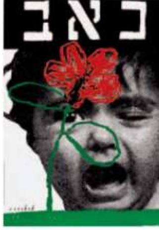
Resim 7, Pain-Acı adlı poster çalışması, 1989, Fotoğrafı çeken: Micha Kirshner.

Tasarımcılar, birçok İsraili açısından savaşa bir Filistin'linin bakış açısıyla bakmak mümkün olmayacağından dolayı, savaşın korkunç olabilecek sonuçlarını güçlü vurucu bir imge üzerinden genele yaymayı tasarımları üzerinden amaçlamışlardır. İsrail'de politik posterlerin bir kısmı vurucu bir nitelikte öne çıkmayı başarırken, yinede görülen; protesto grafiklerine büyük ihtiyaç duyulduğudur. Bazı tasarımlarda akılcıca ve güzel çözümlere rastlanırken, bazılarının da ise ölüm ve ölüyle ilgili komedi ve hiciv karışımı yaklaşımların sergilendiği de görülmektedir.