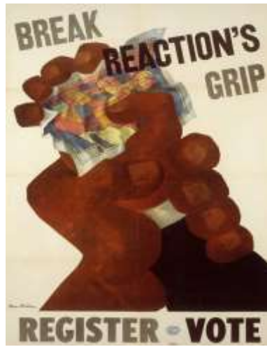
Resim 5, “Break Reaction’s Grip-Register Vote” – “Etki Altında Kalmayın-Oy Kullanın” Litografi tekniğiyle yapılmış afiş çalışması, 1927