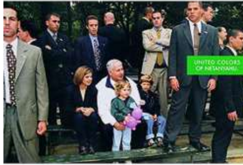
Resim 16, "United Colors of Bibi"- "Bibi'nin Bütün Renkleri", "We will never forget, We will never forgive"- "Asla unutmayacağız, Asla affetmeyeceğiz" başlıkları altında yayınlanan poster serisinden. (22x31 ½ inch), Fotoğraf: David Karp, 1998

14 yaşındayken Birleşik Devletlere göç etmek zorunda kalmış ve orada eğitim görmüş İsrail'in 2 dönem boyunca başbakanlığını yapmış İsrail adına önemli bir politif kişilik olarak afişin ana konusudur. Başkanlık yaptığı dönemler; 18 Haziran 1999 - 6 Temmuz 1999 ve yeniden göreve geldiği tarih olan 31 Mart 2009'dur. Tek bir fotoğraf ve "United Colors of Netanyahu" (Netanyahu'nun Bütün Renkleri) sloganıyla tamamlanan poster İsrail'de yapıldığı yılda oldukça ses getirmiştir. Sanatçı ayrıca, posterin ana yerleşiminde "Benetton" markasına ait taşıyıcı slogan ve sayfa düzeni üzerinden bir politik hiciv yaparak insanlar için tanıdık bir reklâm unsurunu politik bir posterde buluşturmayı da ilk defa denenmiştir. İsrail Kalite Yönetimi'nin düzenlediği bir konferansta sergilenen afişler, organizatörlerin şu söylemleriyle şaşkınlıkla karşılanmıştır: "politik olmayan bir organizasyon genelde politik bir tartışmada her iki tarafı da temsil etmek zorundadır, ya da hiçbir tarafı. Fakat şuan tecavüze uğramış gibi hissediyorum" 22 .