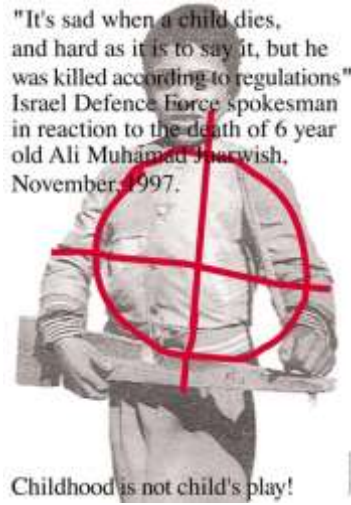
Resim 6, "Childhood is Not Child's Play"- "Çocukluk Çocuk Oyuna Değildir", 1998, Fotoğrafı çeken bilinmiyor. Alman Poster Müzesi Essen'de sergilenmektedir.

İletişimde en büyük sorun, insanların ciddi bir şekilde verilen mesajları dinlemek istememesiyle ortaya çıkmaktadır. İnsanlar fazlasıyla konuyu duyduğunu gördüğünü ve daha fazla konuya dair bir şeyler duymak istemediğine karar verebilmektedir. Bu durumda aslında politik posterlerdeki metodoloji oldukça önem kazanmaktadır. Öfkelenmek her zaman diğerlerini ikna etmek için en iyi yol olmayabileceği gibi mesajı asla algılamayan kitlelere kişiyi maruz bırakabilir. Birbiriyle aynı görüşü paylaşan topluluklar ile iletişim kurma, inandıkları şeyleri sağlamlaştırmaya yönelik empati ve aynı dünyada yaşadığımızı hissettirme gibi yöntemlerin çoğunlukla David Tartakover'ın afişlerinde başarıya ulaştığı ve geniş kitlelere hitab ettiği görülmektedir. (Glaser, 2006)