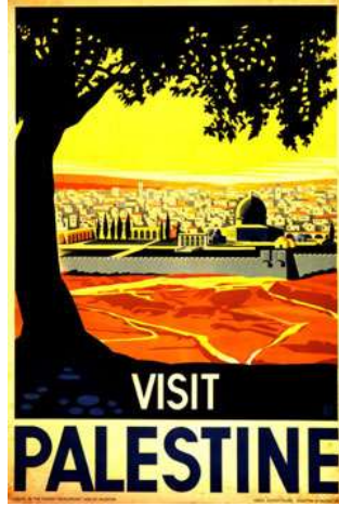
Resim 10, "Visit Palestine- Filistin'i Ziyaret Et", Orijinal Basım Tarihi: 1936 Yeniden Basım Tarihi: 1995, yaklaşık 20inchx30inch, Orijinal Tasarım: Franz Kraus, Yeniden Basım: David Tartakover.

David Tartakover bahsi geçen afişi 1995 yılında, Oslo Barış Anlaşmasının yarattığı optimist dönemi birnevi kendi diliyle kutlamak amacıyla yeniden bastırmıştır. Tel Aviv Müzesinden sergilenmesini sağlamış, bunun ironik bir biçimde hem İsrail hemde Filistinliler için sıcaklığını koruyan bir obje olduğuna da her fırsatta değinmiştir. Posterin izin verilmemiş baskıları ise evlerde, dükkânlarda, Batı Şeria ve Gazze'deki bütün ofislerde mekânları halen süslemektedir. Teoride, üzerinde "Filistin" yazan hiçbir Siyonist afiş Filistinliler arasına bu kadar dâhil bu kadar onlardan olmamıştır.