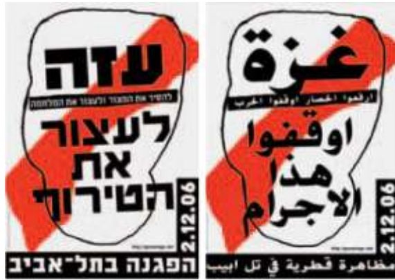
Resim 9, “Stop The Madness! Stop The War!- Durdurun Bu Çılgınlığı! Durdurun Savaşı!” adlı Politik Poster Çalışması, 2007 (99x69cm)

“Visit Palestine” orijinalinde bir Franz Krauz tasarımıdır ve Filistin Turizm Derneği (Siyonist Gelişim Ajansı) adına yayınlanmıştır. Posterde gördüğümüz manzara, parkları, yeşil bahçeleri, köy yerleşimi ve taştan mezar anıtıyla oldukça büyük hacimli bir duvarla çevrelenmiş Jerusalem şehridir. Bu poster konusunda çeşitli efsaneler de dilden dile antılagelmıştır. Filisten bir zamanlar insanların fazla olmadığı, fakat yinede o bahçelerle o evlerde birilerinin yaşamış olduğu bir şehirdir. Bazı efsanelerde de Filistin çorak bir çölün ortasında gelişmeyi bekleyen bir alan olarak tanımlanmıştır. Üçüncü efsane ise hiç böyle bir Filistin olmadığı üzerine kurulu olarak anlatı olarak kalmıştır. Tartakover’a göre tabii ki bir Filistin vardı ve afişte o varolan Filistin’e dair özlem anlatılmaya çalışılmıştır 13 .