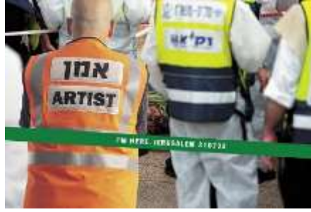
Resim 14, "I'm Here"- "Buradayım" serisi posterlerinden bir tanesi. Tasarımcı: David Tartakover, 2004

7 Haziran 2007 tarihi, Batı Şeria ve Filistin'in İsrail tarafından işgali sonucu Tartakover 40 yıllık işlerini yeniden bir araya getirmiştir ve üzerlerine üretildiği tarih aralığını ve sanattaki 40'inci yılını sembolize eden "Extra Large" (Daha Büyük) yazısı ile hepsini yeniden bastırmıştır ve retrospektif bir afiş serisine dönüştürmüştür.