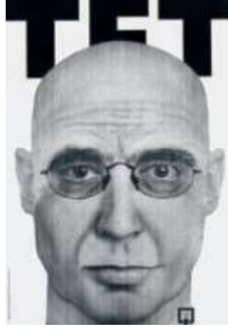
Resim 12, "Tet" "Baş" adlı poster. Bu poster 1999 yılında sanatçının İsrail polis departmanı bilgisayarında kendi pilot resmini oluşturması sonucunda ortaya çıkmıştır. Sanatçı bu posterle ilgili soruları şöyle cevaplar: "Sizce bu Benmiyim?"

Sanatçının son dönem eserlerinde çoğunlukla döneme dair politikacılara ve orduya daha fazla yer verdiğini görmekteyiz. "The Meeting of Obama, Netanyahu and Abas" (Obama, Netanyahu ve Abas Buluşması) adlı afiş çalışmasında liderlerin altında askerleri gölge olarak kullanması dikkat çekicidir. Tüm askerler kendi ülkelerine dair uniformalar ile liderlere simetrik bir biçimde konumlandırılmıştır. Son dönem işlerinin pek çoğunda genel tasarım dilinden taviz vermediğini gördüğümüz sanatçı, son 5 yıldır eski çalışmalarını içerek toplu sergiler ile sanatseverlerin karşısına çıkmaya devam etmektedir (Tartakover, 2010).