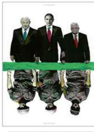
Resim 19, "The Meeting of Obama, Netanyahu, Abas", 2010 yılına ait poster tasarımları.

Sanatçının son dönem eserlerinde çoğunlukla döneme dair politikacılara ve orduya daha fazla yer verdiğini görmekteyiz. "The Meeting of Obama, Netanyahu and Abas" (Obama, Netanyahu ve Abas Buluşması) adlı afiş çalışmasında liderlerin altında askerleri gölge olarak kullanması dikkat çekicidir. Tüm askerler kendi ülkelerine dair uniformalar ile liderlere simetrik bir biçimde konumlandırılmıştır. Son dönem işlerinin pek çoğunda genel tasarım dilinden taviz vermediğini gördüğümüz sanatçı, son 5 yıldır eski çalışmalarını içerek toplu sergiler ile sanatseverlerin karşısına çıkmaya devam etmektedir (Tartakover, 2010).