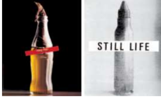
Resim 3, Tasarımcı: David Tartakover, Fotoğrafçı: Oded Klein, Eylül 1987 Yahudi Yeni Yılı'nın Kutlanması amacıyla tasarlanmıştır. Filistinlilerin isyanına dikkat çekmek amacıyla tasarlanmıştır.

sunan posterini Heartfield, herne kadar komplike bir fotomontaj örneği olmasa da vermek istediği mesajı biraraya getirilmiş bir fotoğraf üzerinden tüm sadeliği ile izleyiciye sunmuştur. Ayrıca bu poster çalışmasında vermek istediği mesaja bir coca cola şişesini dâhil ederek gizli bir Amerika mesajını da postere gizlemiş olması Andy Warhol'un popüler kültürüne bir gönderme olarak da algılanabilir. Aynı mesaj sadeliğine ve konsept çalışmalarına Tartakover'da da rastlamaktayız.