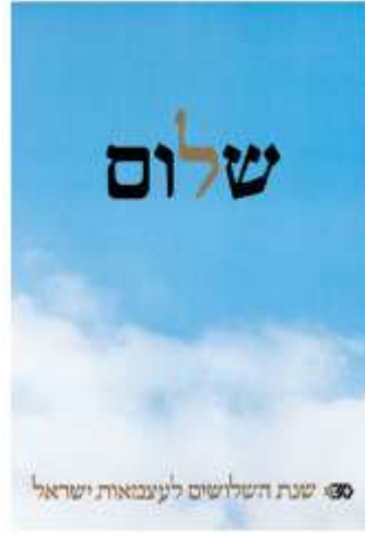
Resim 17, "Peace"- "Barış" (70x100cm), 1977, Tartakover'ın politik poster serisine henüz başlamadığı dönemlerden bir iş örneği. İsrail'in 30'uncu kurtuluş yıldönümü için tasarlanmıştır.

David Tartakover'ın her yıl düzenli olarak Yahudi kutlamaları ve bayramları için tasarladığı birtakım afişler mevcut olmakla birlikte bunlardan en ilginç yeni yıl kutlaması 1995 yılında tasarladığı "Mutlu Korkular" afişidir. Tartakover, burada kullandığı tek bir silah imajını İsrail'in giderek bir şiddet ve korku toplumuna dönüşüyor olmasını, kontrolsüz silahlanmayı vurgulamak amacıyla hayli büyük kullanır. Afiş, 4 Kasım 1995 Cumartesi günü, İsrail Başbakanı Yitzhak Rabin'in Yigar Amir tarafından arkasından 3 el ateş edilmesini protesto eden gizli bir niteliğe de sahiptir (Kraft, 2004:62).