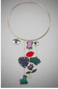
Resim 22: Niki de Saint Phalle, (1930–2002), Kolye.