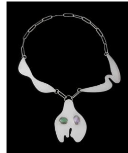
Resim 4: Jean Arp, “Şişe Baş ve Bıyık”, Gümüş, Ametist, Amazonit Kolye, 26x15cm., 1960.

Alexander Calder (1898-1976) ; 20. yüzyılın en yenilikçi ve büyük isimlerinden biri olan ve sanatçı bir aileden gelen Calder, sanata çocuk yaşlarda başlamıştır. Heykel dışında resim, rölyef, sahne, oyuncak ve takı tasarımı da yapmıştır. “Sanat neden durağan-statik olmalıdır? Soyut bir resim ya da heykele baktığımızda, hiçbir anlamı olmayan planlar, daireler, düzlemlerin benzer hareketlerini görüyoruz. Mükemmel olabilir ama hep hareketsiz. Heykeldeki bir sonraki adım harekettir” (Moreeuw Sitesi) diye düşünen Calder, aslında makine mühendisidir ve onu asıl ünlü yapan bu düşünceyle ortaya çıkmış “mobil” heykelleridir.