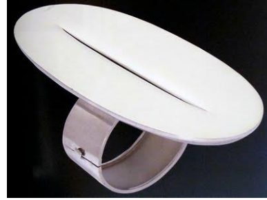
Resim 18: Lucio Fontana (1899-1968), Gümüş ve Lak Bilezik.