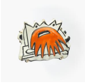
Resim 13: Fernand Léger (1881-1955), Seramik Broş ve Kolye.

Bu küçük ölçekli yapıtlar pek çok sanatçı için bazen yakın çevrelerine hediye olarak verdikleri tasarımlar olsa da, sanat dünyasında eşsiz eserler olarak yerlerini almışlardır (resim: 13, 14, 15, 16, 17, 18, 19, 20, 21, 22, 23, 24).