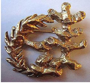
Resim 16: Jacques Lipchitz (1891-1973), Altın Broş.