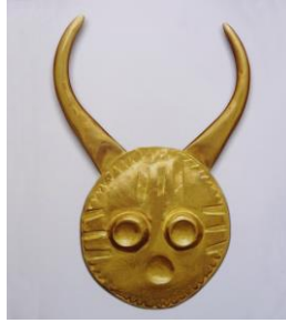
Resim 17: Max Ernst (1891-1976), Altın Broş.