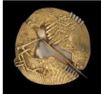
Resim 11: Gio Pomodoro, İsimsiz, Sarı ve Beyaz Altın Broş, 5,1x5,7x5,1cm, 1963