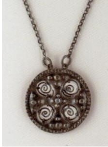
Resim 1: Julio González, Gümüş Kolye, Kolye, Uzunluk: 73cm., 1920-1930.