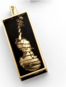
Resim 10: Arman, Minyatür, Keman, Altın Kolye, 58x23x7mm. ~1998

Sanatçının çok sayıda örneğini gördüğümüz takıları, genelde mekanik görünümlü figürlerden oluşmuştur. Resim 12’de görülen sarı bronz, yap-boz parçalarıyla oluşturulmuş erkek torsu 60’lı yılların sonunda kolye olarak tasarladığı bir çalışmasıdır (Tajan Sitesi, 2008: 63).