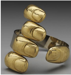
Resim 8: Bruno Martinazzi, "Altın Parmak", Altın Bilezik, 6,5cm., 1969.

Heykel-mekan ilişkisi üzerinde duran Caro, gerilimler ve karşıtlıklar yaratmaya çalışmıştır (Eczacıbaşı Sanat Ansiklopedisi, 2008). Sanatçının takı çalışmaları da heykellerini destekler biçimlerde. Resim 9'da çizgi, yüzey, form, boşluk gibi farklı plastik elemanları bir araya getirerek yaptığı küçük boyutlu Caro heykeli denebilecek broş örnek olarak gösterilebilir. Altından, farklı geometrilerden oluşan kompozisyon, olduğundan daha büyük bir etkiyle izleyicisiyle bütünleşebilmektedir.