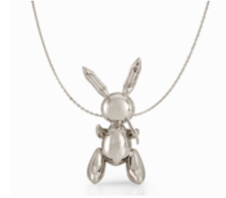
Resim 24: Jeff Koons (1955-), Platin Kolye.

“Farklı disiplinlerden gelen takı tasarımı ve üretimiyle uğraşan sanatçıların bireysel sanat anlayışları seyirciye, ürettikleri takılar aracılığıyla yansımıştır. Böylece sanatçılar, takının hem biçimsel hem de kavramsal olarak ifade ettiği değerlere farklı bir bakış açısı kazandırmışlardır. Dolayısıyla bu çalışmaların, takının bir sanat nesnesi olarak değerlendirilmeye başlanmasına katkısı büyüktür” (Ertan Ayata, 2015: 94).