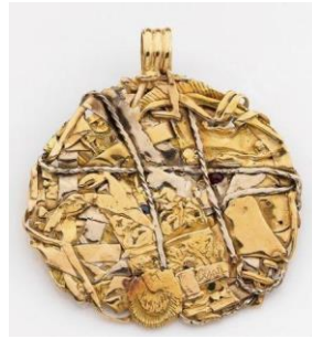
Resim 6: César, ‘Sıkıştırma’ Altın, Zümrüt, ve Yakut Kolye, 77.3gr. y: ?.