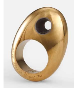
Resim 15: Man Ray, (1890-1976), Altın Yüzük.