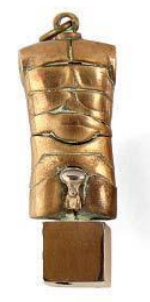
Resim 12: Miguel Berrocal, “Tors”, Bronz Kolye ~6,4cm., 1960’lı yıllar.

Tüm bu saydığımız örnekler dışında, 20. ve 21. yüzyılın en büyük sanatçılarından, Hector Guimard, Fernand Léger, Jean Cocteau, Man Ray, Jacques Lipchitz, Max Ernst, Lucio Fontana, Alberto Giacometti, Jean Dubuffet, Salvador Dali, Richard Pousette, Mimmo Rotella, Roy Lichtenstein, Robert Rauschenberg, John Chamberlain, Niki de Saint Phalle, Roman Opalka, Nam June Paik, Anish Kapoor, Jasper Johns, Villeglé, Jeff Koons ve bunun gibi sayabileceğimiz pek