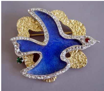
Resim 3: Georges Braque, “Kuş” Altın, Mavi Emaye, Kırmızı Yalancı Elmas Broş 5,8x 3,3cm., 1960.

Takı çalışmaları heykelleri paralelinde gelişme göstermiş, Arp çizgisini hep taşımıştır. Resim 4’de görülen takısında da, heykel sanatıyla ilgili olan herkesin Arp çalışması olduğunu hemen anlayabileceği ve sanatçının kişisel çizgisinin açıkça gözlendiği tarz söz konusudur. Basit bir işçilikle yapılmış gibi görülen kırık şişe şeklinde bıyıklı bir baştan oluşan tasarımın altında, büyük hayal gücü ve soyutlama yeteneği olduğu şüphesizdir.