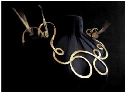
Resim 5: Alexander Calder, İsimsiz, Pirinç Kolye, 35,5x40,6cm., 1949.

Resimde 6’de görülen takı, César’ın sıkıştırma çalışmalarının küçük boyut örneği olarak gösterilebilir. 4 Büyük boyutlu “sıkıştırmalar”ını bu şekliyle ve farklı bir kullanımda görmek hem takan kişiyi hem de onu görebilen herkesi fazlasıyla heyecanlandırmaktadır. Yine resim 7’de herkesin çok iyi tanıdığı, César denince akla ilk gelen çalışmalarından biri olan “başparmak” heykelinin küçük halini örnek olarak gösterebiliriz. Heykel bu yeni haliyle insan üzerinde hareket kazanmış, yer değiştirmiş, böylelikle farklı ve çok sayıda insanla iletişim kurma olanağı bulmuştur. César, kendi çizgisini taşıyan bu küçük heykellerle, daha farklı seyirci kitlesine ulaşabilmiştir.