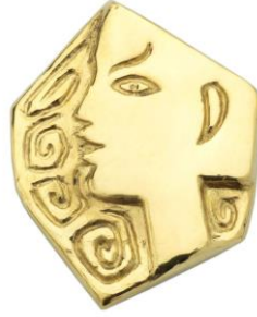
Resim 14: Jean Cocteau (1889-1963), Altın Broş.