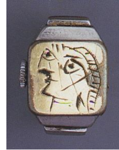
Resim 2: Picasso, “Dora Maar’ın Portresi”, Krom kaplı Metal Yüzük, h:?, 1936-1939.

Georges Braque (1882-1963) ; çağdaş ve soyut sanatın en önemli isimlerindendir ve Cézanne’nın resimlerinden etkilenerek geometrik çizimlere yönelmiştir. Daha sonra Picasso ile hatta ondan daha önce Kübizmin öncülerinden biri olmuştur.