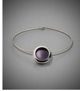
Resim 23: Anish Kapoor (1954-), Beyaz Altın, Mor Emaye Kolye.