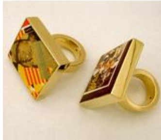
Resim 20: Mimmo Rotella (1918-2006), Metal Yüzük.