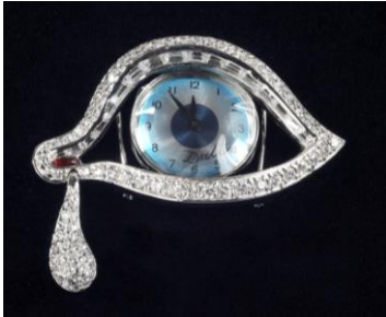
Resim 19: Salvador Dali (1904-1989), Değerli Taş ve Metal Broş.