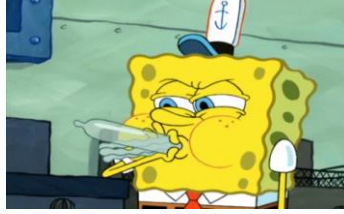
RESİM 11: Sünger Bob