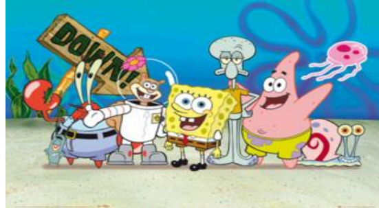
Resim 10: Bay Yengeç-Gray-Sünger Bob-Patrick

Sünger Bob çizgi filmde: “Nickelodeon” kanalı için 1999 yılında Amerikalı çizgi film yapıcısı ve aynı zamanda deniz biyoloğu olan Stephen Hilenburg tarafından yaratılan çocuklar tarafından oldukça sevilen popüler bir çizgi film olan Sünger Bob da deniz altındaki canlıların yaşamı “insan yaşamının kurallarına göre” işlenmiştir. Kadın- erkek ilişkisi düzeyinde örneklenmeler yoktur. Dolayısıyla cinsiyet kavramı belli değildir. “ Sünger Bob ” çizgi filmi sık sık “eşcinsellik propagandası tartışmalarına neden olmuştur. Patrick'in (erkek karakter) kıyafeti ve Sünger Bob'un (erkek karakter) iç çamaşırıyla gösterilmiş hali de bunu düşündürmektedir. 2012'de Ukrayna'daki Ahlak komisyonu, Ukrayna Meclisi'ne okyanusun derinliklerindeki canlıların komik maceralarını anlatan “ Sünger Bob ” çizgi filminin eşcinselliği teşvik ettiğini bildiren bir önerge sunmuştur.(Resim 10)