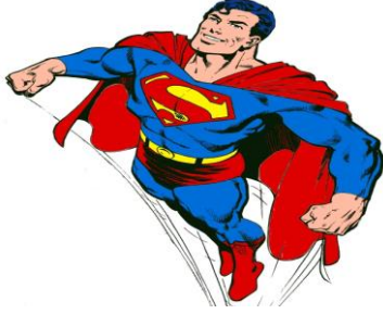
Resim 6: Süperman

le karşı karşıya gelirse sıradan bir Amerikan vatandaşı bile bu " Tehlike" ye ve " Kötü Güçler " e karşı harekete geçmeli, seferber olmalıdır. Çünkü sıradan, sakar bir gazeteci olan Clark Kent'in "Süperman" e dönüşmesinde görüldüğü gibi, sıradan bir vatandaş bile çok şeyler yapabilmektedir(Sediyani, 2013)