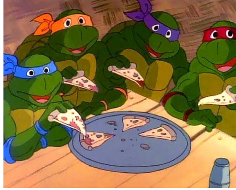
Resim 15: Ninja Kaplumbağalar