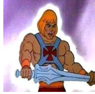
Resim 7: He-Man

Siyasi içerikli çizgi filmlerimizden HE-MAN de ise: Ana karakter uzun boylu sarışın ve isimden de anlaşılacağı üzere ataerkil(soyda temel olarak babayı alan ve ailede çocukları baba soyuna mal eden topluluk düzeni) biri olan He-man , Action( eylem, hareket) türü ve şiddet eğilimli çizgi film, 1983-85 yılları arası 130 bölüm olarak çekilmiştir. (Resim 7) Tip ve görünüş bakımından tam bir "Alman ırkı " şeklinde çizilen He-man karakterin üniformasının tam ortasında büyük haç bulunmaktadır. He-man savaş esnasında zırhlarla çevrili yeşil kaplanın üzerine binmektedir. "Kaplan"(Tiger), Almanların savaş sırasında kullandıkları "TİGER1ve TİGER 2" tanklarının adıdır(Sediyani, 2013).