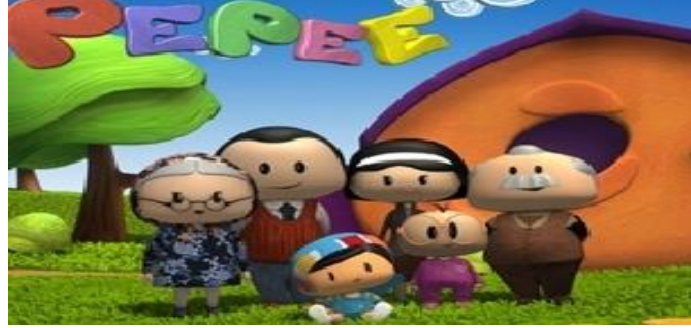
Resim 17:Pepee ve Ailesi

Türk kültüründe ailenin ne kadar önemli olduğunu ve aile kavramının daha da çok “Geniş Aile” ile özleştirildiği anlatılmaya çalışılmaktadır. (Türkmen;2012;144-146).