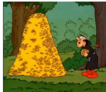
Resim 4: Gargamel