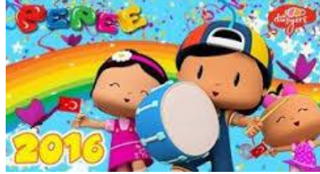
Resim 19: Pepee

şacağımız kıyafetlerle karşımıza çıkmaktadırlar. Pepee karnı acıktığında Türk mutfaklarında sıkça pişirilen yemekleri yemektir. Tahin pekmezli ekmek, yumurta, bal, süt, Pepee'nin kahvaltı yiyecekleridir. Pepee halk oyunlarına oldukça meraklı ve bunları oynamayı çok seven bir çocuktur(Türkmen;2012;144-146).