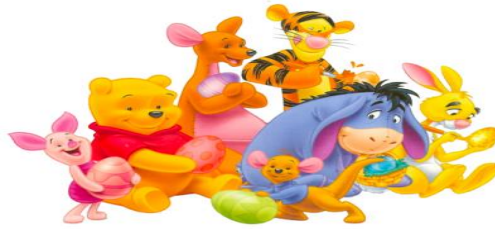
Resim 14: Piglet- Pooh-Eeyore-Tiger- Tavşan

çizgi filmimiz Winnie the Pooh' da karakterlerden her biri bir uyuşturucu bağımlılığının tepkilerini göstermektedir. Bu çizgi filmde ki Eeyore adlı eşek hiçbir şeyi takmamakta, tepkilerini çok yavaş olup ve motivasyon eksikliği yaşamaktadır(marijiuna etkisi). Winnie Pooh'taki Piglet ise her şeyden korkmakta, sürekli kovalandığını ve takip edildiği paranoyasına sahip bir karakteri canlandırmaktadır. (bir çeşit uyuşturucu yapan mantar etkisi). Çizgi film de ki Tavşan ise, sürekli herkesin işine karışmakta ve sürekli bir şeylere ihtiyaç duymaktadır (kokain etkisi). Bu çizgi film de Tigger karakteri ise sakinleşemiyen, yerinde duramayan, sürekli zıplayan ve yorulmayan bir karakteri canlandırmaktadır.(ecstasy etkisi). Bu çizgi filmdeki insan karakteri olarak çizilen Cristopher Robin ise, havyanlarla konuşmaktadır (halusinojen etkisi). Ayı karakterini canlandıran Winnie ise tatlıyı çok sevmekte olup ve çılgın bir hayal gücüne de sahiptir(Isd etkisi). Baykuş karakteri ise, ne zaman yardım gerekse orada bulunmaktadır (uyuşturucu vermek için)(satıcı- torbacı) (Resim 14)