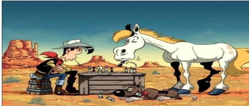
Resim 16: Lucky Luke(Red Kit)

Red Kit, ailesi ve arkadaşları olmayan yalnız yaşayan bir karakteri canlandırmaktadır. Kötü karakterlerden olan Daltonlar ise aile hayatı yaşamaktadırlar. Fakat anne eğitiminin eksikliğinden dolayı herkesi korkutup titreten Daltonlar "annelerine" karşı saygılı olup asla sözünden çıkmasalar da daima kötü davranış biçimleri sergilemektedirler. Bu çizgi film içinde yer alan kızıl derililer ise " kafa derisi yüzen kötü insanlar " olarak resmetmişlerdir. (Resim 16)(Sediyani,2013).