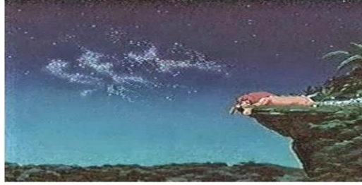
Resim 12: Arslan Kral

Ahlaki içerikli çizgi filmlerden biri olan Arslan Kral da ise Disney yapımı bir çizgi filmde anlık bir görüntüyle cinsel şekillerin yerleştirildiği ortaya çıkmaktadır. Arslan Kral tepede dinlenirken yıldızların oluşturduğu bu şekilde "SEX" yazmaktadır(Kanipek, 2013).( Resim 12)