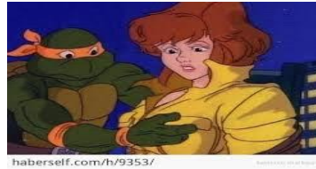
Resim 13: Ninja kaplumbağalar

Ahlaki çizgi filimler de yer alan Ninja Kaplumbağaların da ise anlık bir görüntüyle Michelen-gelo, April'in göğüslerine dokunmaktadır. Bu subliminal(anlık) görüntü ile çocukların üzerinde olumsuz bir mesaj bırakmaktadır(Atan 1995;38). (Resim 13)