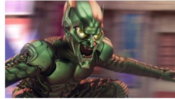
Resim 19: yeşil cin

Dini İmgeler içeren bir diğer çizgi filmi Spiderman (Örümcek Adam) ise: Spiderman'ın en büyük düşmanı “ Yeşil Cin ” karakteriyle gösterilmiş olan dini bir motiftir.(Resim 19)Yeşil cin karakterinde ki yeşil renk, İslam'ı temsil etmektedir. Spiderman (Örümcek Adam) çizgi filmi, içinde semboller olarak işlenen “ İslam düşmanlığı” ve “İran karşıtlığı” yüzünden İran da yasaklanmıştır(Atan 1995;38).