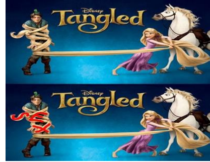
Resim 2: Tangled

Televizyonda izlediğimiz çizgi filmlerde ki subliminal mesajlar, biz fark etmeden bilinçaltımıza işlenmektedir(Kanıpek, 2013)