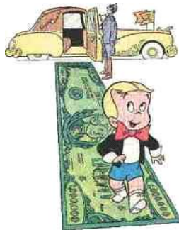
Resim 3: Richie Rich