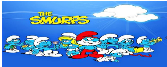
Resim 5:Şirinler (The SMURFS)

Politik ve siyasetle ilgili işlevleri olan çizgi filmlerdir. Bunların içerisinde Şirinler, Süperman, He-man, Örümcek adam çizgi filmlerini sayabiliriz. Çalışmamızda ele aldığımız siyasi içerikli imgelerin kullanıldığı Şirinler (THE SMURFS) , çizgi filmde: 1958 yılında üretilmesine rağmen 1981 yılında televizyonlarda yayınlanmaya başlanmıştır. Bu çizgi filmin tasarımcısı Peyo, Sovyet hayranı ve komünist bir karikatüristtir. Bu çizgi filmin İngilizce ismi olan "smurfs" kelimesinin de "small man under red flag"(kızıl bayrak altında yaşayan küçük adamlar) şeklinde bir açılımı olduğu öne sürülmektedir(Kılıcı, 2009: 61). Çizgi filmde de kızıl babayı şirin baba temsil etmektedir. Şirin baba Komünizm ' in kurucusu Karl Marx benzetilmiştir.(Resim 5)Bilgiç şirin ise Lev Troçki 'dir. Lev Troçki'sık sık şirinler tarafından alay konusu olup köyden kovulmuştur. (Tıpkı Troçki de SSCB' den kovulmuş olduğu gibi.)" Şirinler" çizgi filmdeki başlangıç ve bitiş müziği, " Sosyalist Enternasyonal " marşının ritmiyle tıpatıp aynıdır. Şirinler çizgi filmde yer alan köyde para kavramının olmaması( Anti- Kapitalizm ), ayrıca herkesin kendi yeteneğine göre iş yapması, ihtiyacı olan kadar üretilip-tüketilmesi( Komünizm ), sembolize etmektedir. Şirinler( sosyalist toplum ), şirin köy ( SSCB ), Gargamel ( ABD ), Azman( İsrail ) sembolize eder. Azman Türkçeye çevirirken değişikliğe uğramıştır kelimenin aslı" Asrael" dir, (Asrael=İsrail) (Schmidt, 2003: 160, Aktaran:Kılıcı, 2009: 61).