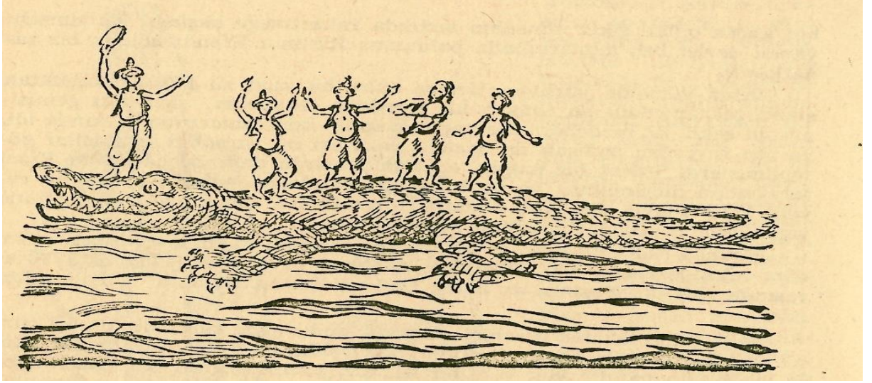
Resim 1: III. Ahmet döneminde sarayın baş mimarlığını yapan İbrahim Efendi tarafından tasarlanan, Türk Denizcilik Tarihinin ilk denizaltı tasarımı (temsili). Reşat Ekrem Koçu, Osmanlı Padişahları , Ana Yayınevi, İstanbul 1981, s. 294.