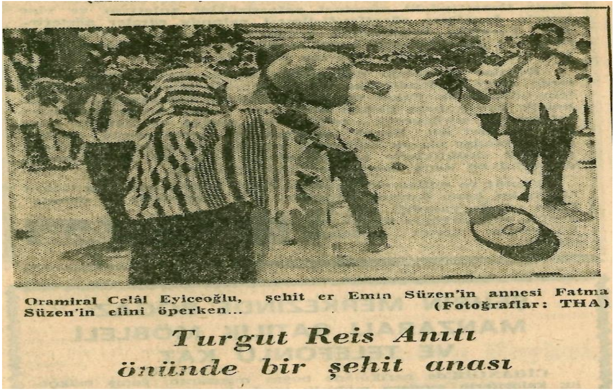
Resim 8: Cumhuriyet gazetesi, 22.06.1972, s.1.