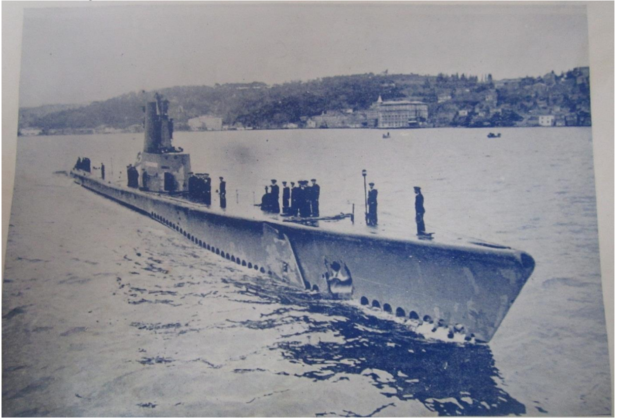
Resim 3: Dumlupınar Denizaltısı. Dumlupınar Şehitleri 4 Nisan 1953' ün Hâzin Hatırası , (Yayın Yeri ve Yılı Yok) adlı kitaptan alınmıştır.