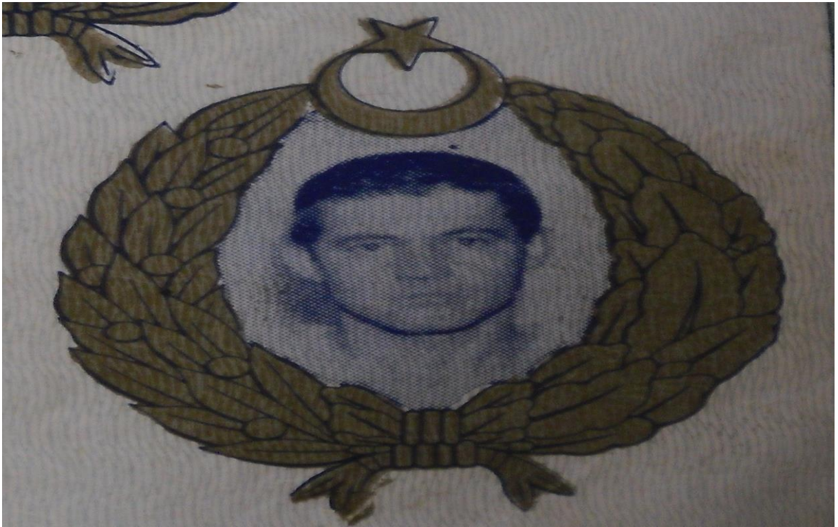
Resim 4: Emin Süzen (1931 – 1953). Dumlupınar Şehitleri 4 Nisan 1953' ün Hâzin Hatırası , (Yayın Yeri ve Yılı Yok) adlı kitaptan alınmıştır.