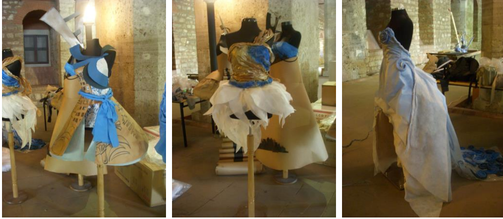
Resim 18-19-20: Öğrencilerin sergilemek üzere hazırladıkları kostümlerden görüntüler.