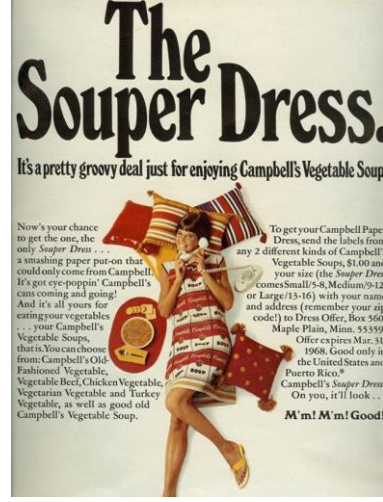
Resim 1-2: “Souper Dress” Andy Warhol’un çizimlerinden yola çıkılarak yapılmıştır. Çorba kutularının üzerindeki etiketlerden iki tane ve bir dolar getiren herkes beden ölçülerini bildirerek bu kağıt elbiseye sahip olabiliyorlardı. MetMuseum.org/collection

Bir süre, tüketim çılgınlığı ve reklam kampanyaları için araç olmaktan farklı bir amaca hitap edemeyen kağıt giysiler, kalıcılığının korunabileceği konumlardada, yer almaya başlamıştır. 2000’li yıllarda, sanatsal değer kazanarak, sanat eseri niteliğindeki kostümlerin kopyalarının yapılması için malzeme olarak kullanılan kağıt artık bir müze eseri haline gelmiştir. Kağıt kostüm tasarımlarıyla adından söz ettiren Belçika’lı sanatçı Isabella de Borchgrave, yaptığı çalışmaları bir araya getirerek, oluşturduğu “Papiers a la Mode” adlı sergisiyle kostüm tarihine adeta bir ayna tutmaktadır. Borchgrave’in ilham kaynağı, 1994’te Yves Saint Laurent’ın bir retrospektif sergisi olmuştur. Bir kostüm tarihçisi olan, Rita Brown’la çalışan Borchgrave, orijinal dönem kostümlerini, tüm ayrıntılarıyla tamamen inceleyip, ölçüler olarak günlerce yapılan bir araştırma safhasından sonra tasarımları uygulamaktadır. 2004 yılında, Jacquelin Kennedy’nin gelinliğini, birebir kopya ederek yine çok önemli bir çalışmaya imzasını atmıştır.