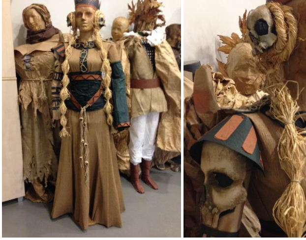
Resim 14-15: “Lady Macbeth” karakteri için tasarlanmış kostümden papier-mache tekniği kullanılarak yapılan kol detayındaki kurukafalar.

Kağıt kostümlerin gördüğü ilgi, öğrencilerin düş gücünü harekete geçirecek bir çalışmayla, 10.Akdeniz Sanat Okulları Buluşması kapsamında, 3-9 Mayıs 2010 tarihinde yapılan workshopta “Boğaz’dan İzler” adlı çalışmamızı gerçekleştirmemize sebep oldu. Katılımcılar, kağıt ve elyaf gibi farklı türde malzemeler kullanarak, İstanbul Boğazının herhangi bir yerinden aldıkları kesitleri ve gördüklerine dair izlenimlerini, üç boyutlu biçimlendirerek kostümlerini uyguladılar. Çalışma, öncelikle öğrencilerin, kadraj seçimi ile başladı ve buna bağlı olarak, ilk düşüncelerle ilgili yapılan beyin fırtınasından sonra uygulanacak çalışmaların belirlenmesiyle devam etti. Çalışmanın devamında, uygulamalara geçerken, kalıp çıkarma ve uygulama teknikleri anlatılarak tasarımlar, oluşturuldu.