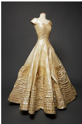
Resim 3: Jacquelin Kennedy’nin gelinliği. Isabelle de Borchgrave ve Rita Brown tarafından kopyalanmış. John Kennedy Başkanlık kütüphanesi ve müzesi.

Bir süre, tüketim çılgınlığı ve reklam kampanyaları için araç olmaktan farklı bir amaca hitap edemeyen kağıt giysiler, kalıcılığının korunabileceği konumlardada, yer almaya başlamıştır. 2000’li yıllarda, sanatsal değer kazanarak, sanat eseri niteliğindeki kostümlerin kopyalarının yapılması için malzeme olarak kullanılan kağıt artık bir müze eseri haline gelmiştir. Kağıt kostüm tasarımlarıyla adından söz ettiren Belçika’lı sanatçı Isabella de Borchgrave, yaptığı çalışmaları bir araya getirerek, oluşturduğu “Papiers a la Mode” adlı sergisiyle kostüm tarihine adeta bir ayna tutmaktadır. Borchgrave’in ilham kaynağı, 1994’te Yves Saint Laurent’ın bir retrospektif sergisi olmuştur. Bir kostüm tarihçisi olan, Rita Brown’la çalışan Borchgrave, orijinal dönem kostümlerini, tüm ayrıntılarıyla tamamen inceleyip, ölçüler olarak günlerce yapılan bir araştırma safhasından sonra tasarımları uygulamaktadır. 2004 yılında, Jacquelin Kennedy’nin gelinliğini, birebir kopya ederek yine çok önemli bir çalışmaya imzasını atmıştır.