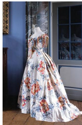
Resim 4: Isabelle de Borchgrave

Tarafından yapılmış “Papier a la Mode” adlı çalışmalar.