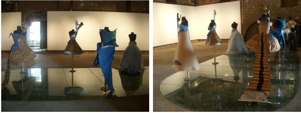
Resim 21-22: 10. Akdeniz Sanat Okulları Buluşması “Boğaz’dan İzler” 3-9 Mayıs 2010 workshop çalışması. Tophane-i Amire Sergi Salonu / İstanbul

“Boğazdan İzler” adlı çalışmanın konusu, Turkuaz, Deniz ve Toprak’ın içinde bütünleştiği, İstanbul şehri ve pek çok sanatçının etkilendiği, İstanbul Boğaz’ının bizler de bıraktığı izleriydi. Çalışmanın amacı, katılımcılarda oluşan çağrışımların, kâğıdın zenginliğini de kullanarak kostüme dönüşümlerini, sağlamaktı. Bu çalışmada ilk olarak, İstanbul Boğaz’ının kişide bıraktığı izlerden yola çıkarak, bu izlerin kostümde nasıl ifade bulacağına dair düşünceler geliştirildi. Katılımcılardan, bu düşünceleri önce kâğıt üzerine dökmeleri ve daha sonra da kalıp çıkarma teknikleri gösterilerek, tasarımlarını üç boyutlu hale dönüştürmeleri, istendi.