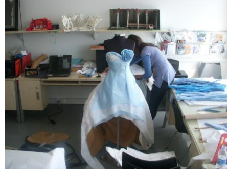
Resim 16-17: 10. Akdeniz Sanat Okulları Buluşması “Boğaz’dan İzler” 3-9 Mayıs 2010 workshop çalışması.