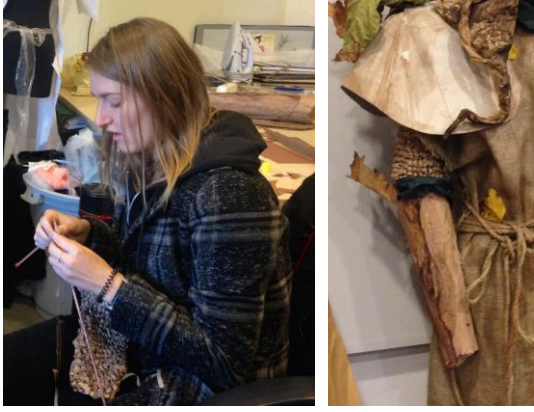
Resim 12-13: Tasarımcı örme zırhı kraft mal-zemeyi şeritler halinde kesip şişler yardımıyla öreerek ortaya çıkarıyor.

Çalışmalarda kağıt malzeme olarak kraft kağıdının her nevi kalınlıkta olanı baz olarak kullanılırken, ilave malzeme olarak pelur, desen, fon, grapon, kağıt elyaf, gazete, saman kağıdı gibi çeşitli farklı kağıt malzemelerle uygulamara destek vermekteyiz. Kağıt malzemenin dışında kullanılan, tasarımlarımıza aykırı durmayacak, her türlü ip, halat, kordon, yapay çiçek, çuval, kafes teli gibi malzemelerde bütünlüğü bozmayacak şekilde, kullanılmaktadır. Tüm bu malzemelerin kaynaştırılması birbiri içinde öne çıkmayacak biçimde tasarımın realize edilmesi, yine tasarımcının kendi öngörüsüyle oluşmaktadır. Çoğu zaman, öğrencilerin kendi getirdiği önerilerle, yeni dokular yaratılmakta, kağıda yapılan bu yaratıcı müdahalelerle öğrencilerin tesadüf sonuçlar elde etmelerine sebep olmaktadır.