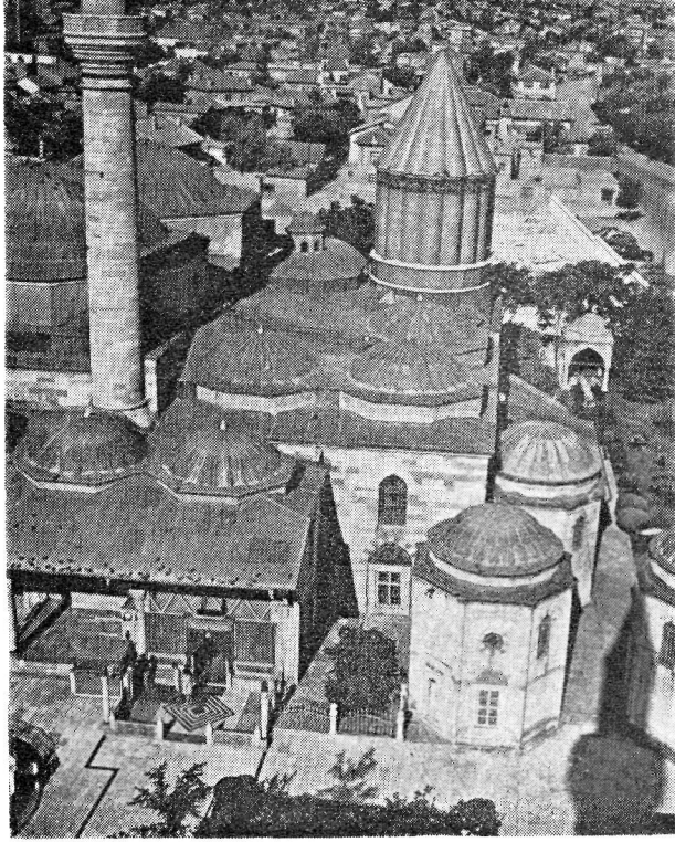
Res. 1- Konya Mevlâna Türbesi. Genel görünüş.