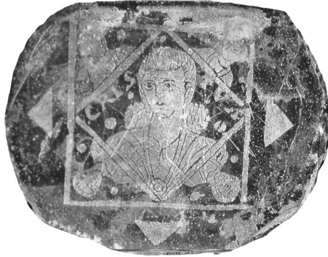
Res. 2- İsa tasvirli cam kase kaidesi, M.S. 4.yüzyıl (D. Harden 1987, s. 283, Kat. no.158)