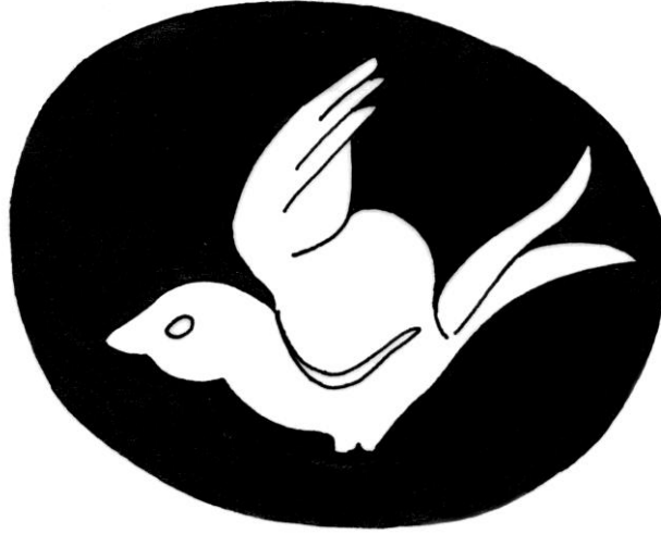
Şek. 7- Güvercin figürünün resmedildiği cam kase kaidesi çizimi, (F. Fremersdorf 1967, Tafel. 295/d).

Altın yıldız bezeli cam kaplar üzerinde zaman zaman İncil öykülerinin yanı sıra Tevrat öykülerinin de birarada kullanıldığı görülmektedir. Bu tip örneklerden biri Köln'deki Aziz Severinus mezarlığında bulunmuş bir patendir 37 (Res.6). Diğer örneklerden farklı olarak bu eserde birden çok sahne ve öykü yer almaktadır. Sahneler kabın içine serpiştirilmiş küçük madalyonlar içerisinde sunulur. Adem'le Havva'nın cennetten kovuluşu, Yunus öyküleri ve İshak'ın kurban edilişi gibi konular ilk bakışta göze çarpan sahnelerdir. Bu öykülerin arasına yerleştirilen diğer madalyonlarda da tam ya da yarım boy verilmiş kadın ve erkek figürleri yanı sıra rozet çiçekler yer alır. Eser M.S. 4. yüzyılın ikinci yarısına tarihlenmektedir 38 .