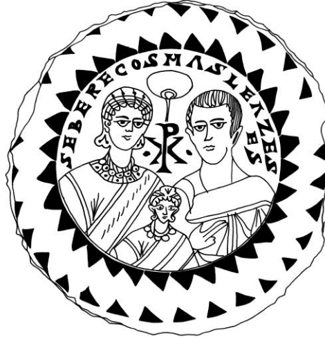
Şek. 5- İsa monogramıyla birlikte resmedilmiş aile portresi çizimi, M.S. 4.yüzyıl, (R. Milburn 1988, s. 269, fig. 178)