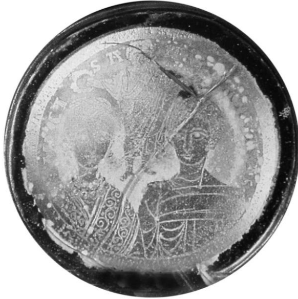
Res. 9- İsa'nın evli çiftleri taçlandırırken betimlendiği cam kase kaidesi, M.S. 4.yüzyıl, (D. Harden 1987, s. 280, Kat. no.155)