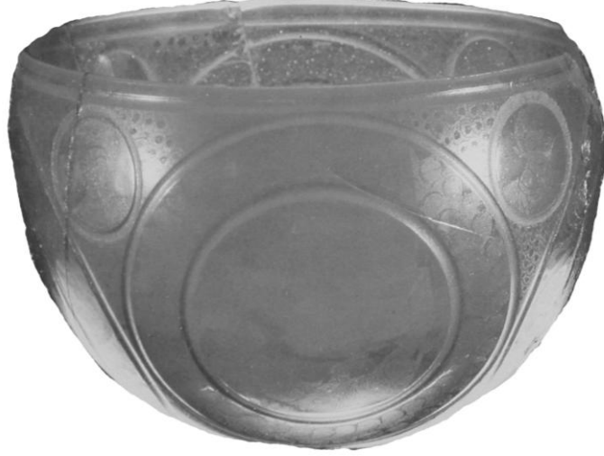
Res. 1-Altın Yıldız Bezeli Cam Kase, M.S. 4.yüzyılın ilk yarısı (D. Harden 1987, s. 25-27, Kat. no.5)