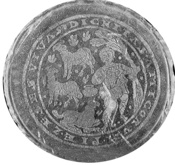
Res. 5- İyi Çoban İsa tasvirli cam kase kaidesi, M.S. 4.yüzyıl, (D. Harden 1987, s. 286, Kat. no.161)