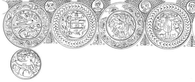
Şek. 1- Çeşitli Tevrat öyküleri ile bezeli cam kase, M.S. 4.yüzyılın ilk yarısı (D. HARDEN 1987, s. 25-27, Kat. no.5)

atılmıştır 16 . Ancak bu görüşlerle ilgili varılan son nokta, bu eserin Köln üretimi olduğu yönündedir 17 .