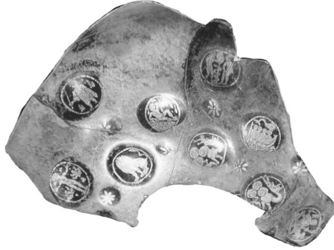
Res. 6- Altın Yıldız Bezeli Cam Kase, M.S. 4.yüzyılın ikinci yarısı, (D. Harden 1987, s. 277-279, Kat. no.154)