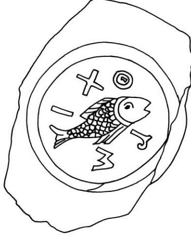
Şek. 6- Balık figürünün betimlendiği cam kase kaidesi çizimi, (F. Fremersdorf 1967, Tafel. 305 (üst))

Bu grup içerisinde İsa, Azizler ve Havarilerin bir arada gösterildiği kalabalık sahneli bir örnek kompozisyon ve figürleri ile ilgi çekicidir (Res.4). Bir çizgi ile iki bölüme ayrılmış yuvarlak bir madalyon içine toplam yedi figürün tasvir edildiği bu eser, M.S. 4. yüzyıla tarihlenir 35 . Madalyonun üst yarısında yer alan dört figür tam boy halinde hafif profilden verilmiş ve bu figürler birbirlerinden sütunlarla ayrılmıştır. Madalyonun alt yarısına ise ortada İsa ve iki yanında iki aziz olmak üzere yarım boy halinde üç figür resmedilmiştir. Tüm figürler yine yanlarında yer alan kitabeler ile izleyiciye tanıtılmaktadır. Bu eserde diğer örneklerden farklı olarak figürlerin ifade, duruş ve kıyafetlerinde Roma'dan çok Bizans üslubunu yansıtan bir bezeme anlayışı hakimdir.