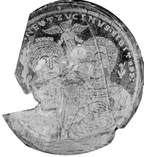
Res. 7- Eros'u Evli çiftlerle gösteren cam kase kaidesi, M.S. 4.yüzyıl, (D. Harden 1987, s. 281, Kat. no.156)