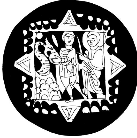
Şek. 4- Danyel'in Babil Ejderini zehirli ekmekle zehirlemesi konu edinen cam kase kaidesi çizimi, M.S. 4.yüzyıl, (R. Milburn 1988, s. 270, fig. 179)