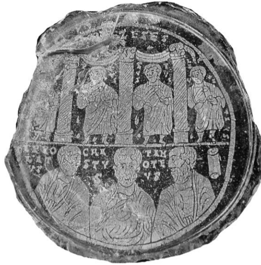
Res. 4- İsa, Azizler ve Havarilerin bir arada resmedildiği cam kase kaidesi, M.S. 4.yüzyıl, (D. Harden 1987, s. 284, Kat. no.159)