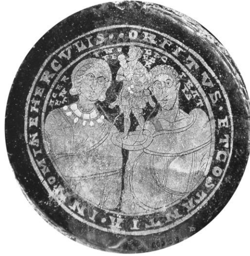
Res. 8- Herakles'i Evli çiftlerle tasvir eden cam kase kaidesi, M.S. 4.yüzyıl, (D. Harden 1987, s. 280, Kat. no.155)