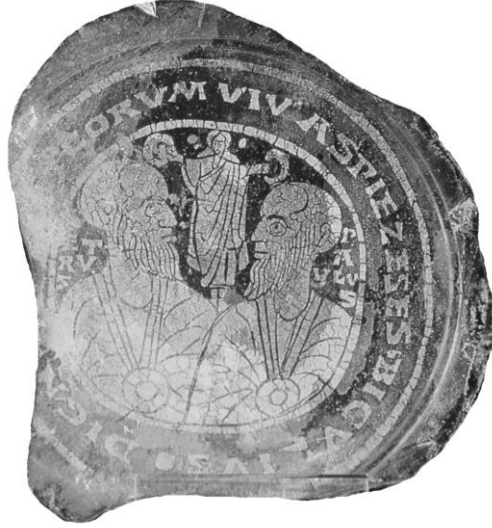
Res. 3-İsa'nın, Petrus ve Paulos'u taçlandırırken tasvir edildiği cam kase kaidesi, M.S. 4.yüzyıl, (D. Harden 1987, s. 285, Kat. no.160)