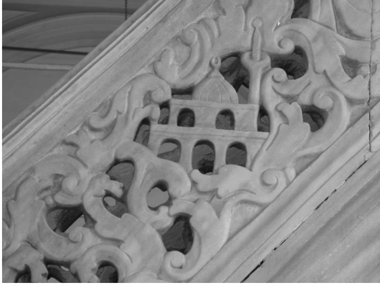
Res. 7- Hisar Camii Minberi. Batı merdiven korkuluğundaki tasvirden ayrıntı.