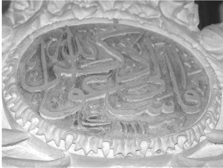
Res. 14- Salepçiođlu Camii Minberi. Giriř aıklıđının st kesimindeki kitabe.