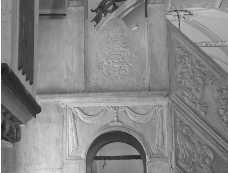
Res. 16- Şadırvan Camii Minberi. Geçit kemer köşelikleri ve köşk korkuluğu.