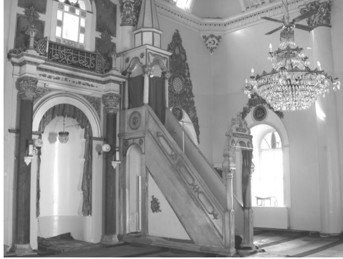
Res. 10- Kemeraltı Camii Minberi. Genel görünüm.