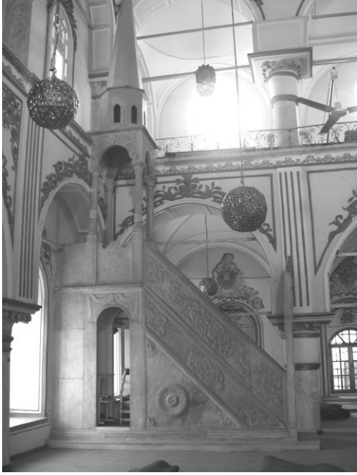
Res. 15- Şadırvan Camii Minberi. Genel görünüm.