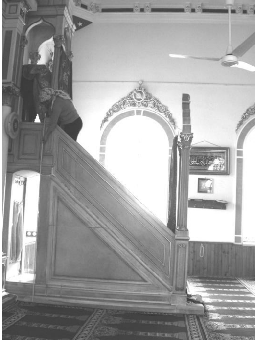
Res. 4- Hamidiye Camii Minberi. Genel görünüm.