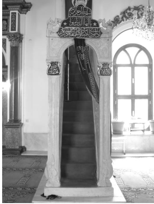
Res. 2- Bařdurak Camii Minberi. Giriř.