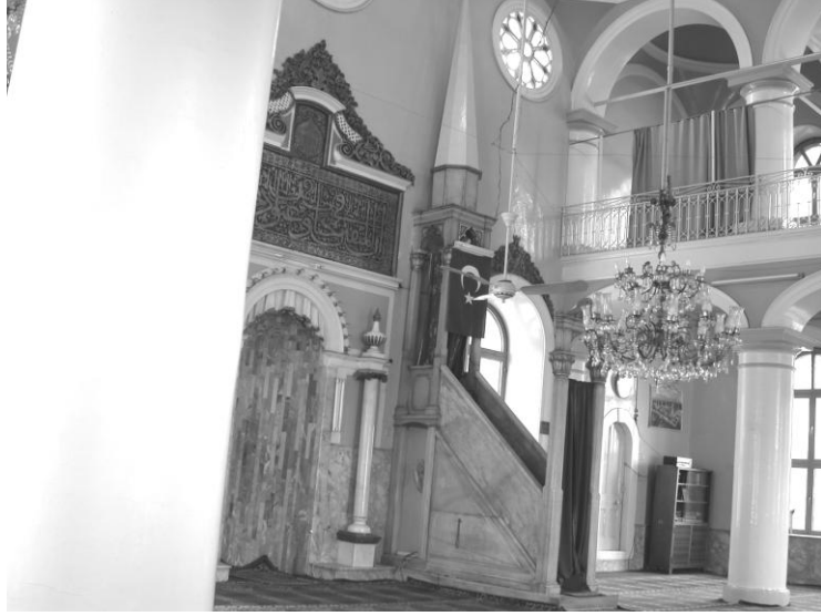
Res. 3- Çorakkapı Camii Minberi. Genel görünüm.