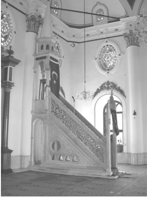
Res. 1- Bařdurak Camii Minberi. Genel grnm.