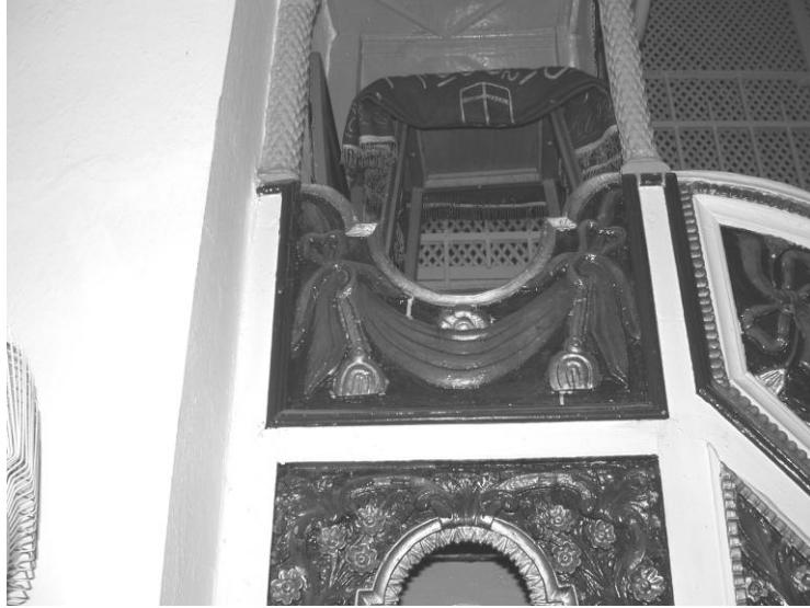
Res. 22- Kurşunlu Camii Minberi. Geçit kemer köşelikleri ve köşk korkulukları.