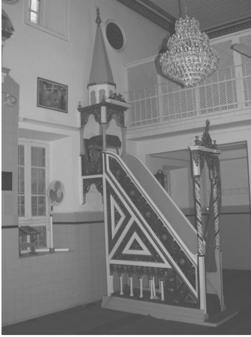
Res. 21- Kurşunlu Camii Minberi. Genel görünüm.