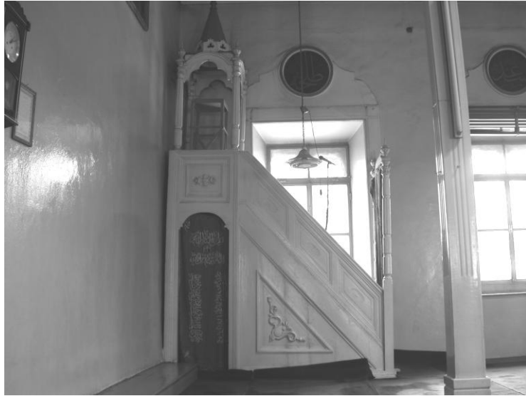
Res. 20- İkiçeşmelik Camii Minberi. Genel görünüm.