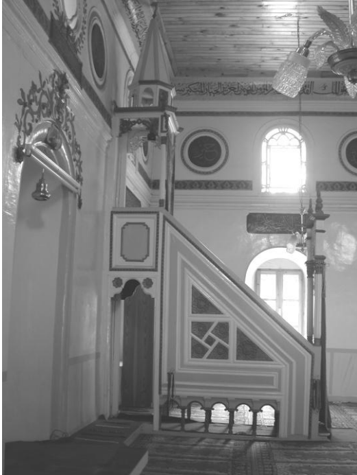
Res. 23- Şeyh Camii Minberi. Genel görünüm.