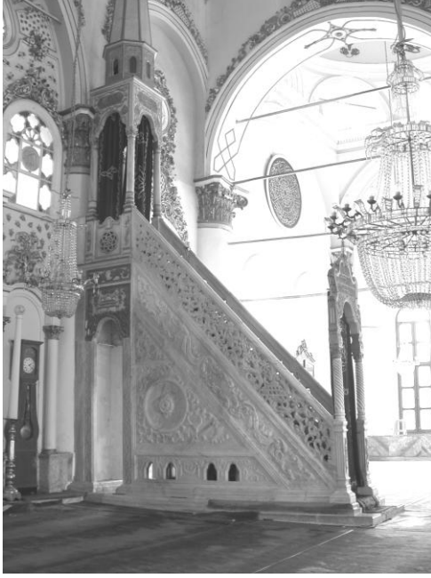
Res. 5- Hisar Camii Minberi. Genel görünüm.