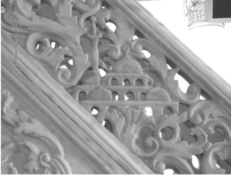
Res. 6- Hisar Camii Minberi. Doğu merdiven korkuluğundaki tasvirten ayrıntı.