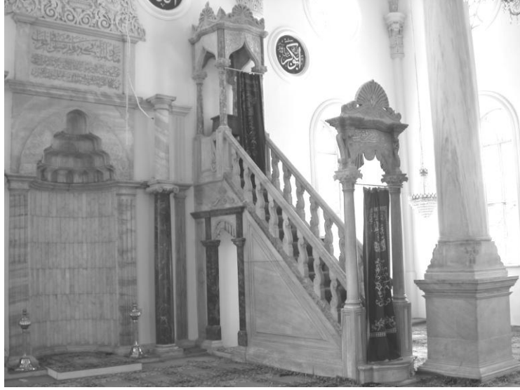
Res. 11- Kestanepazarı Camii Minberi. Genel görünüm.