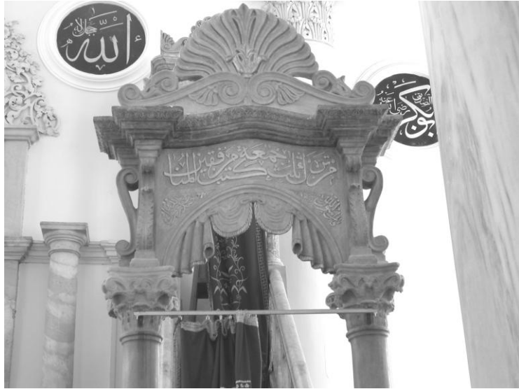
Res. 12- Kestanepazarı Camii Minberi. Girişin üst kesimi.