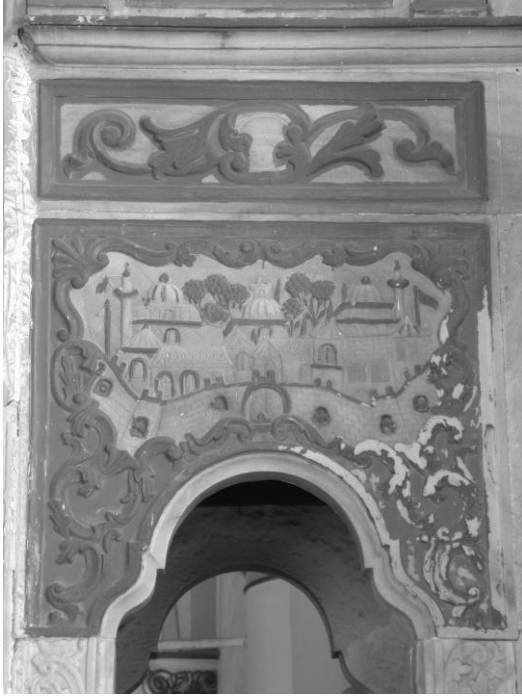
Res. 9- Hisar Camii Minberi. Geçit bölümündeki tasvirlerden batıdaki.