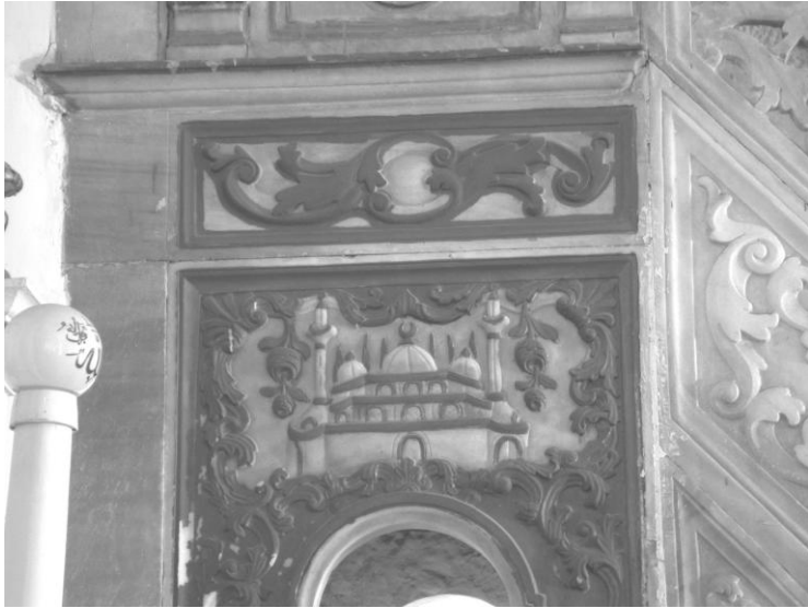
Res. 8- Hisar Camii Minberi. Geçit bölümündeki tasvirlerden doğudaki.