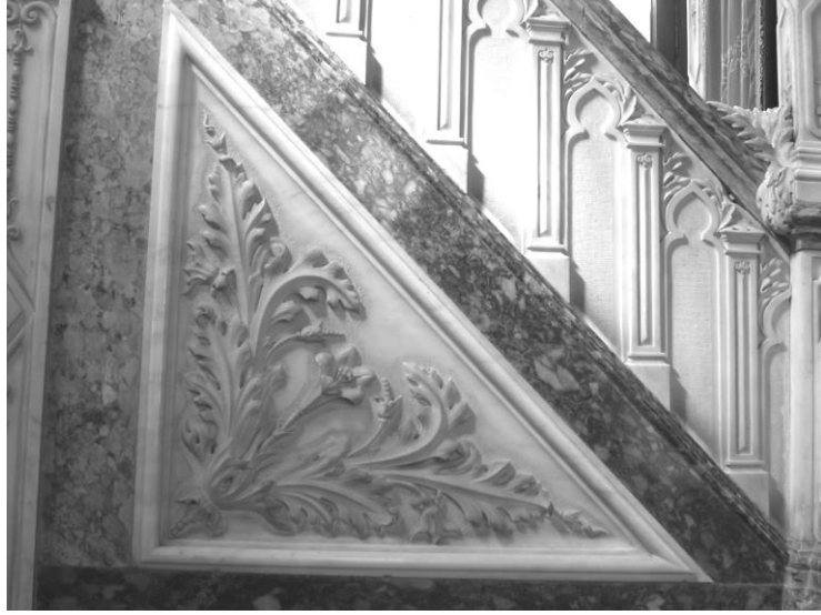
Res. 13- Salepçiođlu Camii Minberi. Dođu yan aynalık ve merdiven korkuluđu.