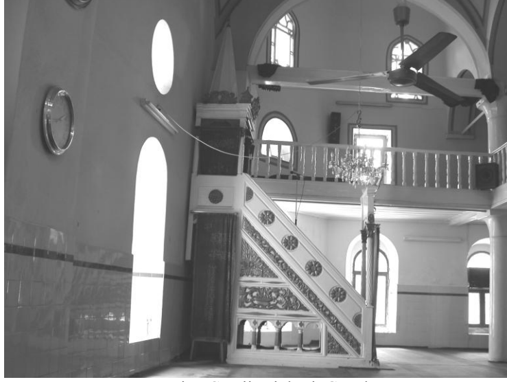
Res. 19- Hatuniye Camii Minberi. Genel görünüm.