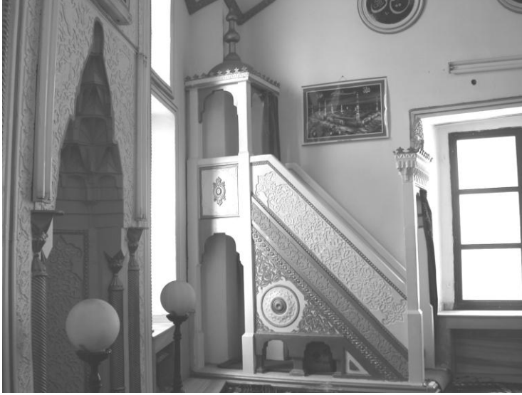
Res. 18- Hasan Hoca Mescidi Minberi. Genel görünüm.