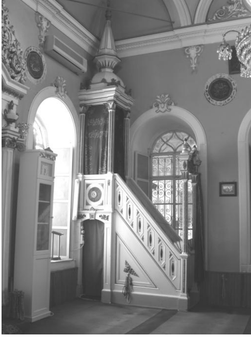
Res. 17- Hakim Bey Camii Minberi. Genel görünüm.