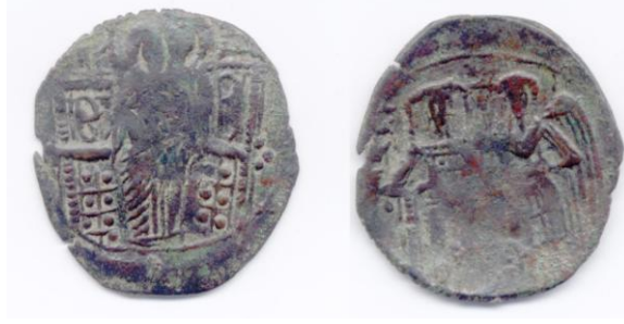
Sikke 7- Çukur, Isaakios II Angelos 1185-1195.

Kuşadası Kadıkalesi/Anaia Kazısı, 2001-2004 Yılları Kazı Dönemi.....