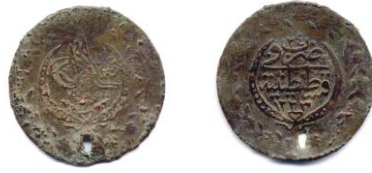
Sikke 9- Osmanlı. II. Mahmud 1831.