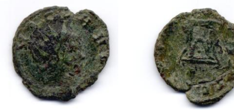
Sikke 3- Nummus. Geç Roma, Cladius II Gothicus M.S. 268-270.