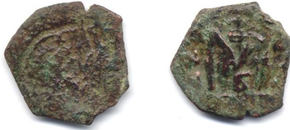
Sikke 5 – Follis. Erken Bizans Dönemi, 5. yüzyıl sonu-7. yüzyıl.