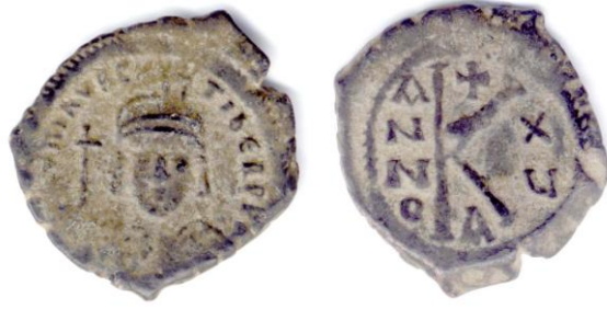
Sikke 1– Yarım Follis. Erken Bizans Dönemi, Mavrikios Tiberios (582-602), 596-7.