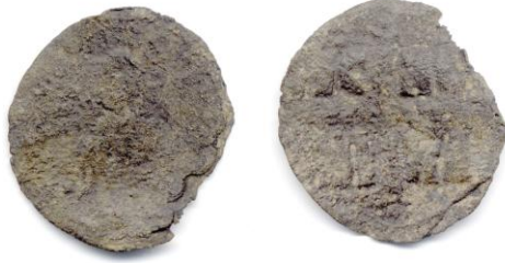
Sikke 10- Anonim Follis, 970-1092.