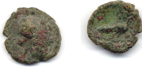
Sikke 2- Hellenistik Dönem, Hera sikkesi M.Ö. 129-20.