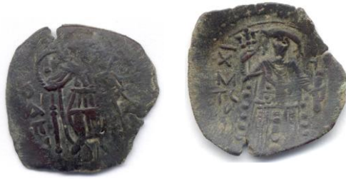
Sikke 11- Bakır çukur, Mikhail VIII Palaiologos, 1261-1282.