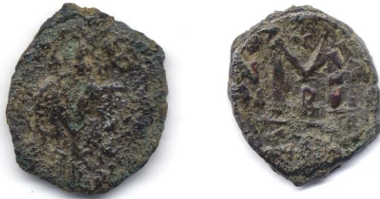
Sikke 6- Follis. Erken Bizans Dönemi, 5. yüzyıl sonu-7. yüzyıl.