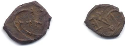
Sikke 8- Pentanummia, Iustinos II 565-578.