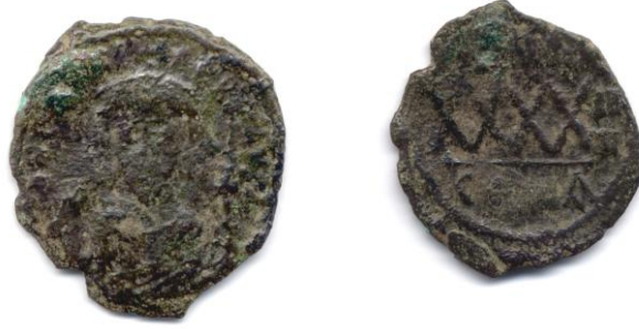
Sikke 4 – Follis. Erken Bizans Dönemi, Phokas (602-610), 605-6.