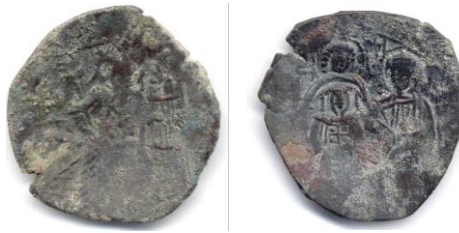
Sikke 12- Bakır çukur, Mikhail VIII Palaiologos, 1261-1282.