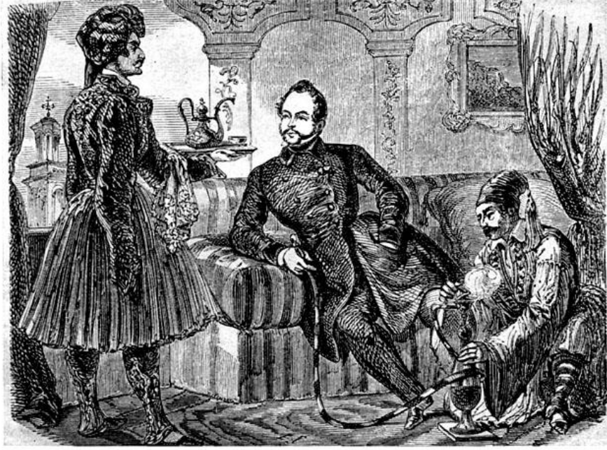
Res.1- Fransa'nın Bükreş Büyükelçisi Adolphe Billecoq, 1843, gravür.

Doğu İle Batı Arasında Bir Gezgin-Ressam: Charles Doussault (1814-1880) 1