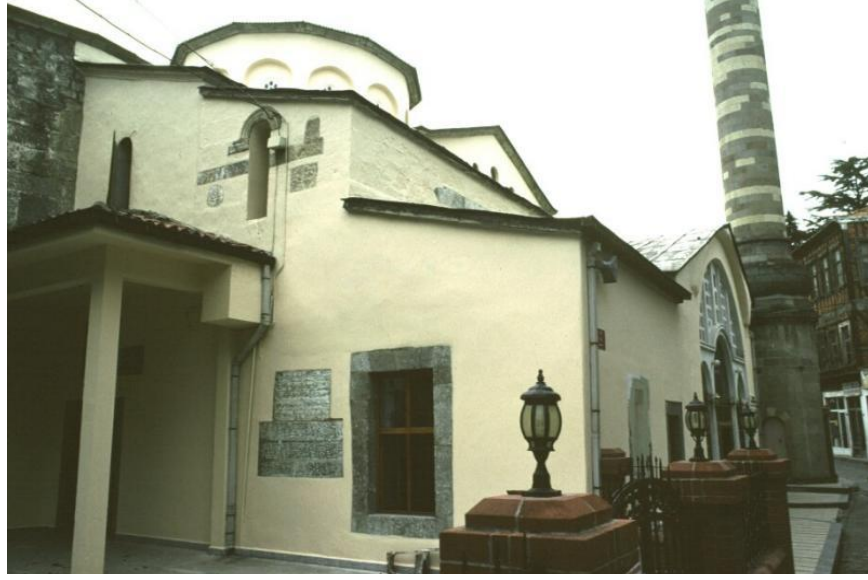
Res. 5- Trabzon Orta Hisar Camii (Panaghia Chrysokephalos Kilisesi) , ilk inşa yakl. 10. yüzyıl.

Doğu İle Batı Arasında Bir Gezgin-Ressam: Charles Doussault (1814-1880) 1