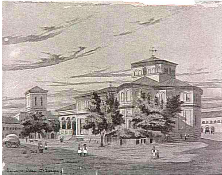
Res.12- Bükreş'te Aziz George Kilisesi , Charles Doussault, kağıt üzerine suluboya, 26x35cm. Env.no.7341, Muzeul National de Artă al României, Bükreş