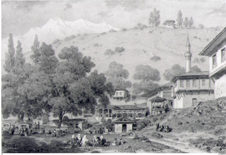
Res.6- Bursa Olympos'un (Uludağ) Zirvesinde Pınarbaşı , Charles Doussault, kağıt üzerine karakalem ve suluboya, 17x25cm. Env.no. 880.28.5, Musée des Beaux-Arts de Rennes.