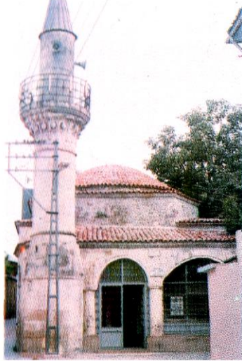
Res.3- Trabzon Musa Paşa Camii.