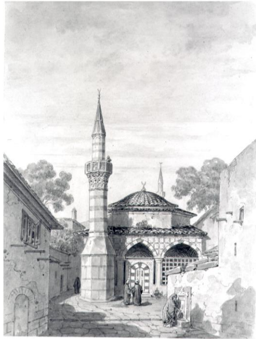
Res.2- Trabzon'da Bir Camii , Charles Doussault, kağıt üzerine karakalem ve suluboya, 27x20 cm. Env.no. 880.28.7, Musée des Beaux-Arts de Rennes.