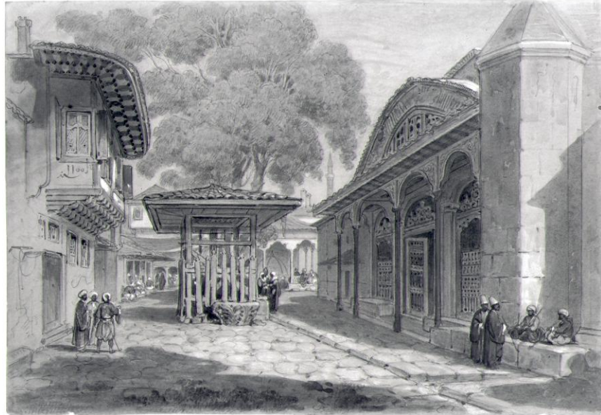
Res.4- Trabzon Orta Hisar Camii , Charles Doussault, kağıt üzerine karakalem ve suluboya, 17x25cm. Env.no. 880.28.8, Musée des Beaux-Arts de Rennes.