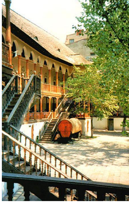
Res.10- Bükreş Manuk Hanı, 1808.