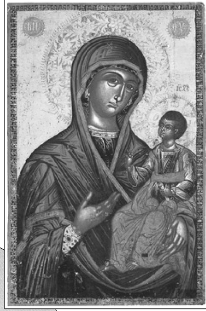
İkona-Meryem Hodegetria, 1360-70 29