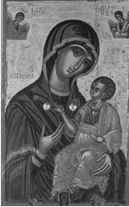
Hodegetria, Kastoria, 16. yüzyıl

Bizans sanatında yer alan Meryem tasvirleri tipolojisinde belirgin bir biçimde öne çıkan Meryem Hodegetria'dır. Hodegetria tasviri Bizans sanatında yüzyıllar boyunca farklı sanat eseri ve objelerinde kullanılmıştır. Bizans dünyasında tasvirin taşıdığı kutsal ifadenin yanı sıra, güç verdiği, taşıyanın ve hürmet edenin ise Meryem tarafından bizzat koruduğu inancı da çok önemlidir. Bu anlamda Hodegetria tasviri öncelikle ikonalar olmak üzere; dokuma, fildişi ve maden objeler, mühürler ve sikkeler gibi küçük el sanatlarında çok sık kullanılan bir tiptir. Sikkelerde Meryem tasvirlerinin ilk kullanımı 9. yüzyıl sonu - 10. yüzyıl başına tarihlenmektedir. Bu tarihten itibaren imparatorluğun yıkılışına kadar çeşitli Meryem tasvir tipleri sikke betimlerinde yer alıp, bir tipoloji oluşturmuştur. 9. yüzyıl sonu- 15. yüzyıl ortası aralığında Meryem orans, Meryem Nikopoios ya da Meryem Blakhernitissa gibi Meryem ikonografisine ait tasvirlerin devamlı kullanılmış olmalarına rağmen, Meryem Hodegetria tipine sadece tek bir imparatorun sikke biriminde rastlamaktayız. Bizans sanatında 6. yüzyılın