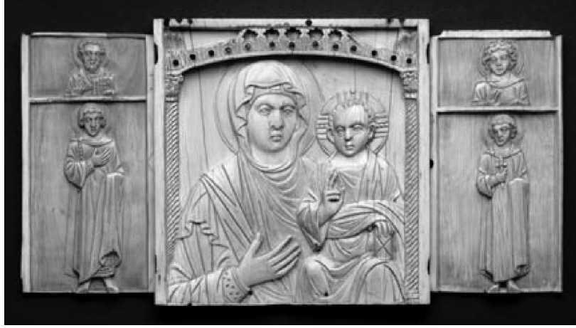
Triptik ikona, Meryem Hodegetria ve Azizler. Fildisi, 950-1000. 23

istilasını takip eden süre içerisinde, sol kolunda Çocuk İsa'yı taşıyan Meryem ikonografisi Batı'ya yayılmış ve Gotik Sanatta popüler bir konu haline gelmiştir. 21