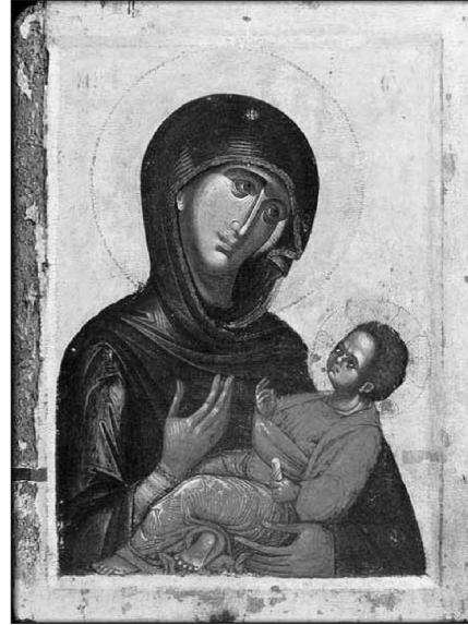
Meryem Hodegetria İkonası, Vatopedi Manastırı, 13. yüzyılın son çeyreği