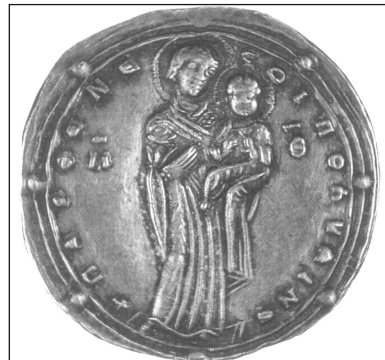
Miliaresion, III. Romanos (1028-34)

Hodegetria tasvirinin ilk olarak kullanıldığı ikona tasvirin Bizans sanatında ünlenmesi ve kullanımının yaygınlaşması bakımından önem taşımaktadır. Bu ünlü ikonanın erken tarihli kullanımına dair yazılı belge oldukça azdır. Tasvirin uzun süredir kullanıldığı ve en azından 4. yüzyıl gibi erken bir tarihe kadar geçmişi olduğu bilinmektedir. Fakat, bilinen en erken Hodegetria ikona prototipi 6. yüzyılın ortasına tarihlenmiştir de, Kondakov Hodegetria tasvirinin imparator Iustinianos öncesinde Filistin ya da Mısır'da ilk örneğinin görüldüğünü ve tüm Doğu'da 6. yüzyılın başlarında genel olarak popüler olduğunu vurgular. 7 İlk yapılan Hodegetria ikona tasvirinde Meryem bebek İsa'yı sol kolunda taşıyan tam boy bir figürdür. Aslında Meryem Hodegetria tasvir tipi İkonoklasmus dönemi öncesine tarihlenmiş ve 9. yüzyıldan itibaren patrik mühürlerinde de sıklıkla kullanılmıştır. Hodegetria terimi ise ilk olarak 11. yüzyıla ait mühürlerin tasviri ile ilişkilendirilmiştir. Dexiokratousa olarak tanımlanan Hodegetria varyasyonunda ise; Meryem İsa'yı sağ kolunda taşımaktadır. 8 Muhtemelen 11. yüzyıldan sonra, sağ kolunda Bebek İsa'yı taşıyan Meryem tasviri ikonalarda görülmeye başlamıştır. Uzun süren gelişim süreci sonunda ise tam boy kompozisyon yavaş yavaş, sol ya da sağ kolunda Çocuk İsa'yı taşıyan yarım boy