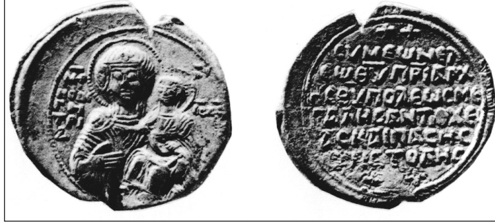
Kursun mühür, 1206-1235 27

Geç Bizans döneminde ise Hodegetria tasvir tipi ait olduğu dönemin sanatsal özelliklerini taşımıştır. Yüzlerin tasvir şekli tipiktir; oval ve kısa düz burunlar, küçük ve şişkin az aralıkla yerleştirilmiş gözler. Yüzlerin bu tip tasviri 14. yüzyıldan 15. yüzyıla geçiş sürecindeki küçük heykel sanatlarındaki sayısız çalışma ile paralellik göstermektedir. Ciddi görünümlü ve görkemli her iki figür de İsa'nın Tanrısallığını vurgular. İsa bir çocuk olarak tam boy tasvir edilmiş olup, olgun yüzü ve uzun alnı da bilgeliğinin sembolü olmuştur. Meryem ise tüm insanlığa doğru yolun İsa'da olduğunu ve takip edilmesi gerektiğini tasvirde ifade etmektedir