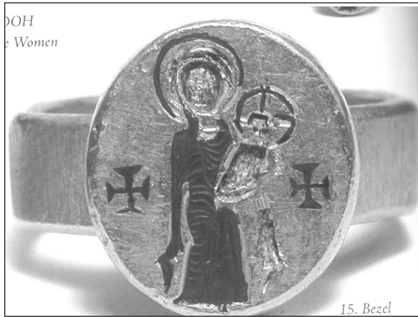
Niello Tekniği ile yapılmış altın yüzük. 22

12. yüzyıldan itibaren Konstantinopolis'teki Manastırında korunan Hodegetria tasviri başından beri Hristiyan Kilisesinin en ünlü ikona tasviri olarak tüm Ortodoks dünyasında en çok çoğaltılan Meryem tasvir tipi olmuştur. 18 Hodegetria tasviri fildişi ve mine işi objeler, ikonalar gibi küçük el sanatı eserlerinde yer aldığı gibi mozaik ve fresklerde de görülmektedir. Meryem tasvirleri de dâhil olmak üzere çeşitli tasvir örnekleri içeren ve 10. yüzyılın sonlarına tarihlenen çok sayıda fildişi objenin olması ise, Bizans imparatorlarının 10. yüzyılın ikinci yarısında doğuda başarılı seferler düzenlemiş olmaları sonucu çok miktarda fildişinin imparatorluğa gelmesine bağlanmaktadır. 19 Hodegetria, Orta Bizans Dönemi boyunca küçük el sanatlarına ait tüm objelerde olduğu gibi, anıtsal mimaride de çok yaygın biçimde kullanılmıştır. Ortaçağ dönemi boyunca Bizans kültürünü yaşayan her yerde de kullanılan bir Meryem tasvir tipidir. Sinai Dağında Orta Bizans Dönemine ait göğsünde çocuk İsa'yı taşıyan Meryem'in yanında ayakta durarak yardım dileyen kâhin ya da aziz tasvirleri içeren farklı ikonalar da bulunmaktadır. 20 Orta Bizans dönemi fildişi oyma sanatında ise en çok tasvir edilen Meryem tipidir. Bu dönemde fildişi objelerde sol kolunda çocuk İsa'yı taşıyan ve sağ eli ile İsa'yı işaret eden, yarım boy Hodegetria tasviri sıklıkla kullanılmıştır. 1204 yılında Konstantinopolis'in Latinler tarafından