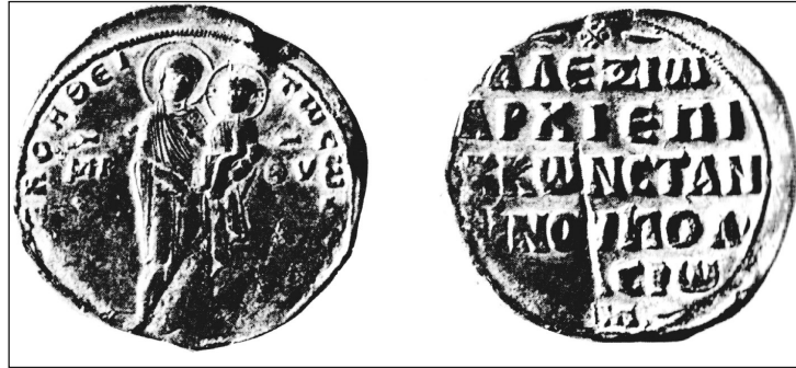
Kursun mühür, 1025-1043 26

Meryem sol kolunda çocuk İsa'yı taşır; bakışı ya kendisine bakana ya da uzağa doğru iken sağ eli İsa'yı işaret etmektedir. İsa kollarında dik ve rahat bir halde otururken kucığında bir tomar taşır ve sağ eli takdis pozisyonundadır. İsa ise doğrudan izleyiciden başka bir yöne doğru bakmaktadır. Hamilton Psalterindeki minyatürde ise Hodegetria ikonasının kendisi betimlenmiş olmalıdır. Bu tasviri taşıyan ikonanın birçok kopyası ise, kopyaların kendilerine uygun mucizelerini canlandırmak için devam etmiştir. Bunların arasında; 'Psychosostria' ve 'Peribleptos' vardır. 24 Daha duygusal Meryem Eleousa tipi ise Hodegetria tasvirinden türemiş olup; saklama ve sevgi arasındaki ayarını daima tam anlamıyla korumuştur. 25