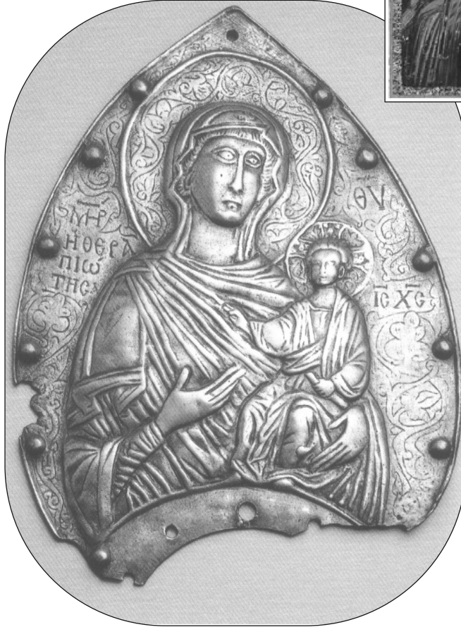
Meryem Hodegetria, 14. yy. başları, Konstantinopolis 30